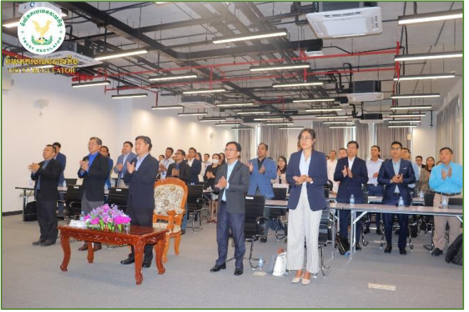
រូបភាព៖ សិក្ខាសាលាផ្សព្វផ្សាយស្តីពី ការដាក់ឱ្យអនុវត្តគេហទំព័ររបស់ គ.ប.វ. ជាផ្លូវការ។

(អ.ស.ប.) និងតំណាងមកពីបរិច្ឆេទបាល, ប្រតិបត្តិករផ្តល់សេវា រក្សាទុក ឬសេវារក្សាសុវត្ថិភាពក្នុងវិស័យបរិច្ឆេទបាលកិច្ច, ក្រុមហ៊ុន ផ្តល់សេវាវាយតម្លៃក្នុងវិស័យបរិច្ឆេទបាលកិច្ច និងបុគ្គលពាក់ព័ន្ធ ផ្តល់សេវាក្នុងវិស័យបរិច្ឆេទបាលកិច្ច នៅមជ្ឈមណ្ឌលអភិវឌ្ឍន៍ធុរកិច្ច (BDC)។ គោលបំណងនៃសិក្ខាសាលានេះ គឺដើម្បីប្រកាសដាក់ឱ្យ អនុវត្តនូវគេហទំព័រ (Website) របស់ គ.ប.វ. ជាផ្លូវការ ក៏ដូចជា ដើម្បីធ្វើការផ្សព្វផ្សាយឱ្យកាន់តែទូលំទូលាយបន្ថែមទៀតនូវ Website របស់ គ.ប.វ. ទៅដល់និយ័តករនិងអង្គការក្រោមឱវាទ អ.ស.ប., កូអរដោនេដឹកនាំពាក់ព័ន្ធទាំងអស់នៅក្នុងវិស័យបរិច្ឆេទ- បាលកិច្ច និងសាធារណជន ដែលសំដៅដល់ការដាក់ឱ្យអនុវត្ត ប្រកបដោយសណ្តាប់ធ្នាប់ តម្លាភាព និងទំនុកចិត្ត ក៏ដូចជាការផ្តល់ នូវភាពងាយស្រួលដល់អ្នកចូលមើល (Visitor) ក្នុងការទាញយក នូវរាល់ឯកសារផ្សេងៗដែលពាក់ព័ន្ធនឹងវិស័យបរិច្ឆេទបាលកិច្ច ជាដើម។