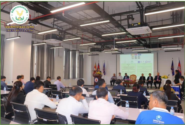
រូបភាព៖ សិក្ខាសាលាស្តីពី ការប្រកួតប្រជែងទទួលបានការងារអនុវត្តគម្រោងឆ្នាំ ២០២៣ និងទិសដៅការងារឆ្នាំ២០២៤ នៃគម្រោង ACSEP សមាស ភាគទី១។

សិក្ខាសាលានេះ មានការចូលរួមពីសមាជិក/សមាជិកា និងទីប្រឹក្សារបស់ ACSEP PIU1, តំណាងមកពីអគ្គនាយកដ្ឋាន សហប្រតិបត្តិការអន្តរជាតិ និងគ្រប់គ្រងបំណុលនៃ គ.ស.ប.វ., តំណាងអង្គការគ្រប់គ្រងគម្រោងមកពីក្រសួងកសិកម្ម រុក្ខាប្រមាញ់ និងនេសាទ និងក្រុមការងារមកពីស្ថាប័នហិរញ្ញវត្ថុដៃគូទាំងពីររួមមាន ធនាគារអភិវឌ្ឍន៍ជនបទនិងកសិកម្ម និងធនាគារស្ថាបនា។