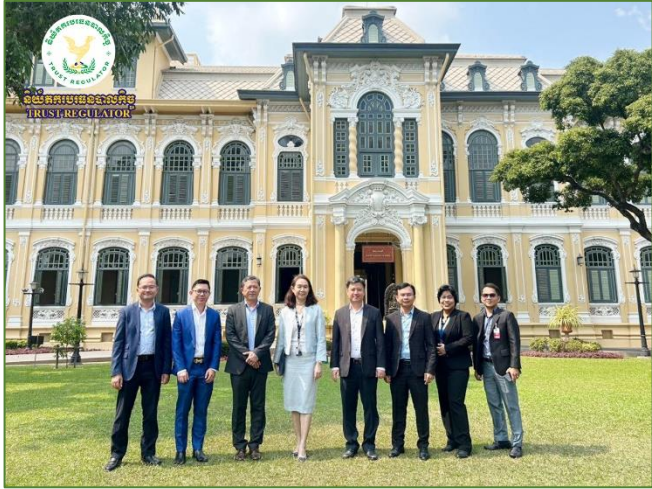
រូបភាព៖ ទស្សនកិច្ចសិក្សាដកស្រង់បទពិសោធន៍នៅធនាគារជាតិនៃ ប្រទេសថៃ និងសមាគមបច្ចេកវិទ្យាហិរញ្ញវត្ថុថៃ។

ដោយមានការអនុញ្ញាតដ៏ខ្ពង់ខ្ពស់ពី ឯកឧត្តមអគ្គបណ្ឌិត សភាចារ្យ ឧបនាយករដ្ឋមន្ត្រី រដ្ឋមន្ត្រីក្រសួងសេដ្ឋកិច្ចនិងហិរញ្ញវត្ថុ និងជាប្រធានក្រុមប្រឹក្សាអាជ្ញាធរលើសវិញ្ញវត្ថុមិនមែនធនាគារ (ឧ.ស.ធា.), ចាប់ពីថ្ងៃទី ១-២ ខែកុម្ភៈ ឆ្នាំ២០២៤ ឯកឧត្តម សុខ ដារី អគ្គនាយកនៃនិយ័តករបរធនបាលកិច្ច (ន.ប.ធរ.) អមដោយ ឯកឧត្តមអគ្គនាយករង និងសហការីនៃ ន.ប.ធរ. បានធ្វើទស្សនកិច្ច សិក្សាដកស្រង់បទពិសោធន៍នៅធនាគារជាតិនៃប្រទេសថៃ និង សមាគមបច្ចេកវិទ្យាហិរញ្ញវត្ថុថៃ ពាក់ព័ន្ធនឹងយុទ្ធសាស្ត្រអភិវឌ្ឍ បច្ចេកវិទ្យាហិរញ្ញវត្ថុ, បរិស្ថានសាកល្បងបច្ចេកវិទ្យាហិរញ្ញវត្ថុ (FinTech's Regulatory Sandbox), បច្ចេកវិទ្យាគ្រប់គ្រងទ្រព្យ- សម្បត្តិ (WealthTech), បច្ចេកវិទ្យាប្លុកឆេន (Blockchain Technology), គម្រោងបច្ចេកវិទ្យាអនាគត, បទល្មើសបច្ចេកវិទ្យា (Digital and Cyber Fraud), ក្របខណ្ឌគតិយុត្ត និងការគ្រប់គ្រងត្រួតពិនិត្យ ហានិភ័យ។