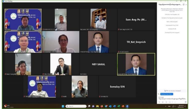
រូបភាព៖ កិច្ចប្រជុំពិភាក្សាលើវឌ្ឍនភាពនៃការរៀបចំយុទ្ធសាស្ត្រអភិវឌ្ឍ វិស័យបរិច្ឆេទបាលកិច្ចសម្រាប់រយៈពេល ១០ ឆ្នាំ (២០២៣-២០៣២)។

តាមប្រព័ន្ធអនឡាញ (Zoom)។ កិច្ចប្រជុំពិភាក្សានេះ មានការអញ្ជើញ ចូលរួមដោយ ឯកឧត្តមអគ្គនាយករង លោក/លោកស្រីប្រធាន នាយកដ្ឋាន និងសមាជិកក្រុមការងាររៀបចំយុទ្ធសាស្ត្រអភិវឌ្ឍវិស័យ បរិច្ឆេទបាលកិច្ចសម្រាប់រយៈពេល ១០ ឆ្នាំ (២០២៣-២០៣២)។