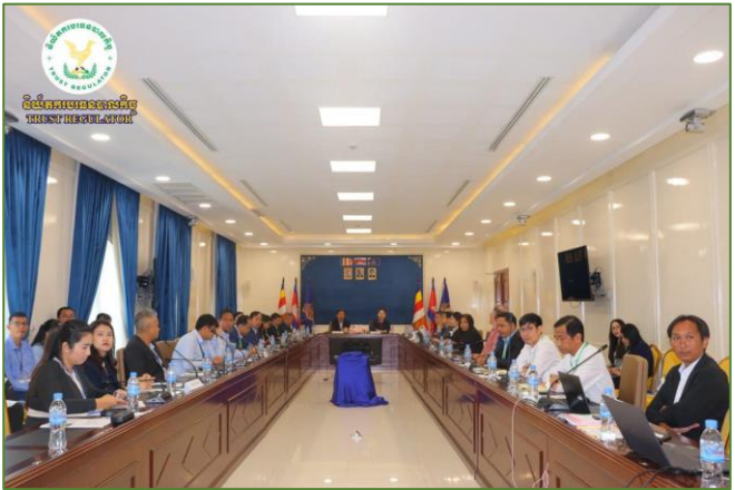
រូបភាព៖ កិច្ចប្រជុំជាមួយប្រតិភូធនាគារអភិវឌ្ឍន៍អាស៊ី ស្តីពី ការពិនិត្យវឌ្ឍនភាពការងារក្នុងឆ្នាំ២០២៣ និងទិសដៅការងារឆ្នាំ២០២៤។

កិច្ចប្រជុំនេះ មានការចូលរួមដោយ លោកស្រី Hyunyoung Song ប្រធានក្រុមបេសកកម្ម ធនាគារអភិវឌ្ឍន៍អាស៊ី (ADB) និងប្រតិភូអមដំណើរ, លោក Wong Keet Loong នាយកប្រតិបត្តិសាធារណៈធនាគារកម្ពុជា និងសហការី, សមាជិក/សមាជិកា និងទីប្រឹក្សារបស់ ACSEP PIU1, តំណាងមកពីអគ្គនាយកដ្ឋានសហប្រតិបត្តិការអន្តរជាតិ និងគ្រប់គ្រងបំណុលនៃ គ.ស.ហ.វ. , តំណាងអង្គការគ្រប់គ្រងគម្រោងមកពីក្រសួងកសិកម្ម រុក្ខាប្រមាញ់ និងនេសាទ និងក្រុមការងារមកពីស្ថាប័នហិរញ្ញវត្ថុដៃគូទាំងពីររួមមានធនាគារអភិវឌ្ឍន៍ជនបទនិងកសិកម្ម និងធនាគារស្ថាបនា។