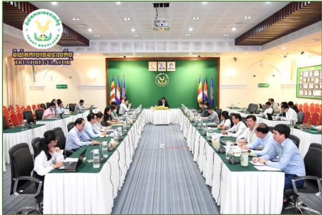
រូបភាព៖ កិច្ចប្រជុំពិភាក្សាលើ “សេចក្តីព្រាងច្បាប់ភូមិបាល”។