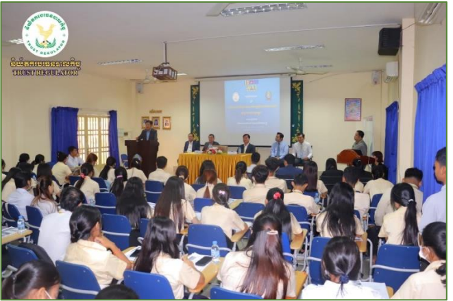
រូបភាព៖ សិក្ខាសាលាស្តីពី ការឈ្វេងយល់ពីកិច្ចដំណើរការអភិវឌ្ឍន៍វិស័យបរធនបាលកិច្ចនៅព្រះរាជាណាចក្រកម្ពុជា។

កម្មវិធីនេះ មានការអញ្ជើញចូលរួមពីថ្នាក់ដឹកនាំជាន់ខ្ពស់នៃ ន.ប.ប. និងមន្ត្រីជំនាញ, សាស្ត្រាចារ្យ, និងនិស្សិត នៃវិទ្យាស្ថានជាតិពាណិជ្ជសាស្ត្រ។