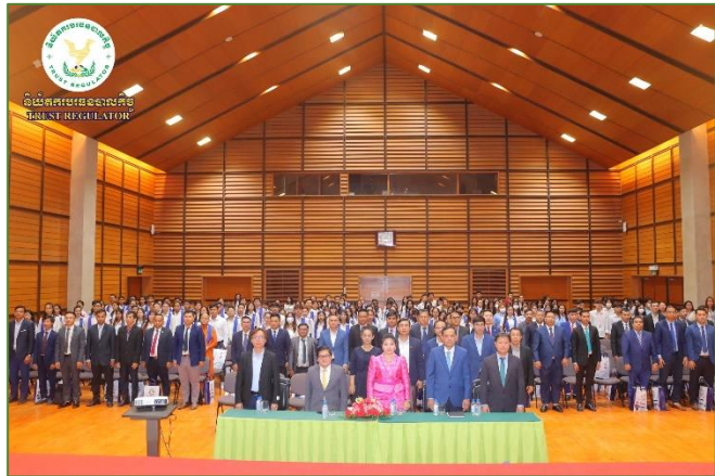
រូបភាព៖ កម្មវិធីបើកបរិស្ថានកាល ២០២៣-២០២៤ និងប្រគល់ប័ណ្ណសរសើរ និងមេដាយជូននិស្សិតថ្នាក់បរិញ្ញាបត្រ និង គណនេយ្យ។