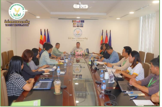
រូបភាព៖ កិច្ចប្រជុំបូកសរុបការងារប្រចាំខែមករា ឆ្នាំ២០២៤ និងទិសដៅ ការងារប្រចាំខែកុម្ភៈ ឆ្នាំ២០២៤។

នៅក្នុងកិច្ចប្រជុំនេះ ឯកឧត្តមអគ្គនាយករងបានធ្វើការ វាយតម្លៃខ្ពស់លើសមិទ្ធផលការងារដែលសម្រេចបានក្នុងខែមករា ព្រមទាំងបានកោតសរសើរដល់កិច្ចខិតខំប្រឹងប្រែង និងការទទួល ខុសត្រូវខ្ពស់របស់ថ្នាក់ដឹកនាំ និងមន្ត្រីទាំងអស់នៃនាយកដ្ឋាន ទាំងពីរ និងបានផ្តល់ជាអនុសាសន៍ណែនាំសម្រាប់ទិសដៅការងារ នៅក្នុងខែបន្ទាប់ផងដែរ។ កិច្ចប្រជុំនេះ បានបញ្ចប់ដោយរលូន ប្រកបដោយផ្លែផ្កា និងស្មារតីទទួលខុសត្រូវខ្ពស់។