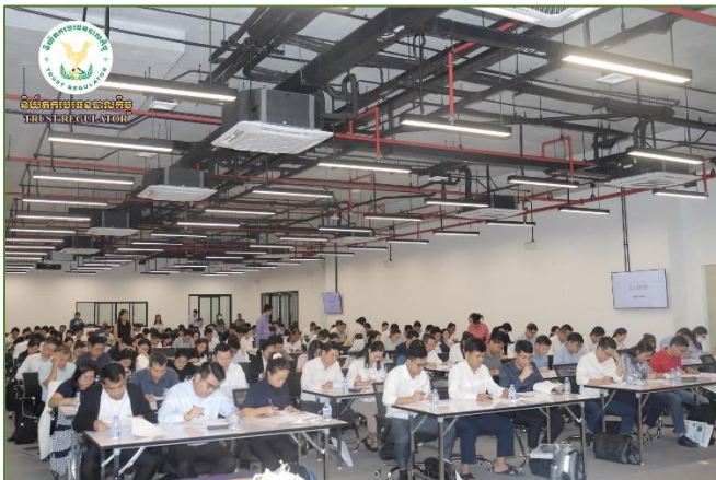
រូបភាព៖ ការប្រឡងគុណវុឌ្ឍិក្នុងវិស័យបរិស្ថានបរិស្ថានកិច្ច លើកទី៤ ឆ្នាំ២០២៤។