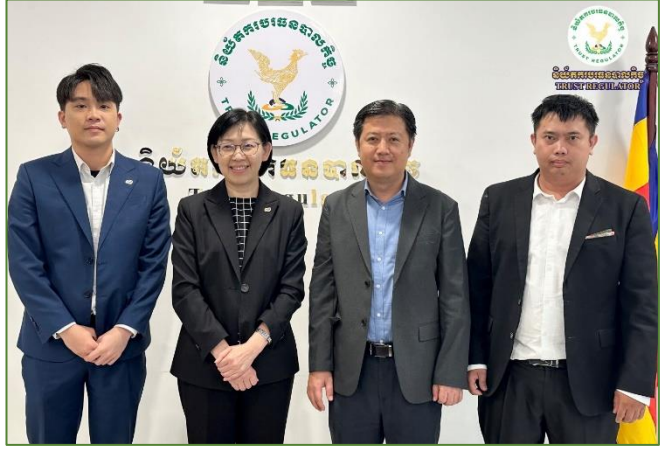
រូបភាព៖ កិច្ចប្រជុំពិភាក្សាការងាររវាង ន.ប.ជ. ជាមួយក្រុមហ៊ុន VTeam Financial Services Group។