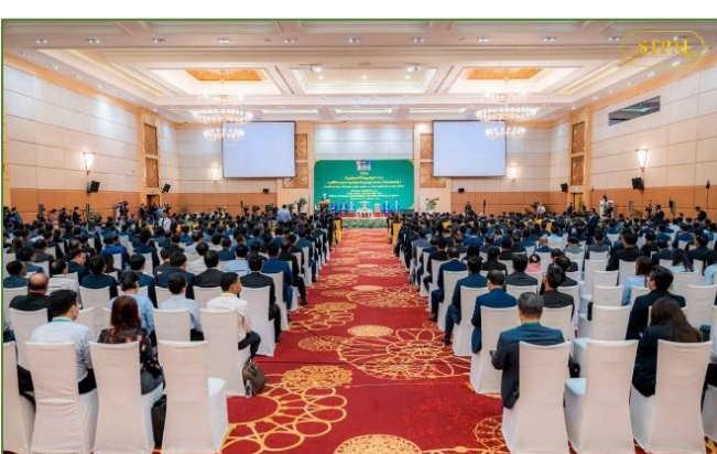
រូបភាព៖ ពិធីបិទកិច្ចប្រជុំត្រួតពិនិត្យប្រចាំឆ្នាំ២០២៣ នៃការអនុវត្តកម្មវិធីកែទម្រង់ការគ្រប់គ្រងហិរញ្ញវត្ថុសាធារណៈ ដំណាក់កាលទី៤។