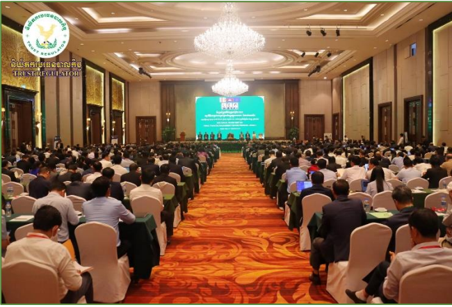
រូបភាព៖ កិច្ចប្រជុំត្រួតពិនិត្យប្រចាំឆ្នាំ២០២៣ នៃការអនុវត្តកម្មវិធីកែទម្រង់ការគ្រប់គ្រងហិរញ្ញវត្ថុសាធារណៈ ដំណាក់កាលទី៤។