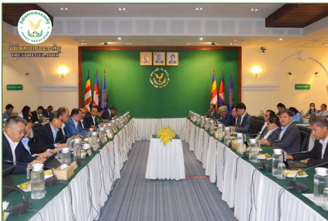
រូបភាព៖ កិច្ចប្រជុំត្រួតពិនិត្យការអនុវត្តថវិកាប្រចាំឆ្នាំ២០២៣ របស់ក្រសួង សេដ្ឋកិច្ចនិងហិរញ្ញវត្ថុ។