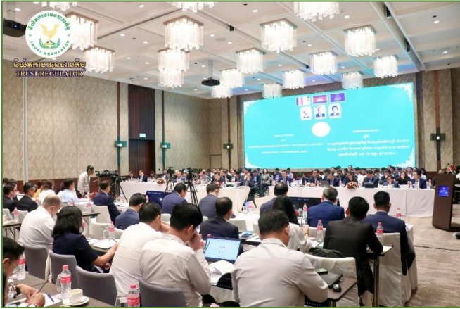
រូបភាព៖ វេទិកាសាធារណៈស្តីពីការផ្សព្វផ្សាយច្បាប់ស្តីពីហិរញ្ញវត្ថុសម្រាប់ គ្រប់គ្រងឆ្នាំ២០២៤។