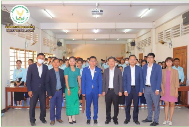
រូបភាព៖ សិក្ខាសាលាស្តីពី ការឈ្លែងយល់ពីកិច្ចដំណើរការអភិវឌ្ឍន៍វិស័យ បរទេសបាលកិច្ចនៅព្រះរាជាណាចក្រកម្ពុជា។