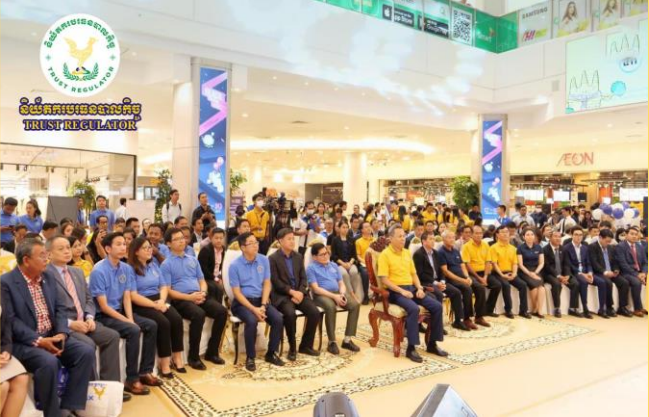
រូបភាព៖ ពិធីពិព័រណ៍ផ្សារភាគហ៊ុនកម្ពុជា "My First STOCK" ។

នាព្រឹកថ្ងៃព្រហស្បតិ៍ ៤កើត ខែកត្តិក ឆ្នាំថោះ បញ្ចស័ក ព.ស.២៥៦៧ ត្រូវនឹងថ្ងៃទី១៦ ខែវិច្ឆិកា ឆ្នាំ២០២៣ ឯកឧត្តម សុខ ដារ៉ា អគ្គនាយកនៃនិយ័តករបរធនបាលកិច្ច (ន.ប.ធន.) បាន អញ្ជើញចូលរួមក្នុងពិធីពិព័រណ៍ផ្សារភាគហ៊ុនកម្ពុជា "My First STOCK" ប្រចាំឆ្នាំ២០២៣ ក្រោមអធិបតីដ៏ខ្ពង់ខ្ពស់របស់ ឯកឧត្តមបណ្ឌិត សភាឧប្បមាណ សាស្ត្រ រដ្ឋលេខាធិការក្រសួងសេដ្ឋកិច្ចនិងហិរញ្ញវត្ថុ និងជាប្រធានក្រុមប្រឹក្សាភិបាលនៃផ្សារមូលបត្រកម្ពុជា ដែលធ្វើឡើង នៅផ្សារទំនើបអ៊ីអន១ភ្នំពេញ។