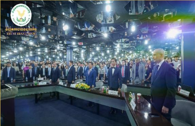
រូបភាព៖ កម្មវិធីចែករំលែកចំណេះដឹងស្តីពី "ចក្ខុវិស័យទ្រទ្រង់សហគ្រាសធុនតូច និងមធ្យម" នៅវិទ្យាស្ថានខេមអេដ។

នាស៊ីលាថ្ងៃពុធ ៣រោច ខែអស្សុជ ឆ្នាំថោះ បញ្ចស័ក ព.ស. ២៥៦៧ ត្រូវនឹងថ្ងៃទី១ ខែវិច្ឆិកា ឆ្នាំ២០២៣ ក្រោមក្របខណ្ឌនៃអនុស្សរណៈនៃការយោគយល់គ្នារវាង និយ័តករបរធនបាលកិច្ច (ន.ប.ប.) និងវិទ្យាស្ថានខេមអេដ និងដោយទទួលបានការអនុញ្ញាតដ៏ខ្ពង់ខ្ពស់ពី ឯកឧត្តមសុខ ដារ៉ា អគ្គនាយកនៃនិយ័តករបរធនបាលកិច្ច (ន.ប.ប.) មន្ត្រីជំនាញនៃ ន.ប.ប. បានចូលរួមកម្មវិធីចែករំលែកចំណេះដឹងស្តីពី "ចក្ខុវិស័យទ្រទ្រង់សហគ្រាសធុនតូច និងមធ្យម" ក្រោមអធិបតីភាពដ៏ខ្ពង់ខ្ពស់របស់ ឯកឧត្តម ហែង ចន្ទធី រដ្ឋមន្ត្រីក្រសួងឧស្សាហកម្ម វិទ្យាសាស្ត្រ បច្ចេកវិទ្យា និងនវានុវត្តន៍ នៅវិទ្យាស្ថានខេមអេដ។