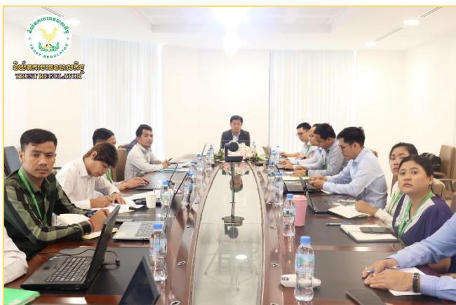
រូបភាព៖ ប្រជុំពិភាក្សាការងារជាមួយក្រុមហ៊ុន TrustQuay។