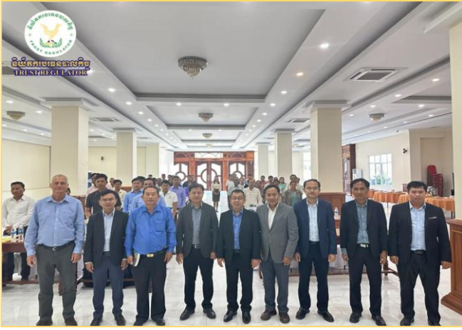
រូបភាព៖ វគ្គបណ្តុះបណ្តាលស្តីពី "ការរៀបចំសំណើអាជីវកម្ម"។