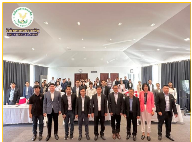
រូបភាព៖ សិក្ខាសាលាផ្សព្វផ្សាយស្តីពី “ការដាក់ឱ្យអនុវត្តជាផ្លូវការម៉ាស៊ីនមេ សម្រាប់ការប្រើប្រាស់ផ្ទៃក្នុងរបស់ ន.ប.ប.” និងសេចក្តីណែនាំស្តីពី “ការប្រើប្រាស់ ប្រព័ន្ធគ្រប់គ្រងឯកសាររបស់ ខ.ប.ប.” ក្នុងក្របខណ្ឌនៃការអនុវត្តសកម្មភាព ការងារកែទម្រង់ការគ្រប់គ្រងហិរញ្ញវត្ថុសាធារណៈ (PFM) ប្រចាំឆ្នាំ២០២៣។

សិក្ខាសាលាផ្សព្វផ្សាយនេះ រៀបចំឡើងក្នុងគោលបំណង ដើម្បីបញ្ជ្រាបការយល់ដឹងបន្ថែមឱ្យបានកាន់តែទូលំទូលាយដល់ ថ្នាក់ដឹកនាំ និងមន្ត្រីនៃ ខ.ប.ប. អំពីដំណើរការ និងនីតិវិធីប្រើប្រាស់ ម៉ាស៊ីន Server ប្រកបដោយ ប្រសិទ្ធភាព និងមានសុវត្ថិភាពខ្ពស់ ក៏ដូចជាការអនុវត្តប្រព័ន្ធគ្រប់គ្រងឯកសាររបស់ ខ.ប.ប. ដែល មានដំណើរការនៅលើបណ្តាញអ៊ីនត្រាណេតផ្ទៃក្នុងរបស់ ខ.ប.ប. និងការសិក្សារៀនសូត្របន្ថែមទៅលើយន្តការ និងនីតិវិធីនៃការកំណត់ ពីអត្តសញ្ញាណអតិថិជនឌីជីថល (Digital KYC and e-Signature)។