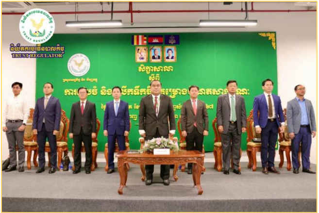
រូបភាព៖ សិក្ខាសាលាស្តីពី ការរៀបចំ និងការលើកទឹកចិត្តគម្រោងចំណតសាធារណៈ។

នៅក្នុងសិក្ខាសាលានេះ ឯកឧត្តមបានផ្តល់មតិជាធាតុចូលអំពីយន្តការមួយចំនួនដែលជាជម្រើសក្នុងការវិនិយោគលើគម្រោងចំណតសាធារណៈ ក្នុងនោះយន្តការបរធនបាលកិច្ច ជាជម្រើសមួយដ៏សំខាន់ដែលអាចអនុញ្ញាតឱ្យវិនិយោគិនក្នុងស្រុក និងបរទេសអាចធ្វើការវិនិយោគប្រកបដោយទំនុកចិត្ត។