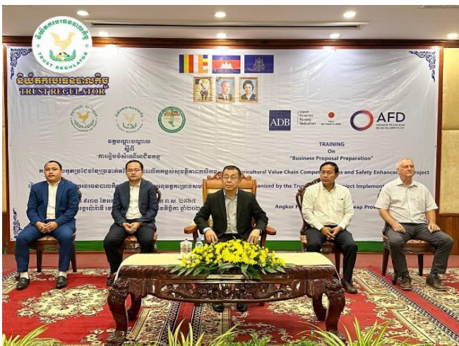
រូបភាព៖ វគ្គបណ្តុះបណ្តាលស្តីពី "ការរៀបចំសំណើអាជីវកម្ម"។