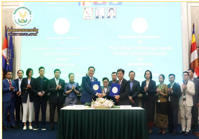
រូបភាព៖ អនុស្សរណៈនៃការយោគយល់គ្នា (MoU) រវាង ន.ប.ម. និងគណៈមេធាវីនៃព្រះរាជាណាចក្រកម្ពុជា។

ពិធីចុះអនុស្សរណៈនៃការយោគយល់គ្នានេះ មានការអញ្ជើញចូលរួមពីតំណាងជាន់ខ្ពស់នៃនិយ័តករ និងអង្គភាពក្រោមឱវាទអាជ្ញាធរសេវាហិរញ្ញវត្ថុមិនមែនធនាគារ (អ.ស.ម.) ថ្នាក់ដឹកនាំ និងមន្ត្រីជំនាញនៃ ន.ប.ម. ថ្នាក់ដឹកនាំ នៃគណៈមេធាវីនៃព្រះរាជាណាចក្រកម្ពុជា តំណាងក្រុមហ៊ុនបរធនបាល ប្រតិបត្តិករបរធនបាលផ្តល់សេវាក្សានុវត្តិភាព ឬសេវាក្សាទុក ក្រុមហ៊ុនវាយតម្លៃក្នុងវិស័យបរធនបាលកិច្ច និងបរធនបាលរូបវន្តបុគ្គលឯករាជ្យ។