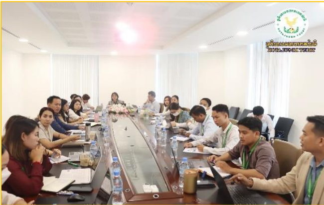
រូបភាព៖ វគ្គបណ្តុះបណ្តាលផ្ទៃក្នុងនិយ័តករបរធនបាលកិច្ចស្តីពី "កាតព្វកិច្ចរាយការណ៍ និងបញ្ជូនករណីសង្ស័យការប្រព្រឹត្តល្មើសពាក់ព័ន្ធនឹងវិស័យបរធនបាលកិច្ច"។

រសៀលថ្ងៃអង្គារ ៩រោច ខែអស្សុជ ឆ្នាំថោះ បញ្ចស័ក ព.ស. ២៥៦៧ ត្រូវនឹងថ្ងៃទី៧ ខែវិច្ឆិកា ឆ្នាំ២០២៣ ឯកឧត្តម សុខ ដារ៉ា អគ្គនាយកនៃនិយ័តករបរធនបាលកិច្ច ( ន.ប.ប. ) អមដោយ កញ្ញា ឈាន សុខាវី ប្រធាននាយកដ្ឋានកិច្ចការគតិយុត្ត និងអធិការកិច្ច និងលោក ហាយ សុវណ្ណា ប្រធានស្តីទីនាយកដ្ឋានចុះបញ្ជីបរធនបាលកិច្ច បានដឹកនាំសហការីចូលរួមកិច្ចប្រជុំបច្ចេកទេសនៃអង្គនាពក្រោមឱវាទអាជ្ញាធរសេវាហិរញ្ញវត្ថុមិនមែនធនាគារ ( អ.ស.ហ. ) តាមប្រព័ន្ធអនឡាញ (Zoom) ក្រោមការដឹកនាំដ៏ខ្ពង់ខ្ពស់របស់ ឯកឧត្តម សេ សិស្សា រដ្ឋលេខាធិការក្រសួងសេដ្ឋកិច្ចនិងហិរញ្ញវត្ថុ និងជាអនុប្រធានក្រុមប្រឹក្សា អ.ស.ហ. ដើម្បីពិនិត្យ និងផ្តល់យោបល់លើសេចក្តីព្រាងប្រកាសស្តីពី "ក្រមសីលធម៌វិជ្ជាជីវៈរបស់ក្រុមហ៊ុនថែរក្សាទ្រព្យសម្បត្តិជំនួស" របស់និយ័តករបរធនបាលកិច្ច។