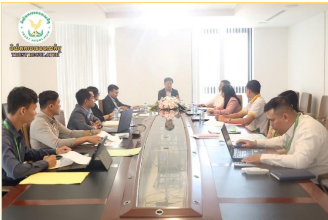
រូបភាព៖ កិច្ចប្រជុំពិភាក្សាជាមួយមជ្ឈមណ្ឌលបច្ចេកវិទ្យាហិរញ្ញវត្ថុ (FinTech Center)។

កិច្ចប្រជុំនេះ បានរៀបចំឡើងក្នុងគោលបំណងដើម្បីពិនិត្យ ក៏ដូចជាទទួលបានធាតុចូលក្នុងកម្រិតបច្ចេកទេសបន្ថែមពី FinTech Center នៃអគ្គលេខាធិការដ្ឋាន អ.ស.ហ. ដើម្បីឱ្យការរៀបចំ សេចក្តីព្រាងគោលការណ៍ណែនាំនេះកាន់តែមានលក្ខណៈពេញលេញ និងគ្រប់ជ្រុងជ្រោយ ដែលសំដៅដល់ការអនុវត្តប្រកបដោយ សណ្តាប់ធ្នាប់ តម្លាភាព ប្រសិទ្ធភាព និងទំនុកចិត្តពីគ្រប់គូអង្គ និង អ្នកចូលរួមក្នុងវិស័យបរធនបាលកិច្ច។