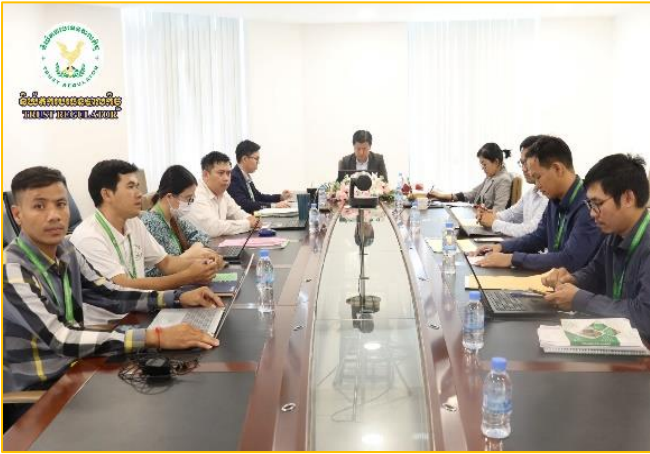
រូបភាព៖ កិច្ចប្រជុំបច្ចេកទេសនៃអង្គការក្រោមឱវាទអាជ្ញាធរសេវាហិរញ្ញវត្ថុ មិនមែនធនាគារ (អ.ប.ធន.)។