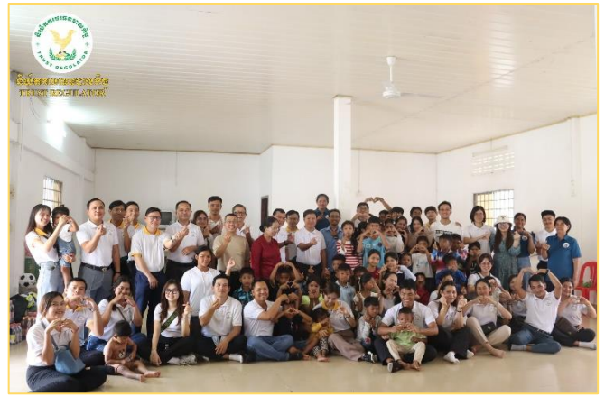
រូបភាព៖ កម្មវិធីការងារសង្គមនៅ មជ្ឈមណ្ឌលកុមារកំព្រាខេត្តសៀមរាប។