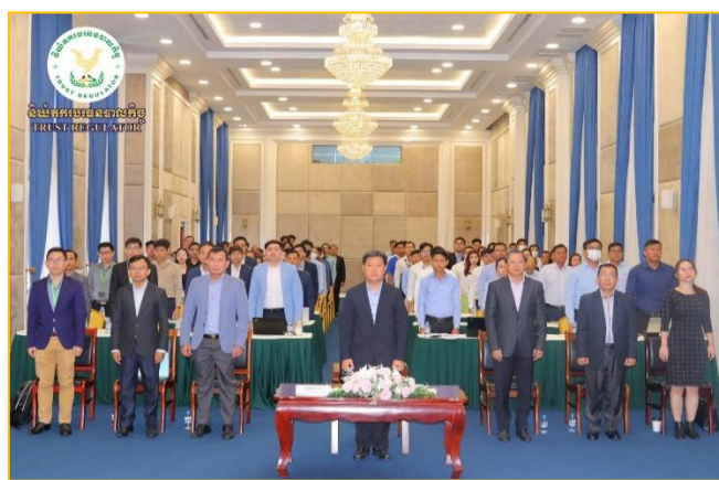
រូបភាព៖ កិច្ចប្រជុំពិគ្រោះយោបល់លើសេចក្តីព្រាងគោលការណ៍ណែនាំស្តីពី "បរិស្ថានសាកល្បងបច្ចេកវិទ្យាហិរញ្ញវត្ថុក្នុងវិស័យបរទេសបាលកិច្ច"។