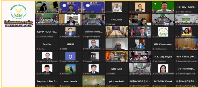
រូបភាព៖ កិច្ចប្រជុំគណៈកម្មការតែម្រងការគ្រប់គ្រងហិរញ្ញវត្ថុសាធារណៈ ដើម្បីពិនិត្យ និងពិភាក្សាលើរបាយការណ៍វឌ្ឍនភាពប្រចាំត្រីមាសទី៣ ឆ្នាំ២០២៣។