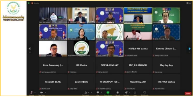
រូបភាព៖ កិច្ចប្រជុំកម្រិតបច្ចេកទេសនៃអាជ្ញាធរសេវាហិរញ្ញវត្ថុមិនមែនធនាគារ (អ.ស.ហ.)។