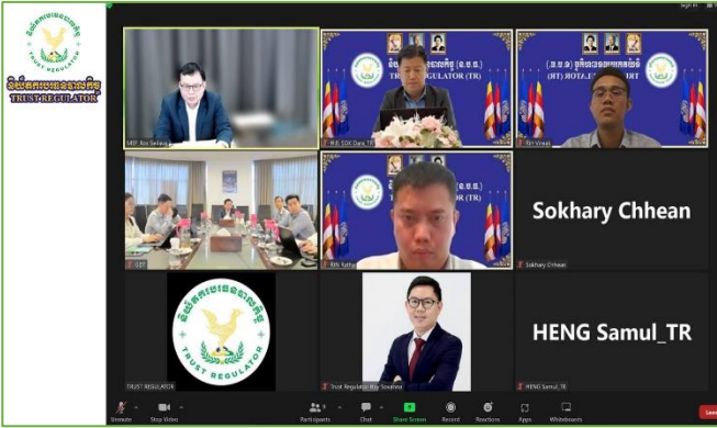
រូបភាព៖ កិច្ចប្រជុំក្រុមការងារសម្របសម្រួលការអនុវត្តបទប្បញ្ញត្តិ ពាក់ព័ន្ធនឹងការកំណត់ពន្ធដារក្នុងវិស័យបរទេសបាលកិច្ច។

នាសៀលថ្ងៃចន្ទ ៤រោច ខែបុស្ស ឆ្នាំថោះ បញ្ចស័ក ព.ស. ២៥៦៧ ត្រូវនឹងថ្ងៃទី២៩ ខែមករា ឆ្នាំ២០២៤ ឯកឧត្តម សុខ ជាំរ៉ា អគ្គនាយកនៃនិយ័តករបរទេសបាលកិច្ច (ន.ប.ប.) និងជាអនុប្រធាន ក្រុមការងារសម្របសម្រួលការអនុវត្តបទប្បញ្ញត្តិពាក់ព័ន្ធនឹងការ កំណត់ពន្ធដារក្នុងវិស័យបរទេសបាលកិច្ច អមដោយ ឯកឧត្តម នង តិសិដ្ឋ អគ្គនាយករងនៃនិយ័តករបរទេសបាលកិច្ច (ន.ប.ប.) បានដឹកនាំសហការី ចូលរួមកិច្ចប្រជុំក្រុមការងារសម្របសម្រួល ការអនុវត្តបទប្បញ្ញត្តិពាក់ព័ន្ធនឹងការកំណត់ពន្ធដារក្នុងវិស័យ បរទេសបាលកិច្ច តាមប្រព័ន្ធអនឡាញ (Zoom) ក្រោមការដឹកនាំ ដ៏ខ្ពង់ខ្ពស់របស់ ឯកឧត្តម រស់ សីលនាំ រដ្ឋលេខាធិការក្រសួង សេដ្ឋកិច្ចនិងហិរញ្ញវត្ថុ និងជាប្រធានក្រុមការងារសម្របសម្រួល ការអនុវត្តបទប្បញ្ញត្តិពាក់ព័ន្ធនឹងការកំណត់ពន្ធដារក្នុងវិស័យ បរទេសបាលកិច្ច ដើម្បីពិនិត្យ និងពិភាក្សាលើកិច្ចការងារពាក់ព័ន្ធ នឹងការកំណត់វិធាន និងបែបទពន្ធដារក្នុងវិស័យបរទេសបាលកិច្ច។