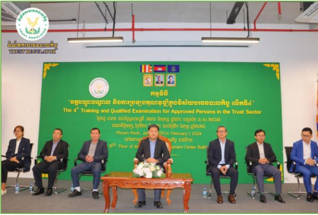
រូបភាព៖ វគ្គបណ្តុះបណ្តាលនិងការប្រឡងគុណវុឌ្ឍិក្នុងវិស័យបរទេស-បាលកិច្ច លើកទី៤។