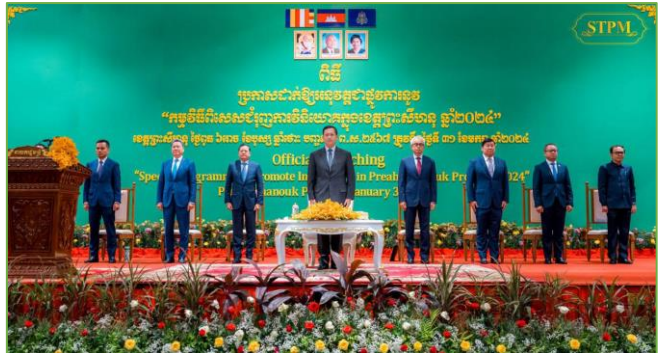
រូបភាព៖ កម្មវិធីពិសេសជំរុញការវិនិយោគក្នុងខេត្តព្រះសីហនុ ឆ្នាំ២០២៤។