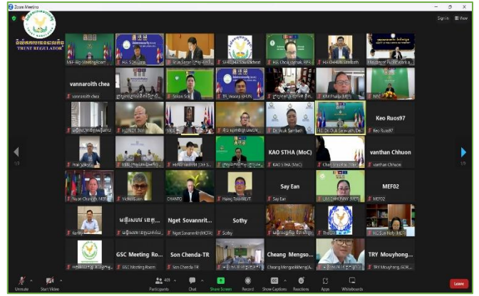
រូបភាព៖ កិច្ចប្រជុំគណៈកម្មការកែទម្រង់ការគ្រប់គ្រងហិរញ្ញវត្ថុសាធារណៈ។