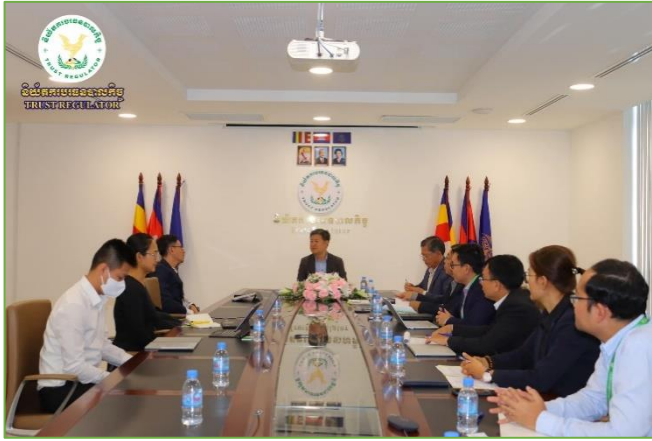
រូបភាព៖ កិច្ចប្រជុំពិភាក្សាការងារជាមួយក្រុមការងារនៃក្រុមហ៊ុន PwC។