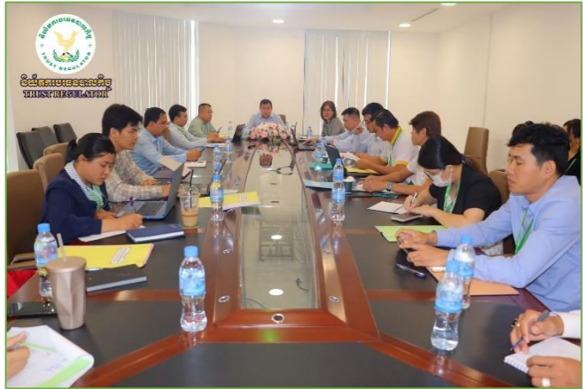
រូបភាព៖ កិច្ចប្រជុំកម្រិតអន្តរនាយកដ្ឋានដើម្បីពិនិត្យលើខ្លឹមសារសេចក្តីព្រាង របាយការណ៍សមិទ្ធផលការងារប្រចាំឆ្នាំ២០២១-២២ របស់និយ័តករ បរធនបាលកិច្ច។

នាព្រឹកថ្ងៃអង្គារ ១៣កើត ខែបុស្ស ឆ្នាំថោះ បញ្ចស័ក ព.ស. ២៥៦៧ ត្រូវនឹងថ្ងៃទី២៣ ខែមករា ឆ្នាំ២០២៤ ឯកឧត្តម នង ពិសិដ្ឋ អគ្គនាយករងនៃនិយ័តករបរធនបាលកិច្ច ( ន.ប.ប. ) បានដឹកនាំ កិច្ចប្រជុំកម្រិតអន្តរនាយកដ្ឋានដើម្បីពិនិត្យលើខ្លឹមសារសេចក្តីព្រាង របាយការណ៍សមិទ្ធផលការងារប្រចាំឆ្នាំ២០២១-២២ របស់និយ័តករ បរធនបាលកិច្ច។ កិច្ចប្រជុំនេះ មានការចូលរួមពីលោក-កញ្ញា ប្រធាននាយកដ្ឋាន អនុប្រធាននាយកដ្ឋាន ប្រធានការិយាល័យ និងមន្ត្រីជំនាញនៃ ន.ប.ប. ។