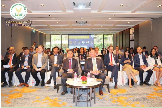
រូបភាព៖ សិក្ខាសាលាស្តីពី “កាលានុវត្តភាពអាជីវកម្មដែលកំពុងរីកចម្រើន៖ ការអភិវឌ្ឍន៍នៃវិស័យបរធនបាលកិច្ចនៅកម្ពុជា”។

សិក្ខាសាលានេះមានគោលបំណងដើម្បីប្រមូលផ្តុំ អ្នកជំនាញ និងអង្គការពាក់ព័ន្ធក្នុងទីផ្សារបរធនបាលកិច្ច ដើម្បីលើក កម្ពស់ការយល់ដឹងពីសារៈសំខាន់ និងអត្ថប្រយោជន៍របស់បរធន- បាលកិច្ច ដែលជាយន្តការសម្រាប់ការគ្រប់គ្រង ចាត់ចែង និងថែរក្សា ទ្រព្យសម្បត្តិ ប្រកបដោយទំនុកចិត្ត។