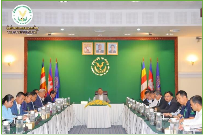
រូបភាព៖ កិច្ចប្រជុំផ្សព្វផ្សាយសារាចរណែនាំស្តីពី ការអនុវត្តច្បាប់ស្តីពី ហិរញ្ញវត្ថុសម្រាប់គ្រប់គ្រងឆ្នាំ២០២៤។