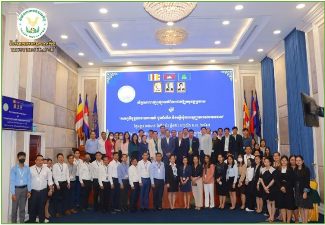
រូបភាព៖ សិក្ខាសាលាផ្សព្វផ្សាយស្តីពី “កាតព្វកិច្ចផ្តល់របាយការណ៍ ជូនដំណឹង និងស្នើសុំការអនុញ្ញាតរបស់បរទេសបាល”។