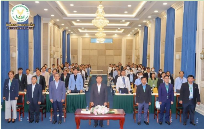
រូបភាព៖ សិក្ខាសាលាផ្សព្វផ្សាយស្តីពី “ការទទួលស្គាល់ក្រុមហ៊ុនផ្តល់សេវាសវនកម្មក្នុងវិស័យបរទេសបាលកិច្ច”។