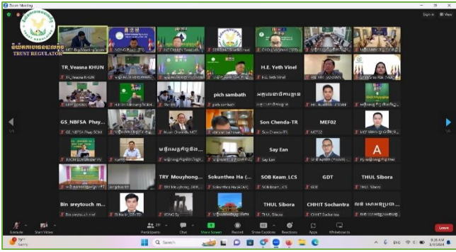
រូបភាព៖ កិច្ចប្រជុំគណៈកម្មការកែទម្រង់ការគ្រប់គ្រងហិរញ្ញវត្ថុសាធារណៈ ដើម្បីពិនិត្យ និងពិភាក្សាលើរបាយការណ៍វឌ្ឍនភាពប្រចាំត្រីមាសទី៤ ឆ្នាំ២០២៣។