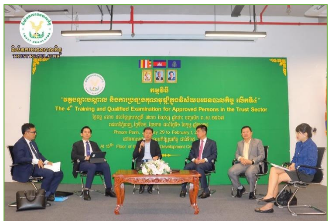
រូបភាព៖ កិច្ចពិភាក្សា៖ បទពិសោធអនុវត្ត បញ្ហាប្រឈម និងកាលានុវត្តភាព នៃវិស័យបរិយាកាសកិច្ចនៅកម្ពុជា។

នៅក្នុងកិច្ចពិភាក្សានេះ ភ្នាក់ងារកិច្ចការកិច្ច បានធ្វើការចែក រំលែកអំពីបទពិសោធន៍ក្នុងការគ្រប់គ្រង និងចាត់ចែងបរិយាកាសកិច្ច អត្ថប្រយោជន៍នៃការបង្កើតវិស័យបរិយាកាសកិច្ច និងបញ្ហាប្រឈម ដែលធ្លាប់បានជួបប្រទះក្នុងការអនុវត្តការងារកន្លងមក ព្រមទាំង បានចែករំលែកអំពីទស្សនវិស័យអំពីវិស័យបរិយាកាសកិច្ចផងដែរ។