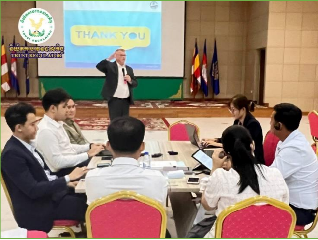
រូបភាព៖ សិក្ខាសាលាស្តីពី "ការវាយតម្លៃហានិភ័យថ្នាក់ជាតិស្តីពីការសម្អាតប្រាក់ និងហិរញ្ញប្បទានកេរ្តិ៍រាជ្យ លើកទី២ (NRA II) សម្រាប់ម៉ឺឌុល៧ និងម៉ឺឌុល១៣"។