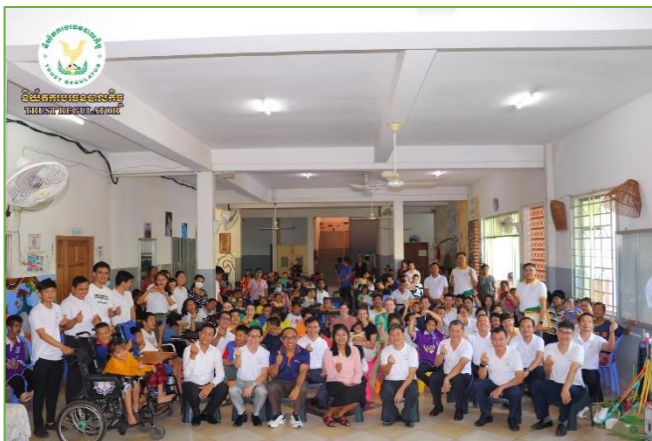
រូបភាព៖ កិច្ចការងារនៅសង្គមមជ្ឈមណ្ឌលទារក និងកុមារជាតិ។

កម្មវិធីនេះក៏មានការចូលរួមពីតំណាងក្រុមបរិច្ឆេទបាល ពាក់ព័ន្ធផងដែរ។