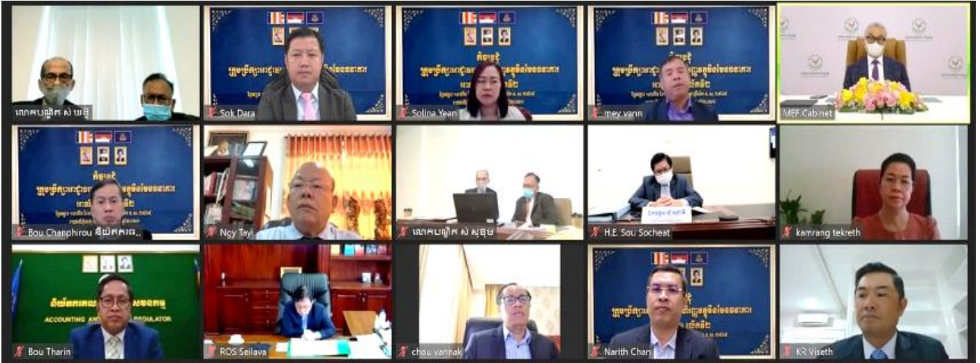
រូបភាពក្នុងកិច្ចប្រជុំក្រុមប្រឹក្សា អ.ស.ប. អាណត្តិទី១ លើកទី២ តាមប្រព័ន្ធ Zoom ក្រោមអធិបតីភាពដ៏ខ្ពង់ខ្ពស់របស់ ឯកឧត្តមអគ្គបណ្ឌិតសភាចារ្យ អូន ព័ន្ធមុនីរ័ត្ន ។