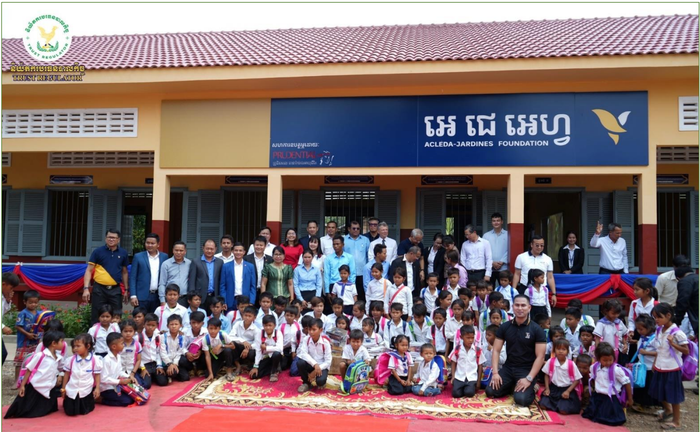
រូបភាពពិធី “សម្ពោធអគារសិក្សាថ្មី នៅសាលាបឋមសិក្សា ជោគជ័យ”។

នាព្រឹកថ្ងៃសុក្រ ១០កើត ខែចេត្រ ឆ្នាំខាល ចត្វាស័ក ព.ស.២៥៦៦ ត្រូវនឹងថ្ងៃទី៣១ ខែមីនា ឆ្នាំ២០២៣ ឯកឧត្តម ណឺ សាកល អគ្គនាយករងនៃនិយ័តករបរធនបាលកិច្ច ( ន.ប.ឆ. ) តំណាងដ៏ខ្ពង់ខ្ពស់របស់ ឯកឧត្តម សុខ ដារ៉ា អគ្គនាយកនៃ ( ន.ប.ឆ. ) បានអញ្ជើញ ចូលរួមជាគណៈអធិបតីក្នុងពិធី “សម្ពោធអគារសិក្សាថ្មី នៅសាលាបឋមសិក្សា ជោគជ័យ” ដែលរៀបចំឡើងដោយអង្គការមូលនិធិអេស៊ីលីដា- ចារឌីនសម្រាប់ការអប់រំ (AJF) នៅភូមិជោគជ័យ ឃុំសង្កែពីរ ស្រុកឆែប ខេត្តព្រះវិហារ។