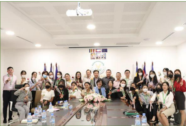
រូបភាពកម្មវិធីសំណេះសំណាលលើកទឹកចិត្ត និងលើកកម្ពស់មន្ត្រីជានានី ក្នុងឱកាសអបអរសាទរទិវានានីអន្តរជាតិ ៨ មីនា។

នារសៀលថ្ងៃអង្គារ ១រោច ខែផល្គុន ឆ្នាំខាល ចត្វាស័ក ព.ស.២៥៦៦ ត្រូវនឹងថ្ងៃទី៧ ខែមីនា ឆ្នាំ២០២៣ និយ័តករបរិយាកាសកិច្ច (ន.ប.ប.) បានរៀបចំកម្មវិធីសំណេះសំណាលលើកទឹកចិត្ត និងលើកកម្ពស់មន្ត្រីជានានី ក្នុងឱកាសអបអរសាទរទិវានានីអន្តរជាតិ ៨ មីនា គ.ស.២០២៣ ខួបលើកទី១១២ ក្រោមប្រធានបទ “ស្រ្តីរួមគ្នាក្រសួងសុខសន្តិភាព ដើម្បីកិច្ចអភិវឌ្ឍក្នុងយុគសម័យឌីជីថល” ក្រោមអធិបតីភាពដ៏ខ្ពង់ខ្ពស់របស់ ឯកឧត្តម សុខ ដារ៉ា អគ្គនាយកនៃនិយ័តករបរិយាកាសកិច្ច (ន.ប.ប.) អមដោយថ្នាក់ដឹកនាំ និងមន្ត្រីជានានីរបស់ ន.ប.ប. ទាំងអស់ផងដែរ។