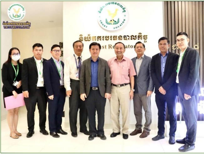
រូបភាពកិច្ចពិភាក្សាការងារជាមួយក្រុមប្រតិភូរបស់ក្រុមហ៊ុន Phillip Capital Group។