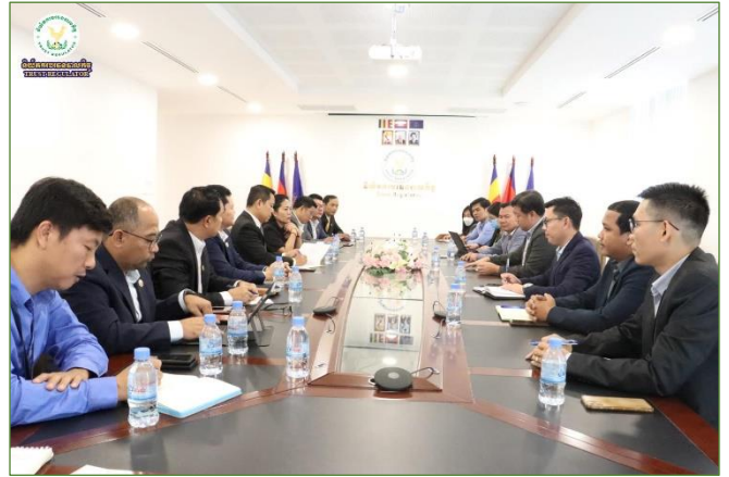
រូបភាពកិច្ចជំនួបដើម្បីចែករំលែកពីវឌ្ឍនភាពនៃកិច្ចដំណើរការអភិវឌ្ឍន៍នៃវិស័យបរិស្ថានបាលកិច្ច។