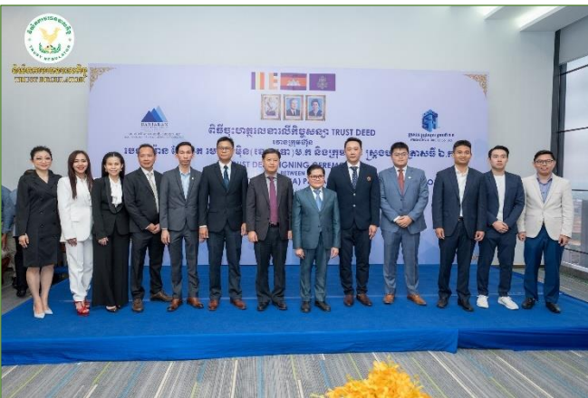
រូបភាពពិធីចុះហត្ថលេខាលើកិច្ចសន្យា Trust Deed រវាងក្រុមហ៊ុន បេនចារ៉ាន អ៊ែសេត មេនេចម៊ិន (ខេមបូឌា) ម.ក និងក្រុមហ៊ុន ស្រ្តងហ្វល ត្រាសធី ឯ.ក។

នាព្រឹកថ្ងៃអង្គារ ៧កើត ខែចេត្រ ឆ្នាំខាល ចត្វាស័ក ព.ស.២៥៦៦ ត្រូវនឹងថ្ងៃទី២៨ ខែមីនា ឆ្នាំ២០២៣ ឯកឧត្តម សុខ ដារ៉ា អគ្គនាយកនៃនិយ័តករបរិច្ឆេទបាលកិច្ច (ន.ប.ក.) ជាសមាជិកក្រុមការងាររៀបចំសេចក្តីព្រាងគោលនយោបាយអភិវឌ្ឍវិស័យបច្ចេកវិទ្យាហិរញ្ញវត្ថុកម្ពុជា និងជាអនុប្រធានក្រុមការងារបច្ចេកទេសទទួលបន្ទុកបច្ចេកវិទ្យាហិរញ្ញវត្ថុក្នុងវិស័យហិរញ្ញវត្ថុមិនមែនធនាគារ បានដឹកនាំសហការី ចូលរួមកិច្ចប្រជុំពិនិត្យ និងពិភាក្សាអំពីការរៀបចំសេចក្តីព្រាងគោលនយោបាយអភិវឌ្ឍវិស័យបច្ចេកវិទ្យាហិរញ្ញវត្ថុកម្ពុជា តាមប្រព័ន្ធអនឡាញ Zoom។