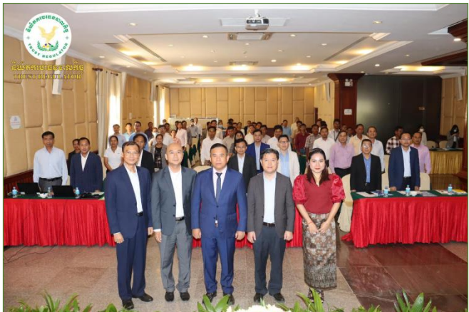
រូបភាពសិក្ខាសាលាផ្សព្វផ្សាយ និងបណ្តុះបណ្តាលពង្រឹងសមត្ថភាពស្តីពី “ដំណើរការ និងនីតិវិធីក្នុងការទទួលបានឥណទានក្រោមគម្រោង ACSEP សមាសភាគទី១” ក្រោមអធិបតីភាពដ៏ខ្ពង់ខ្ពស់របស់ ឯកឧត្តម ម៉ី ភ័ន់ រដ្ឋលេខាធិការនៃក្រសួងសេដ្ឋកិច្ចនិងហិរញ្ញវត្ថុ ( កសហ ) និងជានាយកគម្រោង។