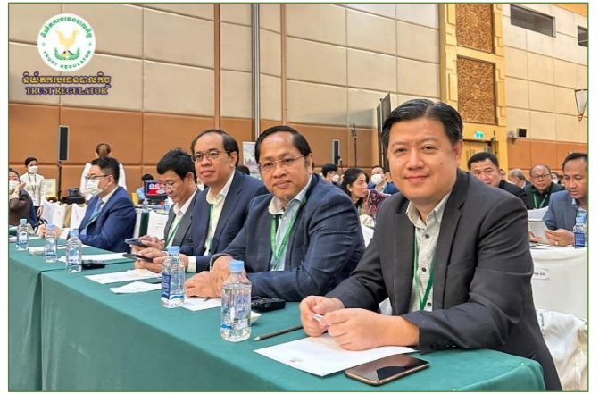
រូបភាពពិធីប្រកាសដាក់ឱ្យអនុវត្តកម្មវិធីរកទម្រង់ការគ្រប់គ្រងហិរញ្ញវត្ថុសាធារណៈ ដំណាក់កាលទី៤ ឆ្នាំ២០២៣-២០២៧ “គណនេយ្យភាពសមិទ្ធកម្ម” ក្រោមអធិបតីភាព ដ៏ខ្ពង់ខ្ពស់របស់ សម្តេចអគ្គមហាសេនាបតីតេជោ ហ៊ុន សែន នាយករដ្ឋមន្ត្រីនៃព្រះរាជាណាចក្រកម្ពុជា។