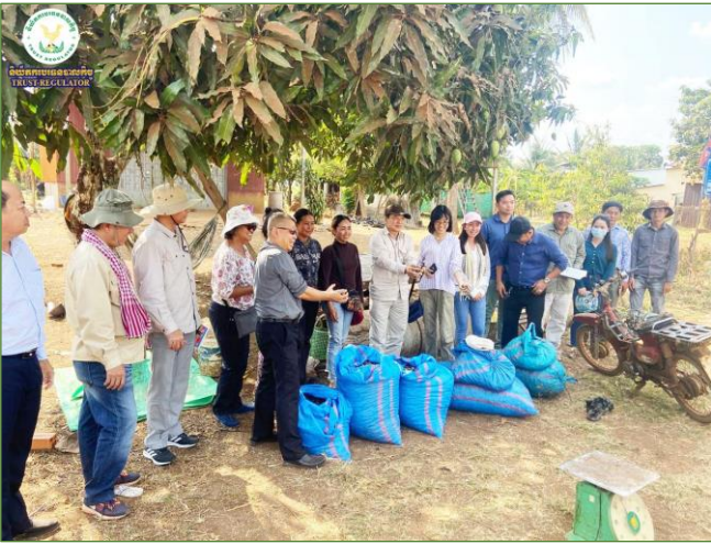
រូបភាពបេសកកម្មត្រួតពិនិត្យជាក់ស្តែងដល់ការដ្ឋានស្ថាបនាផ្លូវមួយខ្សែក្រោម MRD-PIU3 ប្រវែង ១៧.៥ គីឡូម៉ែត្រ។