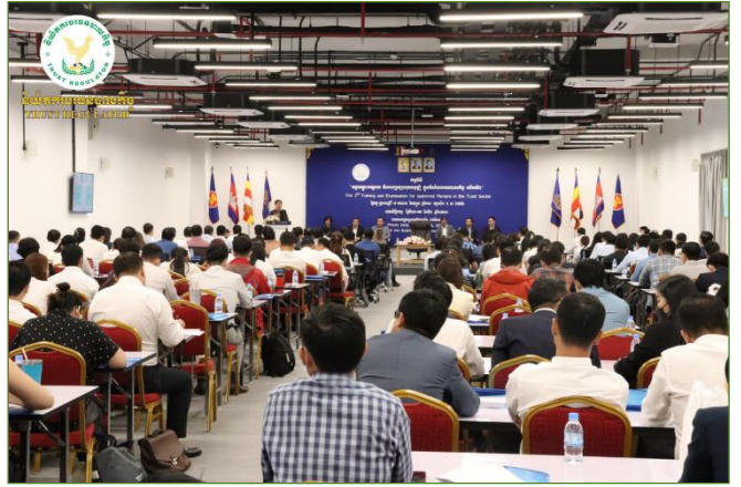
រូបភាពកម្មវិធី "វគ្គបណ្តុះបណ្តាល និងការប្រឡងគុណវុឌ្ឍិក្នុងវិស័យបរទេសបាលកិច្ចលើកទី២" ដែលប្រព្រឹត្តិទៅកាលពីថ្ងៃទី១៣-១៥ ខែមីនា ឆ្នាំ២០២៣។