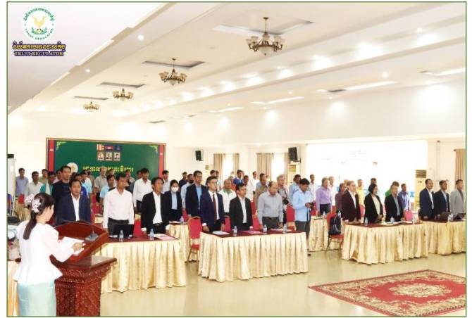
រូបភាពសិក្ខាសាលាផ្សព្វផ្សាយ និងបណ្តុះបណ្តាលពង្រឹងសមត្ថភាពស្តីពី “ដំណើរការ និងនីតិវិធីក្នុងការទទួលបានឥណទានក្រោមគម្រោង ACSEP សមាសភាគទី១” ក្រោមអធិបតីភាពដ៏ខ្ពង់ខ្ពស់របស់ ឯកឧត្តម ម៉ី វ៉ាន់ រដ្ឋលេខាធិការនៃក្រសួងសេដ្ឋកិច្ចនិងហិរញ្ញវត្ថុ ( កសហ ) និងជាសាយកគម្រោង។