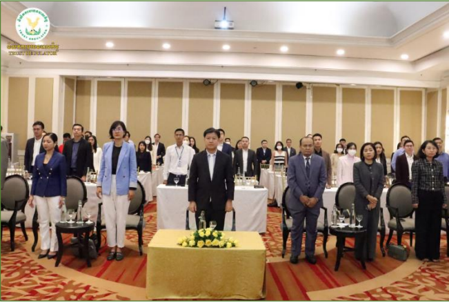
រូបភាពសិក្ខាសាលាស្តីពី “បរិយាកាសកិច្ចការ រចនាសម្ព័ន្ធនៃការគ្រប់គ្រង ចាត់ចែងទ្រព្យសម្បត្តិសាធារណៈ និងគ្រួសារ”