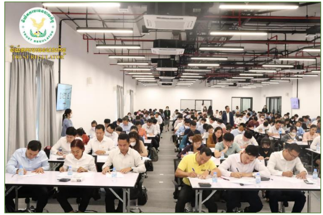
រូបភាពកម្មវិធីកាត់កញ្ចប់វិញ្ញាសារប្រឡង និងប្រកាសបើកកម្មវិធីប្រឡង គុណវុឌ្ឍិក្នុងវិស័យបរទេសបាលកិច្ច លើកទី២ ឆ្នាំ២០២៣ ។