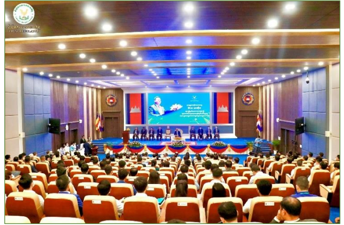
រូបភាពពិធី “ប្រកាសពង្រីកការប្រើប្រាស់មុខងាររបស់ប្រព័ន្ធ FMIS, ការអនុវត្តនីតិវិធីតាមប្រព័ន្ធ FMIS ទាំងស្រុង, ការប្រើប្រាស់ប្រព័ន្ធដកសារឌីជីថល (FMIS Portal) ជំនាន់ទី ១ នៅរដ្ឋបាលថ្នាក់ក្រោមជាតិ និង ការដាក់ឱ្យអនុវត្តគម្រោងរៀបចំមុខងារគ្រប់គ្រងទ្រព្យសម្បត្តិរដ្ឋនៅក្រសួងចំនួន ៥ ដំបូង” ឯកឧត្តមអគ្គបណ្ឌិតសភាចារ្យ អូន ព័ន្ធមុនីរ័ត្ន ឧបនាយករដ្ឋមន្ត្រី រដ្ឋមន្ត្រីក្រសួងសេដ្ឋកិច្ចនិងហិរញ្ញវត្ថុ។

ពិធី “ប្រកាសពង្រីកការប្រើប្រាស់មុខងាររបស់ប្រព័ន្ធ FMIS, ការអនុវត្តនីតិវិធីតាមប្រព័ន្ធ FMIS ទាំងស្រុង, ការប្រើប្រាស់ប្រព័ន្ធដកសារឌីជីថល (FMIS Portal) ជំនាន់ទី ១ នៅរដ្ឋបាលថ្នាក់ក្រោមជាតិ និង ការដាក់ឱ្យអនុវត្តគម្រោងរៀបចំមុខងារគ្រប់គ្រងទ្រព្យសម្បត្តិរដ្ឋនៅក្រសួងចំនួន ៥ ដំបូង”