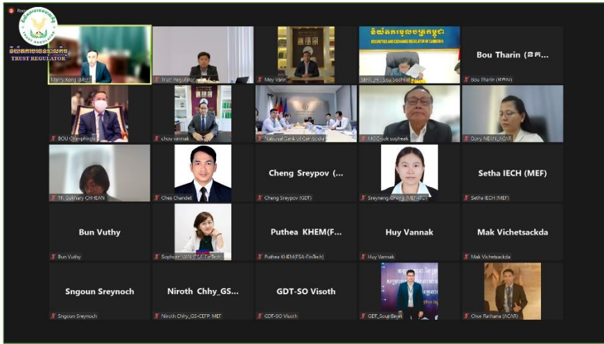
រូបភាពកិច្ចប្រជុំពិនិត្យ និងពិភាក្សាអំពីការរៀបចំសេចក្តីព្រាងគោលនយោបាយអភិវឌ្ឍន៍វិស័យបច្ចេកវិទ្យា ហិរញ្ញវត្ថុកម្ពុជា។