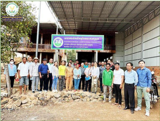
រូបភាពបេសកកម្មត្រួតពិនិត្យជាក់ស្តែងដល់ការដ្ឋានស្ថាបនាផ្លូវមួយខ្សែក្រោម MRD-PIU3 ប្រវែង ១២.៥ គីឡូម៉ែត្រ។

ដល់ការដ្ឋានស្ថាបនាផ្លូវមួយខ្សែក្រោម MRD-PIU3 ប្រវែង ១២.៥ គីឡូម៉ែត្រ ស្ថិតនៅភូមិក្រសាំង ឃុំចុងផ្លាស់ ស្រុកតំបែរ ខេត្តត្បូងឃ្មុំ និងសហគមន៍កសិកម្មបៃតងគោកស្រុក (Beitong Korsrik Agri-Cooperative) នៅភូមិគោកស្រុក ឃុំគោកស្រុក ស្រុកគោកស្រុក ខេត្តត្បូងឃ្មុំ ដើម្បីវាយតម្លៃផលប៉ះពាល់បរិស្ថាន (ESMS) និងសុវត្ថិភាពសង្គម (safeguard) ។