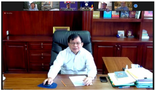
រូបភាពក្នុងកិច្ចប្រជុំតាមប្រព័ន្ធអនឡាញជាមួយតំណាងមូលនិធិរូបិយវត្ថុអន្តរជាតិ (IMF) ក្រោមការដឹកនាំដ៏ខ្ពង់ខ្ពស់របស់ឯកឧត្តម សេ សីលីនា ។

នាព្រឹកថ្ងៃព្រហស្បតិ៍ ៧ រោច ខែបឋមសាធ ឆ្នាំឆ្លូវ ត្រីស័ក ព.ស. ២៥៦៥ ត្រូវនឹងថ្ងៃទី០១ ខែកក្កដា ឆ្នាំ២០២១ ឯកឧត្តម សុខ ដារ៉ា អគ្គនាយកនៃនិយ័តករបរធនបាលកិច្ច បានចូលរួមប្រជុំតាមប្រព័ន្ធអនឡាញជាមួយតំណាងមូលនិធិរូបិយវត្ថុអន្តរជាតិ (IMF) ក្រោមការដឹកនាំដ៏ខ្ពង់ខ្ពស់របស់ឯកឧត្តម សេ សីលីនា រដ្ឋលេខាធិការក្រសួងសេដ្ឋកិច្ចនិងហិរញ្ញវត្ថុ និងជាអនុប្រធានអាជ្ញាធរសេវាហិរញ្ញវត្ថុមិនមែនធនាគារ (អ.ស.ហ.) ដោយមានការចូលរួមពីឯកឧត្តមអគ្គលេខាធិការ ឯកឧត្តមប្រតិភូ និងឯកឧត្តមអគ្គនាយកនៃនិយ័តករបច្ចុប្បន្ន ឪ អ.ស.ហ. ដើម្បីពិភាក្សាអំពីកិច្ចគាំទ្របច្ចេកទេសក្នុងវិស័យហិរញ្ញវត្ថុមិនមែនធនាគារ។