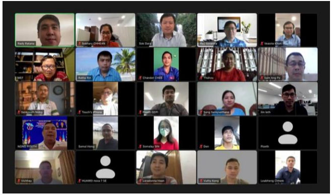
រូបភាពក្នុងកិច្ចប្រជុំតាមប្រព័ន្ធអនឡាញ ដើម្បីពិភាក្សាបញ្ចប់កម្រិតផ្ទៃក្នុងនូវសេចក្តីព្រាងប្រកាសស្តីពីការរៀបចំ និងការប្រព្រឹត្តទៅនៃនាយកដ្ឋាន និងអង្គនាពក្រោមឱវាទនៃ ន.ប.ប. ។

ប្រព័ន្ធអនឡាញ ដើម្បីពិភាក្សាបញ្ចប់កម្រិតផ្ទៃក្នុងនូវសេចក្តីព្រាងប្រកាសស្តីពីការរៀបចំ និងការប្រព្រឹត្តទៅនៃនាយកដ្ឋាន និងអង្គនាពក្រោមឱវាទនៃ ន.ប.ប. ។