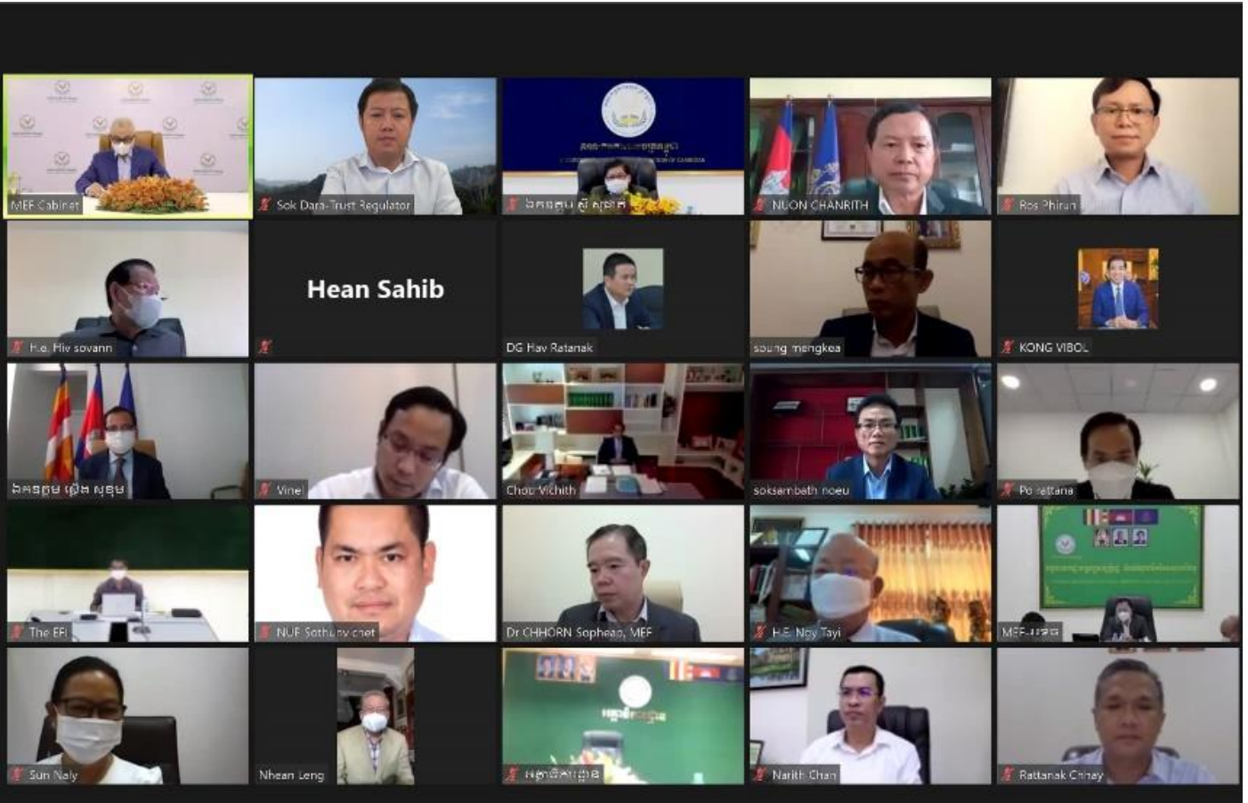
រូបភាពក្នុងកិច្ចប្រជុំកិច្ចភ្នាក់ងារដឹកនាំដើម្បីពិភាក្សាលើសេចក្តីព្រាងរបាយការណ៍លទ្ធផលនៃការអនុវត្តថវិកាធានាទី១ តាមប្រព័ន្ធវីដេអូ ក្រោមអធិបតីភាពដ៏ខ្ពង់ខ្ពស់របស់ ឯកឧត្តមអគ្គបណ្ឌិតសភាធារា អូន ព័ន្ធមុនីរ័ត្ន ។