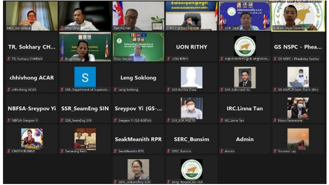
រូបភាពកិច្ចប្រជុំអន្តរនិយ័តករនៃអាជ្ញាធរសេវាហិរញ្ញវត្ថុមិនមែនធនាគារ ( អ.ស.ហ. ) ក្រោមការដឹកនាំដ៏ខ្ពង់ខ្ពស់របស់ ឯកឧត្តម រស់ សីលធា ។

នាព្រឹកថ្ងៃសុក្រ ១១កើត ខែកត្តិក ឆ្នាំខាល ចត្វាស័ក ព.ស. ២៥៦៦ ត្រូវនឹងថ្ងៃទី៤ ខែវិច្ឆិកា ឆ្នាំ២០២២ ឯកឧត្តម នង ពិសិដ្ឋ អគ្គនាយករងនៃនិយ័តករបរទេសបាលកិច្ច ( ន.ប.ប. ) បានដឹកនាំកិច្ចប្រជុំបូកសរុបការងារប្រចាំខែតុលា ព្រមទាំងទិសដៅការងារប្រចាំខែវិច្ឆិកា ឆ្នាំ២០២២ ក្នុងកម្រិតអន្តរនាយកដ្ឋាន រួមមាននាយកដ្ឋានកិច្ចការគតិយុត្តនិងអធិការកិច្ច និងនាយកដ្ឋានស្រាវជ្រាវ បណ្តុះបណ្តាល និងសហប្រតិបត្តិការ។ កិច្ចប្រជុំនេះ មានការចូលរួមពីប្រធាននាយកដ្ឋាន អនុប្រធាននាយកដ្ឋាន, ប្រធានការិយាល័យ, អនុប្រធានការិយាល័យនិងមន្ត្រីជំនាញទាំងអស់នៃនាយកដ្ឋានទាំងពីរ។ នៅក្នុងកិច្ចប្រជុំនេះ ឯកឧត្តមអគ្គនាយករងបានធ្វើការវាយតម្លៃខ្ពស់លើសមិទ្ធផលការងារដែលសម្រេចបានក្នុងខែតុលា ព្រមទាំងបានកោតសរសើរដល់កិច្ចខិតខំប្រឹងប្រែង និងការទទួលខុសត្រូវខ្ពស់របស់ថ្នាក់ដឹកនាំ និងមន្ត្រីទាំងអស់នៃនាយកដ្ឋានទាំងពីរ និងបានផ្តល់ជាអនុសាសន៍ណែនាំសម្រាប់ទិសដៅការងារនៅក្នុងខែបន្ទាប់ផងដែរ។ កិច្ចប្រជុំនេះ បានបញ្ចប់ដោយរលូនប្រកបដោយផ្លែផ្កា និងស្មារតីទទួលខុសត្រូវខ្ពស់។