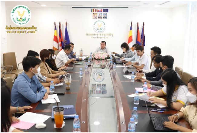
រូបភាពកិច្ចប្រជុំបូកសរុបការងារប្រចាំខែតុលា ព្រមទាំងទិសដៅការងារប្រចាំខែវិច្ឆិកា ឆ្នាំ២០២២ ដឹកនាំដោយ ឯកឧត្តម នង ពិសិដ្ឋ អគ្គនាយករងនៃនិយ័តករធនបាលកិច្ច (ន.ប.ធន.) ។