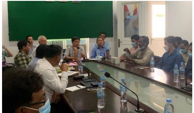
រូបភាពកិច្ចប្រជុំស្តីពីការផ្សព្វផ្សាយអំពីគម្រោង ACSEP នៅមន្ទីរកសិកម្ម រុក្ខាប្រមាញ់ និងនេសាទ ខេត្តត្បូងឃ្មុំ ។

កិច្ចប្រជុំនេះ បានបញ្ចប់ដោយរលូន ប្រកបដោយផ្លែផ្កា និងស្មារតីទទួលខុសត្រូវខ្ពស់។