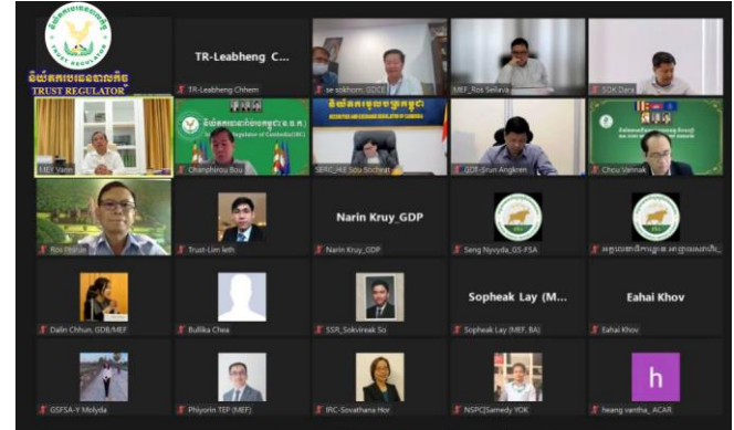
រូបភាពកិច្ចប្រជុំដើម្បីត្រៀមលក្ខណៈសម្រាប់ការចុះត្រួតពិនិត្យដល់ទីកន្លែងរបស់ក្រុមការងារ ICRG-JG ក្នុងការដកប្រទេសកម្ពុជាចេញពីបញ្ជីប្រផេះ ក្រោមអធិបតីភាពដ៏ខ្ពង់ខ្ពស់របស់ ឯកឧត្តម រស់ សីលវ៉ា ។

នារសៀលថ្ងៃពុធ ៧កើត ខែមិគសិរ ឆ្នាំខាល ចត្វាស័ក ព.ស.២៥៦៦ ត្រូវនឹងថ្ងៃទី៣០ ខែវិច្ឆិកា ឆ្នាំ២០២២ ឯកឧត្តម សុខ ដារ៉ា អគ្គនាយកនៃនិយ័តករបរធនបាលកិច្ច ( ន.ប.ធរ. ) អមដោយលោក ផែម លាបហេង ប្រធានការិយាល័យអធិការកិច្ច និងពង្រឹងការអនុវត្តច្បាប់, លោក លឹម ឡែត ប្រធានការិយាល័យគ្រប់គ្រងបរធនបាលកិច្ចសង្គមនិងបុគ្គល និងមន្ត្រីជំនាញនៃ ន.ប.ធរ. បានចូលរួមកិច្ចប្រជុំដើម្បីត្រៀមលក្ខណៈសម្រាប់ការចុះត្រួតពិនិត្យដល់ទីកន្លែងរបស់ក្រុមការងារ ICRG-JG ក្នុងការដកប្រទេសកម្ពុជាចេញពីបញ្ជីប្រផេះ ក្រោមអធិបតីភាពដ៏ខ្ពង់ខ្ពស់របស់ ឯកឧត្តម រស់ សីលវ៉ា រដ្ឋលេខាធិការនៃក្រសួងសេដ្ឋកិច្ចនិងហិរញ្ញវត្ថុ ( កសហវ ) និងជាប្រធានក្រុមការងារប្រឆាំងការសម្អាតប្រាក់ហិរញ្ញប្បទានភេរវកម្ម និងហិរញ្ញប្បទានដល់ការរីកសាយភាយអាវុធមហាប្រល័យនៃ កសហវ និងអាជ្ញាធរសេវាហិរញ្ញវត្ថុមិនមែនធនាគារ ( អ.ស.ហ. ) ដោយមានការចូលរួមពី ឯកឧត្តម លោក ជំទាវ លោក-លោកស្រី ដែលជាតំណាង កសហវ, គណៈកម្មការគ្រប់គ្រងល្បែងពាណិជ្ជកម្មកម្ពុជា, ឯកឧត្តមអគ្គនាយក ថ្នាក់ដឹកនាំ និងមន្ត្រីជំនាញនៃនិយ័តករ និងអង្គការក្រោមឱវាទនៃ អ.ស.ហ. តាមរយៈកិច្ចសម្របសម្រួលរបស់អគ្គលេខាធិការដ្ឋាននៃ អ.ស.ហ. តាមប្រព័ន្ធអនឡាញ Zoom។