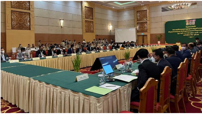
រូបភាពកិច្ចប្រជុំ លើកទី៥ របស់គណៈកម្មាធិការសម្របសម្រួលថ្នាក់ជាតិ ប្រឆាំងការសម្អាតប្រាក់និងហិរញ្ញប្បទានភេរវកម្ម និងហិរញ្ញប្បទានដល់ការរីកសាយភាយអាវុធមហាប្រល័យ ក្រោមអធិបតីភាពដ៏ខ្ពង់ខ្ពស់របស់ សម្តេចក្រឡាហោម ស ខេង ។