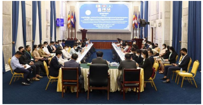
រូបភាពវគ្គបណ្តុះបណ្តាលស្តីពី “ការត្រួតពិនិត្យផ្ទៃក្នុង, ការរាយការណ៍ និងកាតព្វកិច្ចពាក់ព័ន្ធរបស់បុគ្គលរាយការណ៍ ក្នុងក្របខណ្ឌការប្រឆាំង ការសម្អាតប្រាក់ ហិរញ្ញប្បទានភេរវកម្ម និងហិរញ្ញប្បទានដល់ការរីក សាយភាយអាវុធមហាប្រល័យ”។