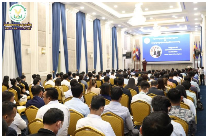
រូបភាពសិក្ខាសាលាផ្សព្វផ្សាយស្តីពីការដាក់ឱ្យអនុវត្តប្រកាសស្តីពី “ការទទួលស្គាល់ក្រុមហ៊ុនវាយតម្លៃក្នុងវិស័យបរទេសបាលកិច្ច” ក្រោមអធិបតីភាពដ៏ខ្ពង់ខ្ពស់របស់ ឯកឧត្តម សុខ ដារ៉ា អគ្គនាយកនៃនិយ័តករបរទេសបាលកិច្ច ។