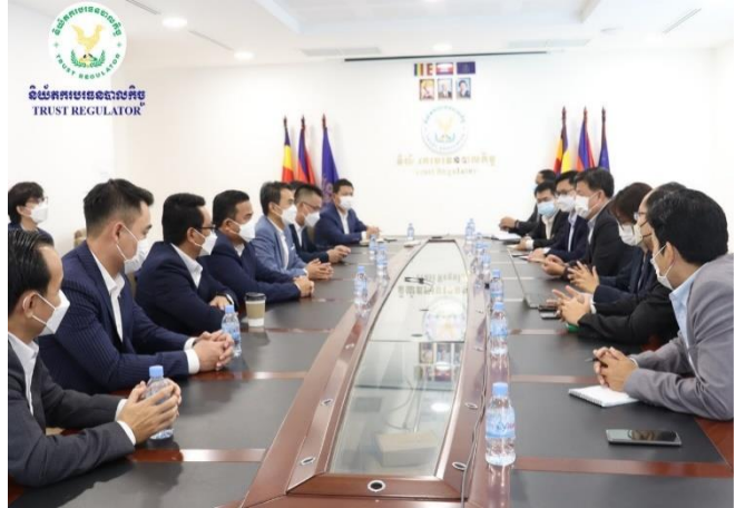
រូបភាពកិច្ចប្រជុំពិភាក្សាការងារ អំពីការអភិវឌ្ឍ និងកាលានុវត្តភាពក្នុងវិស័យបរធនបាលកិច្ច

ដូចជាគំនិតផ្តួចផ្តើមមួយចំនួនក្នុងការជំរុញការអភិវឌ្ឍវិស័យបរធនបាលកិច្ចនៅកម្ពុជា។