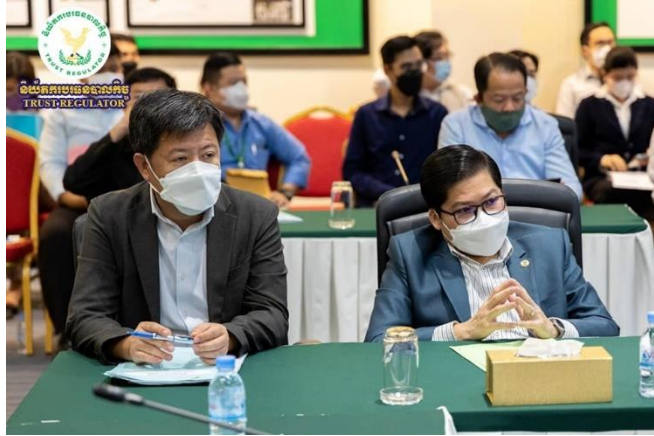
រូបភាពកិច្ចប្រជុំពិភាក្សាកម្រិតថ្នាក់ដឹកនាំ លើគម្រោងចំណូល-ចំណាយ ថវិកាឆ្នាំ២០២៣ របស់ក្រសួងសេដ្ឋកិច្ចនិងហិរញ្ញវត្ថុ (កសហវ)។