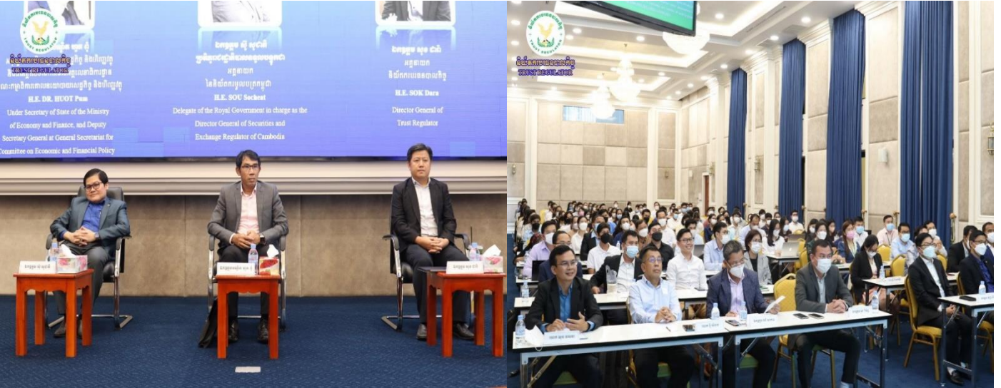
រូបភាពសិក្ខាសាលាបណ្តុះបណ្តាល និងកសាងសមត្ថភាពមន្ត្រី ស្តីពី "ភាពជាអ្នកដឹកនាំ៖ ជំរាប, ភាពរស់រវើក, តុល្យភាព"។