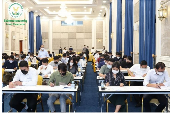
រូបភាពការប្រឡងសម្រាប់បុគ្គលត្រូវទទួលស្គាល់គុណវុឌ្ឍិក្នុងវិស័យ បរិក្ខេបបាលកិច្ច លើកទី១ ឆ្នាំ២០២២ សម្រាប់ក្រុមទី៣

ការប្រឡងសម្រាប់បុគ្គលត្រូវទទួលស្គាល់គុណវុឌ្ឍិក្នុង វិស័យបរិក្ខេបបាលកិច្ច លើកទី១ ឆ្នាំ២០២២ សម្រាប់ក្រុមទី៣ ដែល បានប្រព្រឹត្តទៅនៅព្រឹកថ្ងៃសុក្រ ១៥កើត ខែស្រាពណ៍ ឆ្នាំខាល ចត្វាស័ក ព.ស. ២៥៦៦ ត្រូវនឹងថ្ងៃទី១២ ខែសីហា ឆ្នាំ២០២២ នៅអគារនៃអាជ្ញាធរសេវាហិរញ្ញវត្ថុមិនមែនធនាគារ (អ.ស.ប.)។