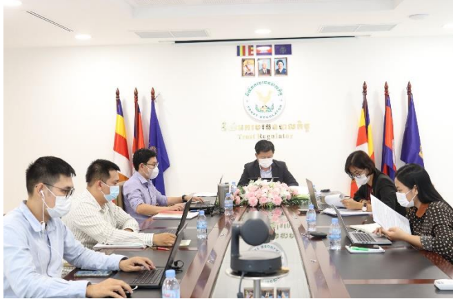
រូបភាពកិច្ចប្រជុំកម្រិតបច្ចេកទេស ដើម្បីពិនិត្យ និងផ្តល់យោបល់លើខ្លឹមសារនៃសេចក្តីព្រាងប្រកាសស្តីពីគោលការណ៍ណែនាំលើការវិនិយោគសម្រាប់ក្រុមហ៊ុនធានារ៉ាប់រងរបស់និយ័តករធានារ៉ាប់រងកម្ពុជា។