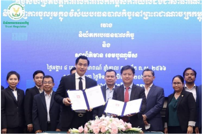
រូបភាពពិធីចុះហត្ថលេខាលើអនុស្សរណៈនៃការយោគយល់គ្នា (MOU) រវាង និយ័តករបរិក្ខេបបាលកិច្ច និងអង្គភាពសារព័ត៌មានខេមបូឌ្យូមីស។

ក្នុងវិស័យបរិក្ខេបបាលកិច្ចនៅព្រះរាជាណាចក្រកម្ពុជា។ គោល- បំណងនៃការចុះអនុស្សរណៈនៃការយោគយល់គ្នានេះ គឺដើម្បី បង្កើតកិច្ចសហការក្នុងភាពជាដៃគូជាមួយអង្គភាពសារព័ត៌មាន ខេមបូឌ្យូមីស ក្នុងការបង្កើនការជំរុញ និងលើកកម្ពស់ការយល់ ដឹងបន្ថែម ក៏ដូចជាដើម្បីបញ្ជ្រាបការយល់ដឹងអំពីកិច្ចដំណើរការ អភិវឌ្ឍន៍វិស័យបរិក្ខេបបាលកិច្ចនៅព្រះរាជាណាចក្រកម្ពុជា យន្តការ បរិក្ខេបបាលកិច្ច លក្ខខណ្ឌតម្រូវក្នុងការធ្វើប្រតិបត្តិការ បទដ្ឋាន គតិយុត្តពាក់ព័ន្ធ និងផលប្រយោជន៍ដែលអាចទាញយកចេញពី ប្រតិបត្តិការបរិក្ខេបបាលកិច្ច ការបង្កើតនិងបង្កើនទំនុកចិត្តតាមរយៈ ការបង្កើតបរិក្ខេបបាលកិច្ចក្នុងធុរកិច្ចពាក់ព័ន្ធ និងក្នុងប្រតិបត្តិការ វិបល្លាសធនទៅគ្រប់វិស័យក្នុងសេដ្ឋកិច្ច និងសង្គមកម្ពុជា។ ពិធី ចុះហត្ថលេខាលើអនុស្សរណៈនៃការយោគយល់គ្នានេះ មានការ អញ្ជើញចូលរួមពីតំណាងនៃនិយ័តករក្រោមឱវាទនៃអាជ្ញាធរសេវា ហិរញ្ញវត្ថុមិនមែនធនាគារ ថ្នាក់ដឹកនាំ និងមន្ត្រីជំនាញនៃនិយ័តករ បរិក្ខេបបាលកិច្ច (ន.ប.ប.) ក្រុមហ៊ុនបរិក្ខេបបាល និងក្រុមហ៊ុនផ្តល់ សេវាក្នុងវិស័យបរិក្ខេបបាលកិច្ចផងដែរ។