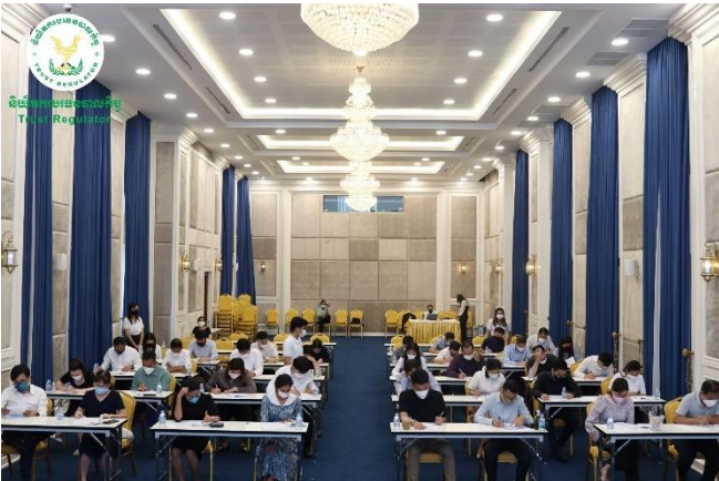
រូបភាពការប្រឡងបេសបុគ្គលត្រូវទទួលស្គាល់គុណវុឌ្ឍិក្នុងវិស័យបរិច្ឆេទបាលកិច្ច លើកទី១ ឆ្នាំ២០២២ សម្រាប់ក្រុមទី២។

ប្រឡងបុគ្គលត្រូវទទួលស្គាល់គុណវុឌ្ឍិក្នុងវិស័យបរិច្ឆេទបាលកិច្ច លើកទី១ ឆ្នាំ២០២២ សម្រាប់ក្រុមទី២ ដែលបាន ប្រព្រឹត្តទៅនៅព្រឹកថ្ងៃសុក្រ ៨កើត ខែអាសាធ ឆ្នាំខាល ចត្វាស័ក ព.ស. ២៥៦៦ ត្រូវនឹងថ្ងៃទី៥ ខែសីហា ឆ្នាំ២០២២ នៅអគារនៃ អាជ្ញាធរសេវាហិរញ្ញវត្ថុមិនមែនធនាគារ (អ.ស.ហ.)។