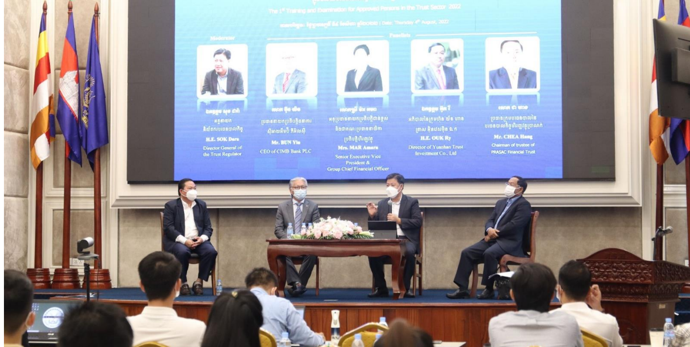
រូបភាពកិច្ចពិភាក្សាស្តីពី ទស្សនាទាននៃកិច្ចដំណើរការអភិវឌ្ឍន៍វិស័យបរិច្ឆេទបាលកិច្ចនៅកម្ពុជា ក្នុងកម្មវិធីវគ្គបណ្តុះបណ្តាល និងការប្រឡងសម្រាប់បុគ្គលត្រូវទទួល ស្គាល់គុណវុឌ្ឍិក្នុងវិស័យបរិច្ឆេទបាលកិច្ច លើកទី១ ឆ្នាំ២០២២ សម្រាប់ក្រុមទី២។