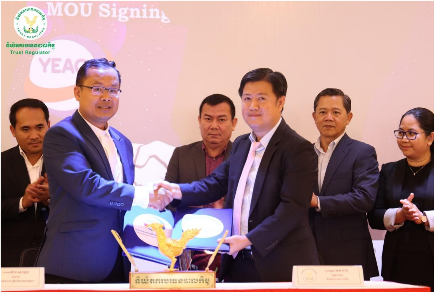
រូបភាពពិធីចុះហត្ថលេខាលើអនុស្សរណៈនៃការយោគយល់គ្នា (MOU) រវាងនិយ័តករបរធនបាលកិច្ច និងសមាគមសហគ្រិនវ័យក្មេងកម្ពុជា (YEAC)