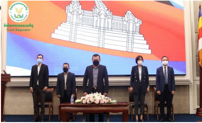
រូបភាពក្នុងការប្រកាសបើកវគ្គបណ្តុះបណ្តាល និងប្រឡងសម្រាប់បុគ្គលត្រូវទទួលស្គាល់គុណវុឌ្ឍិក្នុងវិស័យធនបាលកិច្ចលើកទី ១ ក្រុមទី២ ឆ្នាំ២០២២។