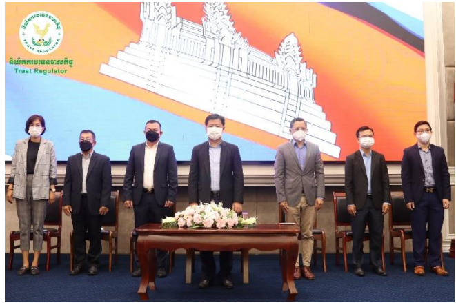
រូបភាពវគ្គបណ្តុះបណ្តាល និងការប្រឡងសម្រាប់បុគ្គលត្រូវទទួលស្គាល់គុណវុឌ្ឍិក្នុងវិស័យបរទេសកិច្ចលើកទី ១ ក្រុមទី៣ ឆ្នាំ២០២២

វគ្គបណ្តុះបណ្តាល និងការប្រឡងសម្រាប់បុគ្គលត្រូវទទួលស្គាល់គុណវុឌ្ឍិក្នុងវិស័យបរទេសកិច្ច លើកទីមួយ ឆ្នាំ ២០២២ ទាំងបីក្រុមនេះ មានអ្នកចូលរួមសរុបចំនួន ២៦៣ នាក់។