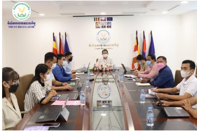
រូបភាពកិច្ចប្រជុំបូកសរុបសមិទ្ធផលការងារប្រចាំខែកក្កដា ឆ្នាំ២០២២ និងទិសដៅការងារប្រចាំខែសីហា ឆ្នាំ២០២២ របស់នាយកដ្ឋានចុះបញ្ជី បរធនបាលកិច្ច។