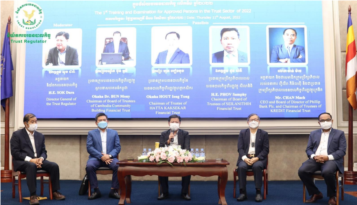
រូបភាពកិច្ចពិភាក្សាស្តីពី "បរិយាកាសកិច្ច: បទពិសោធន៍អនុវត្តន៍ និងកាលានុវត្តភាព" ក្នុងកម្មវិធីវគ្គបណ្តុះបណ្តាល និងការប្រឡងសម្រាប់បុគ្គលត្រូវទទួលស្គាល់គុណវុឌ្ឍិក្នុងវិស័យបរិយាកាសកិច្ច លើកទី១ ឆ្នាំ២០២២ សម្រាប់ក្រុមទី៣។

នៅក្នុងកិច្ចពិភាក្សានេះ វាក្មេងកិត្តិយសបានធ្វើការពិភាក្សាអំពីទស្សនាទាននៃការដាក់ឱ្យអនុវត្តប្រតិបត្តិការបរិយាកាសកិច្ចនៅកម្ពុជាតាមរយៈការចែករំលែកបទពិសោធន៍អនុវត្តន៍ បញ្ហាប្រឈម កាលានុវត្តភាព ការពិភាក្សាអំពីទិដ្ឋភាពផ្នែកច្បាប់ និងការអនុវត្ត មុននិងក្រោយពេលមានច្បាប់ស្តីពីបរិយាកាសកិច្ច ក៏ដូចជាសក្តានុពលនៃវិស័យបរិយាកាសកិច្ចក្នុងការជួយជំរុញប្រតិបត្តិការវិនិយោគវិនិយោគ, ប្រតិបត្តិការវិនិយោគអចលនទ្រព្យ, ការរៀបចំផែនការស្ថិរភាពហិរញ្ញវត្ថុគ្រួសារ និងបុគ្គលជាដើម។ ជារួម វាក្មេងទាំងអស់បានសម្តែងការសាទរដល់កិច្ចដំណើរការអភិវឌ្ឍន៍វិស័យបរិយាកាសកិច្ច រួមទាំងការបង្កើតនិយ័តករបរិយាកាសកិច្ច និងការដាក់ឱ្យអនុវត្តនូវបទដ្ឋានគតិយុត្តិធម៌ និងមានទស្សនាទានវិជ្ជមានចំពោះសក្តានុពលនៃវិស័យបរិយាកាសកិច្ច ក៏ដូចជាប្រតិបត្តិការបរិយាកាសកិច្ច ដែលនឹងចូលរួមជំរុញ និងគាំទ្រការអភិវឌ្ឍវិស័យផ្សេងៗទៀតនៅក្នុងសេដ្ឋកិច្ច និងសង្គមកម្ពុជា។