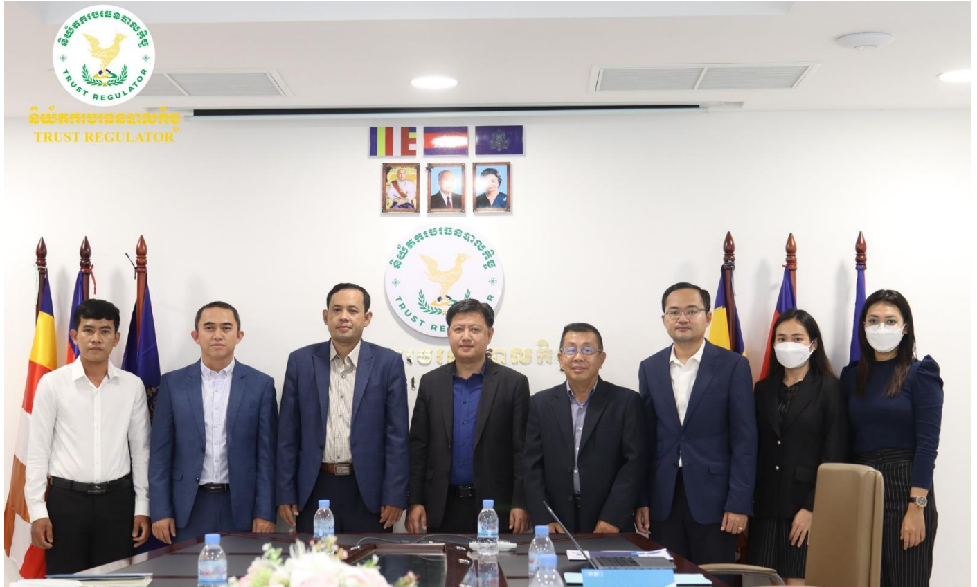
រូបភាពកិច្ចប្រជុំពិភាក្សាការងាររវាងនិយ័តករបរធនបាលកិច្ច និងវិទ្យាស្ថានហិរញ្ញវត្ថុ និងគណនេយ្យ (IFA)។