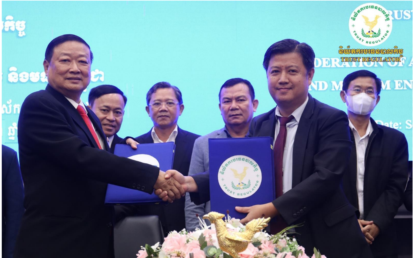
រូបភាពពិធីចុះហត្ថលេខាលើអនុស្សរណៈនៃការយោគយល់គ្នា (MOU) រវាងនិយ័តករបរធនបាលកិច្ច និងសម្ព័ន្ធសមាគមសហគ្រាសធុនតូច និងមធ្យមកម្ពុជា (FASMEC)។

សូមបញ្ជាក់ថា បរធនបាលកិច្ច គឺជាចំណងគតិយុត្ត ដែលក្នុងនោះ បរធនបាលទាយក (ម្ចាស់ទ្រព្យ) ប្រគល់ទ្រព្យរបស់ខ្លួនឱ្យ បរធនបាល (អ្នកជំនាញវិជ្ជាជីវៈ និងមានអាជ្ញាបណ្ណ) ឱ្យធ្វើការគ្រប់គ្រង ចាត់ចែង និងថែរក្សាសុវត្ថិភាព ឬថែរក្សាទុកជំនួស ដើម្បីជាប្រយោជន៍ ដល់បរធនបាលទាយកវិញ ឬដល់ភាគីផ្សេងទៀត។