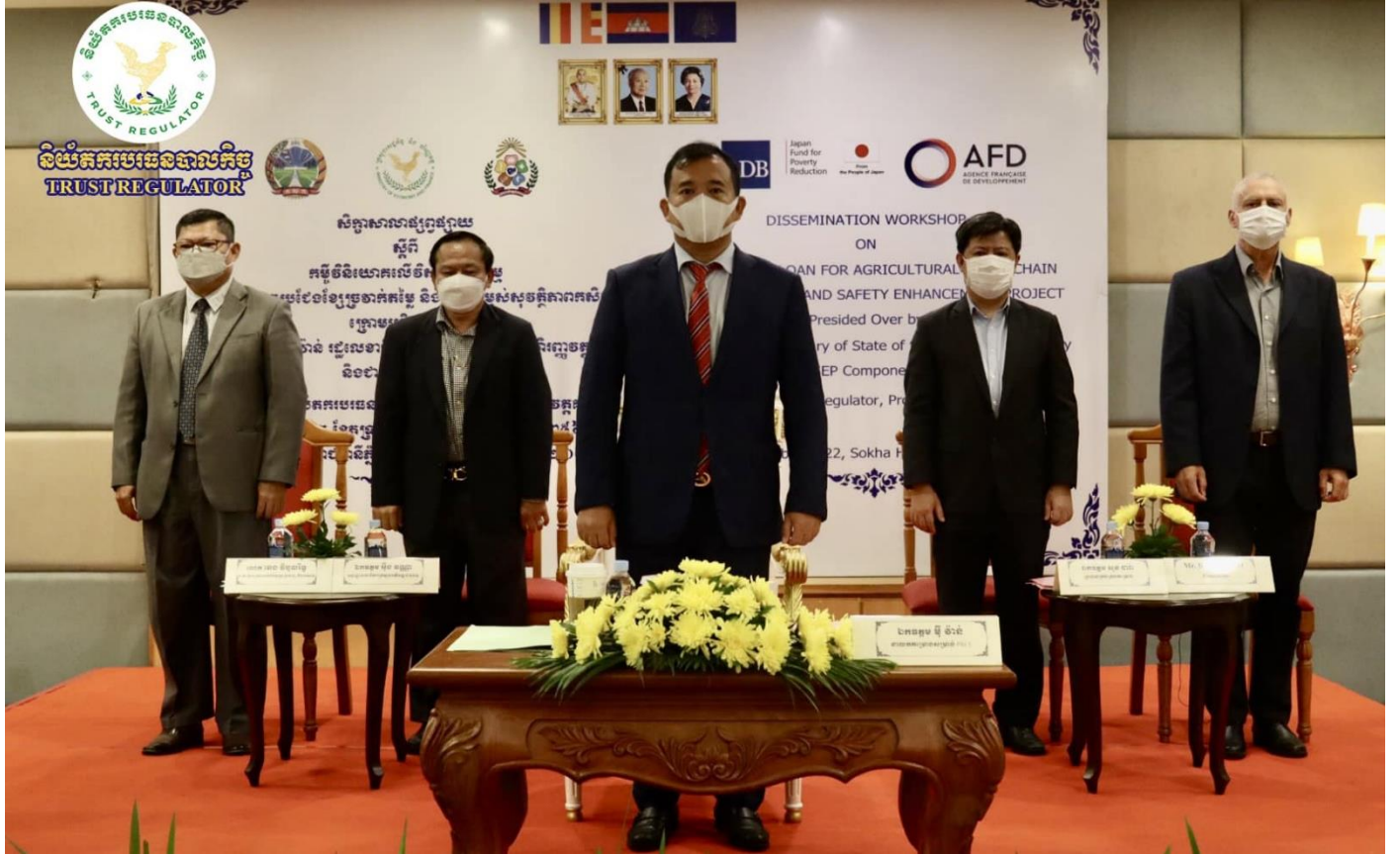
រូបភាពសិក្ខាសាលាផ្សព្វផ្សាយស្តីពី កម្មវិធីបណ្តុះបណ្តាលវិស័យកសិកម្មក្នុងក្របខណ្ឌគម្រោង ACSEP។

សិក្ខាសាលានេះ មានការចូលរួមពីសមាជិក និងទីប្រឹក្សាជាតិ និងអន្តរជាតិ របស់ ACSEP PIU1, តំណាងមកពីអគ្គនាយកដ្ឋានសហប្រតិបត្តិការអន្តរជាតិ និងគ្រប់គ្រងបំណុលនៃ កសហវ, តំណាងមកពី ADB, តំណាងអង្គការគ្រប់គ្រងគម្រោងមកពីក្រសួងកសិកម្ម រុក្ខាប្រមាញ់ និងនេសាទ, តំណាងក្រសួងអភិវឌ្ឍន៍ជនបទ, តំណាងមន្ទីរកសិកម្មរុក្ខាប្រមាញ់ និងនេសាទ តាមខេត្តគោលដៅទាំង៦ (ខេត្តសៀមរាប ព្រះវិហារ ឧត្តរមានជ័យ កំពង់ធំ កំពង់ចាម និងខេត្តត្បូងឃ្មុំ), និងតំណាងមកពីស្ថាប័នហិរញ្ញវត្ថុដៃគូ។