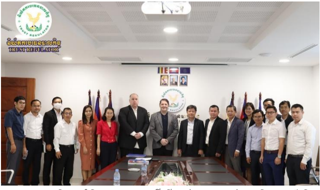
រូបភាពកិច្ចប្រជុំពិភាក្សាការងារដើម្បីផ្លាស់ប្តូរយោបល់ បទពិសោធន៍ និងបច្ចេកទេសអនុវត្តន៍ ជាមួយក្រុមហ៊ុនមេធាវី DFDL។

គោលបំណងនៃកិច្ចប្រជុំពិភាក្សានេះគឺដើម្បីផ្លាស់ប្តូរយោបល់ បទពិសោធន៍ និងបច្ចេកទេសអនុវត្តន៍ ក៏ដូចជាបង្កើនការយល់ដឹងទៅលើខុត្តមានវត្តពាក់ព័ន្ធនឹងការកំណត់របបពន្ធនានាពាក់ព័ន្ធនឹងវិស័យបរធនបាលកិច្ច។