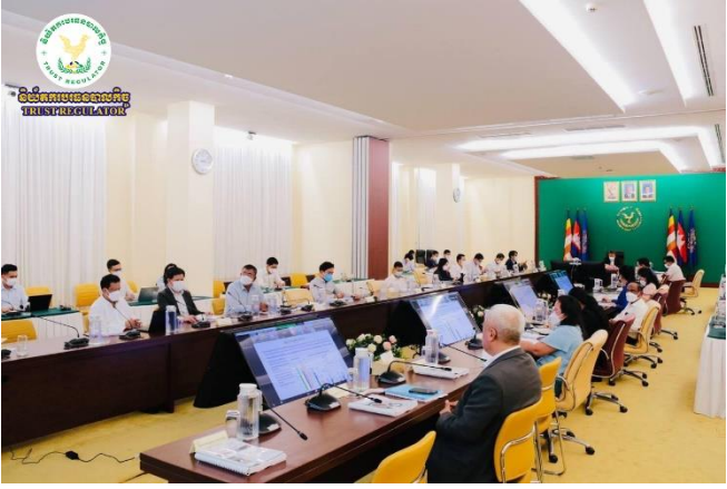
រូបភាពកិច្ចប្រជុំត្រួតពិនិត្យការអនុវត្តវិភាពកំណត់កណ្តាលឆ្នាំ២០២២ របស់ក្រសួងសេដ្ឋកិច្ចនិងហិរញ្ញវត្ថុ (កសហវ)។