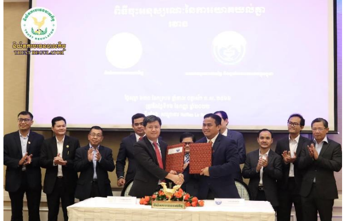
រូបភាពពិធីចុះហត្ថលេខាលើអនុស្សរណៈនៃការយោគយល់គ្នា (MOU) រវាង អ.ស.ម. ជាមួយ ក្រុមហ៊ុន ហ្សឺណេស ឯ.កនិងសមាគមអ្នកវាយតម្លៃ និងភ្នាក់ងារអចលនវត្ថុកម្ពុជា។ ទំព័រទី៥