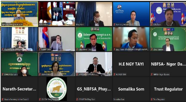
រូបភាពកិច្ចប្រជុំក្រុមប្រឹក្សា អ.ស.ហ. អាណត្តិទី១ លើកទី១០ ក្រោម អធិបតីភាពដ៏ខ្ពង់ខ្ពស់របស់ ឯកឧត្តមអគ្គបណ្ឌិតសភាចារ្យឧបនាយករដ្ឋមន្ត្រី អូន ព័ន្ធមុនីរ័ត្ន រដ្ឋមន្ត្រីក្រសួងសេដ្ឋកិច្ចនិងហិរញ្ញវត្ថុ និងជាប្រធានក្រុមប្រឹក្សា អ.ស.ហ. ។

នាព្រឹកថ្ងៃចន្ទ ៩រោច ខែភទ្របទ ឆ្នាំខាល ចត្វាស័ក ព.ស. ២៥៦៦ ត្រូវនឹងថ្ងៃទី១៩ ខែកញ្ញា ឆ្នាំ២០២២ ឯកឧត្តម សុខ ដារ៉ា អគ្គនាយកនៃនិយ័តករបរធនបាលកិច្ច ( ន.ប.ប. ) និងជាសមាជិក ក្រុមប្រឹក្សាអាជ្ញាធរសេវាហិរញ្ញវត្ថុមិនមែនធនាគារ ( អ.ស.ហ. ) អមដោយឯកឧត្តមអគ្គនាយករង និងថ្នាក់ដឹកនាំកម្រិតនាយកដ្ឋាន បានអញ្ជើញចូលរួមការពារសេចក្តីព្រាង "ផែនការសកម្មភាពសម្រាប់ បីឆ្នាំរំកិល ២០២២-២០២៤ និងផែនការសកម្មភាពឆ្នាំ២០២២" របស់ ន.ប.ប. ក្នុងកិច្ចប្រជុំក្រុមប្រឹក្សា អ.ស.ហ. អាណត្តិទី១ លើកទី១០ ក្រោមអធិបតីភាពដ៏ខ្ពង់ខ្ពស់របស់ ឯកឧត្តមអគ្គបណ្ឌិត សភាចារ្យឧបនាយករដ្ឋមន្ត្រី អូន ព័ន្ធមុនីរ័ត្ន រដ្ឋមន្ត្រីក្រសួងសេដ្ឋកិច្ច និងហិរញ្ញវត្ថុ និងជាប្រធានក្រុមប្រឹក្សា អ.ស.ហ. ដោយមានការ អញ្ជើញចូលរួមពីឯកឧត្តម លោកជំទាវ អនុប្រធាន អគ្គលេខាធិការ និងសមាជិក-សមាជិកនៃ អ.ស.ហ. តាមប្រព័ន្ធ Zoom។ ជាលទ្ធផល សេចក្តីព្រាង "ផែនការសកម្មភាពសម្រាប់បីឆ្នាំរំកិល ២០២២- ២០២៤ និងផែនការសកម្មភាពឆ្នាំ២០២២" របស់ ន.ប.ប. ត្រូវបាន អនុម័តពីកិច្ចប្រជុំ។