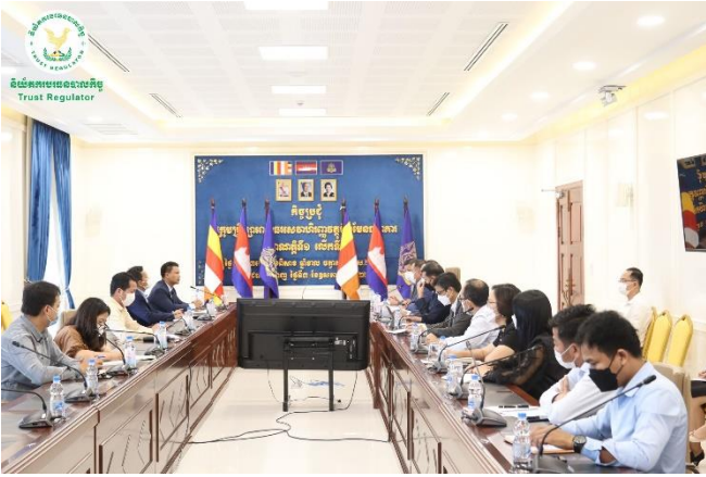
រូបភាពកិច្ចប្រជុំពិភាក្សាការងារអំពីការពិនិត្យលទ្ធភាពលើការបង្កើតយន្តការការងាររវាងអាជ្ញាធរសេវាហិរញ្ញវត្ថុមិនមែនធនាគារ (ឧ.ស.ឧ.) ជាមួយសភាពាណិជ្ជកម្មកម្ពុជា។