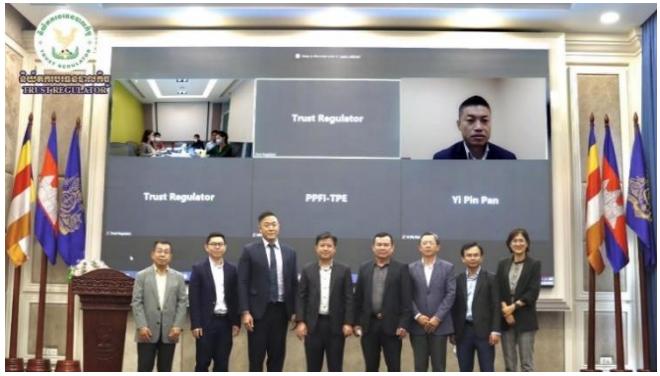
រូបភាពសិក្ខាសាលាស្តីពី "ការចែករំលែកបទពិសោធន៍ និងឧត្តមានុវត្ត និង បច្ចេកវិទ្យាហិរញ្ញវត្ថុក្នុងវិស័យបរធនបាលកិច្ច"។

សិក្ខាសាលានេះ ត្រូវបានរៀបចំឡើងក្នុងគោលបំណង ចែករំលែកនូវបទពិសោធន៍ ឧត្តមានុវត្ត និងបច្ចេកវិទ្យាហិរញ្ញវត្ថុ ក្នុងវិស័យបរធនបាលកិច្ច ដោយមានការធ្វើបទបង្ហាញពីវាក្យសិទ្ធិ ជំនាញមានបទពិសោធន៍ច្រើនឆ្នាំផ្នែកប្រតិបត្តិការ និងអនុវត្តផ្នែក បច្ចេកវិទ្យាពីក្រុមហ៊ុន PPFi។