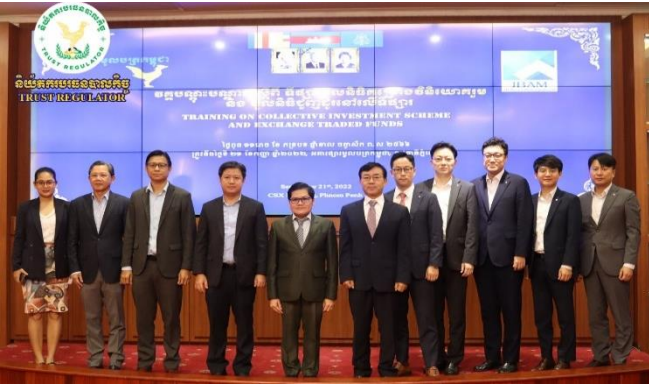
រូបភាពកម្មវិធីបណ្តុះបណ្តាលស្តីពី "គម្រោងវិនិយោគរួម និងមូលនិធិអាចជួញដូរបាន (Collective Investment Scheme and Exchange Traded Funds - ETFs)"។