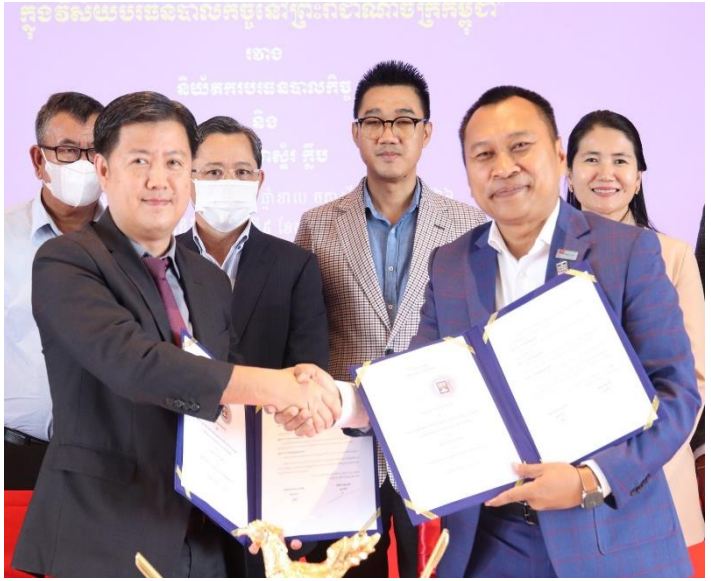
រូបភាពពិធីចុះហត្ថលេខាលើអនុស្សរណៈនៃការយោគយល់គ្នា (MOU) រវាង និយ័តករបរធនបាលកិច្ច និង CEO Master Club ។