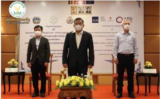
រូបភាពសិក្ខាសាលាផ្សព្វផ្សាយស្តីពី ផែនការសកម្មភាព និងថវិកាឆ្នាំ២០២២-២០២៣ នៃគម្រោង ACSEP។