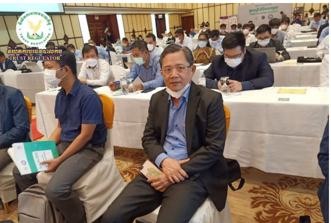
រូបភាពក្នុងសិក្ខាសាលាផ្សព្វផ្សាយស្តីពី “ថ្នាលគ្រឹះឌីជីថលកម្ពុជា” ដែល រៀបចំឡើងដោយក្រសួងសេដ្ឋកិច្ចនិងហិរញ្ញវត្ថុ

សិក្ខាសាលានេះរៀបចំឡើងក្នុងគោលបំណងផ្សព្វផ្សាយ ឱ្យបានទូលំទូលាយ និងលើកទឹកចិត្តឱ្យអ្នកចូលរួម ដើម្បីស្វែងយល់ បន្ថែមទៀត ក៏ដូចជាការទាញយកអត្ថប្រយោជន៍ជាអតិបរមាពីថ្នាល គ្រឹះឌីជីថលរបស់រាជរដ្ឋាភិបាលដែលបាន និងកំពុងអភិវឌ្ឍបន្ថែម ទាំងនេះ។