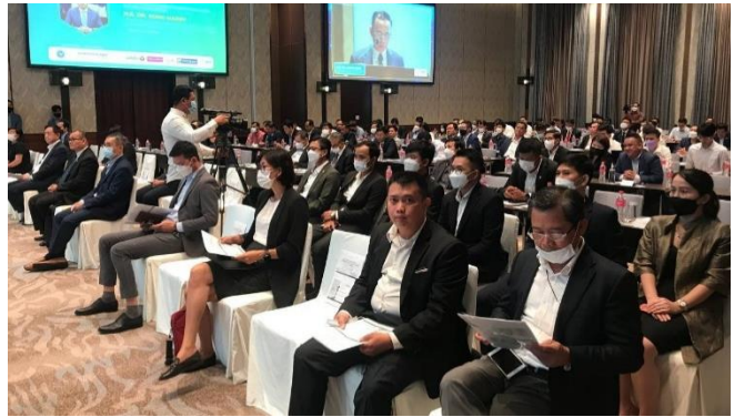
រូបភាពសិក្ខាសាលាស្តីពី "តួនាទីនៃវិស័យធនាគារ និងបច្ចេកវិទ្យាហិរញ្ញវត្ថុ ក្នុងសេដ្ឋកិច្ចឌីជីថលកម្ពុជា"។

នារសៀលថ្ងៃព្រហស្បតិ៍ ១២ រោច ខែភទ្របទ ឆ្នាំខាល ចត្វាស័ក ព.ស.២៥៦៦ ត្រូវនឹងថ្ងៃទី២២ ខែកញ្ញា ឆ្នាំ២០២២ ដោយមានការអនុញ្ញាតដ៏ខ្ពង់ខ្ពស់ពី ឯកឧត្តម សុខ ដារ៉ា អគ្គនាយកនៃនិយ័តករបរធនបាលកិច្ច ( ន.ប.ប. ) ឯកឧត្តម ណឺ សាកល អគ្គនាយករងនៃ ន.ប.ប. និងជាសមាជិកក្រុមការងាររៀបចំ សេចក្តីព្រាងគោលនយោបាយអភិវឌ្ឍវិស័យបច្ចេកវិទ្យាហិរញ្ញវត្ថុ កម្ពុជា អមដោយកញ្ញា ឈាន សុខារី ប្រធាននាយកដ្ឋានកិច្ចការ គតិយុត្ត និងអធិការកិច្ច និងលោក វិទ ឌីវា អនុប្រធាននាយកដ្ឋាន ចុះបញ្ជីបរធនបាលកិច្ច បានចូលរួមសិក្ខាសាលាស្តីពី "តួនាទីនៃ វិស័យធនាគារ និងបច្ចេកវិទ្យាហិរញ្ញវត្ថុក្នុងសេដ្ឋកិច្ចឌីជីថលកម្ពុជា" ក្រោមអធិបតីភាពរបស់ឯកឧត្តមបណ្ឌិត គង់ ម៉ារី អនុរដ្ឋលេខា ធិការនៃក្រសួងសេដ្ឋកិច្ចនិងហិរញ្ញវត្ថុ និងជាអគ្គលេខាធិការនៃ អគ្គលេខាធិការដ្ឋានគណៈកម្មាធិការសេដ្ឋកិច្ច និងធុរកិច្ចឌីជីថល និងឯកឧត្តម អ៊ុំ ចាន់នារា អគ្គលេខាធិការនៃធនាគារជាតិនៃកម្ពុជា។