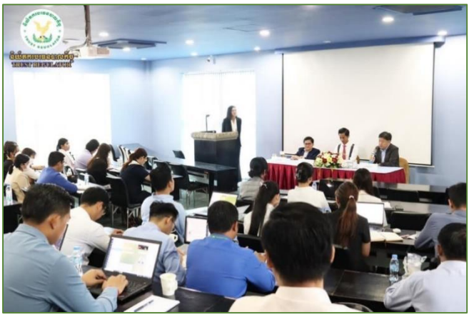
រូបភាព៖ សិក្ខាសាលាស្តីពី "ការយល់ដឹងនៃច្បាប់ស្តីពីវិនិយោគនៅប្រទេសកម្ពុជា" នៅវិទ្យាស្ថានខេមបូឌី។

សិក្ខាសាលានេះ ត្រូវបានរៀបចំឡើងក្នុងគោលបំណងដើម្បីចែករំលែកចំណេះដឹងពាក់ព័ន្ធនឹងច្បាប់ស្តីពី វិនិយោគនៅប្រទេសកម្ពុជាដល់ថ្នាក់ដឹកនាំ និងមន្ត្រីរបស់និយ័តករទាំងពីរ។