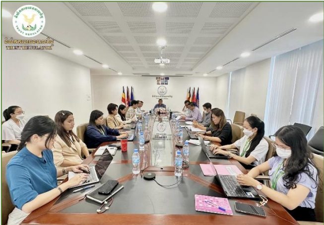
រូបភាព៖ ប្រជុំបូកសរុបការងារប្រចាំខែមិថុនា ឆ្នាំ២០២៣ និងទិសដៅការងារប្រចាំខែកក្កដា ឆ្នាំ២០២៣។

នាព្រឹកថ្ងៃព្រហស្បតិ៍ ៤រោច ខែបឋមសាធ ឆ្នាំថោះ បញ្ចស័ក ព.ស.២៥៦៧ ត្រូវនឹងថ្ងៃទី៦ ខែកក្កដា ២០២៣ ឯកឧត្តម នង ពិសិដ្ឋ អគ្គនាយករងនៃនិយ័តករបរធនបាលកិច្ច ( ន.ប.ធន. ) បានដឹកនាំកិច្ចប្រជុំបូកសរុបការងារប្រចាំខែមិថុនា ឆ្នាំ២០២៣ និងទិសដៅការងារប្រចាំខែកក្កដា ឆ្នាំ២០២៣ ក្នុងកម្រិតអន្តរ-នាយកដ្ឋាន រួមមាន នាយកដ្ឋានស្រាវជ្រាវ បណ្តុះបណ្តាល និងសហប្រតិបត្តិការ និងនាយកដ្ឋានកិច្ចការគតិយុត្តនិងអធិការកិច្ច។ កិច្ចប្រជុំនេះ មានការចូលរួមពីលោក/កញ្ញាប្រធាននាយកដ្ឋាន អនុប្រធាននាយកដ្ឋាន, ប្រធានការិយាល័យ, អនុប្រធានការិយាល័យ និងមន្ត្រីជំនាញទាំងអស់នៃនាយកដ្ឋានទាំងពីរ។ នៅក្នុងកិច្ចប្រជុំនេះ ឯកឧត្តមអគ្គនាយករងបានធ្វើការវាយតម្លៃខ្ពស់លើសមិទ្ធផលការងារដែលសម្រេចបានក្នុងខែមិថុនា ព្រមទាំងបានកោតសរសើរដល់កិច្ចខិតខំប្រឹងប្រែង និងការទទួលខុសត្រូវខ្ពស់របស់ថ្នាក់ដឹកនាំ និងមន្ត្រីទាំងអស់នៃនាយកដ្ឋានទាំងពីរ និងបានផ្តល់ជាអនុសាសន៍ណែនាំសម្រាប់ទិសដៅការងារនៅក្នុងខែបន្ទាប់ផងដែរ។ កិច្ចប្រជុំនេះ បានបញ្ចប់ដោយរលូន ប្រកបដោយផ្លែផ្កា និងស្មារតីទទួលខុសត្រូវខ្ពស់។