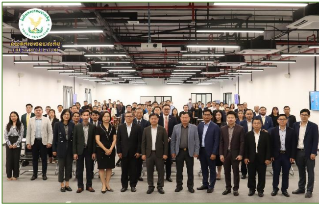
រូបភាព៖ ជំនួបបរិច្ឆេទបណ្តុះបណ្តាលកិច្ច ប្រព័ន្ធសហចាប់គ្នាសម្រាប់ទីផ្សារបរិច្ឆេទបណ្តុះបណ្តាលកិច្ចនៅកម្ពុជា។