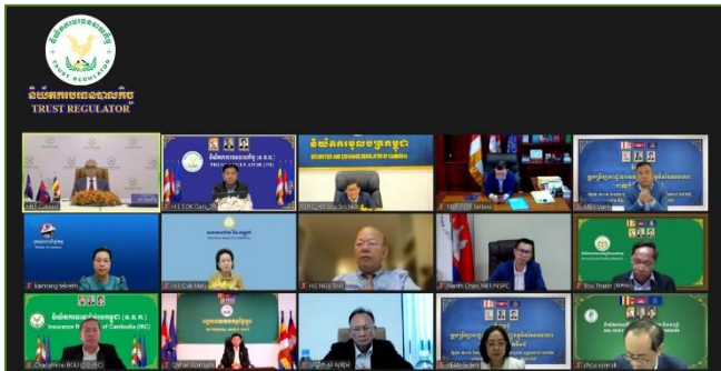
រូបភាព៖ កិច្ចប្រជុំក្រុមប្រឹក្សា អ.ស.ហ. អាណត្តិទី១ លើកទី១៤។

នាសៀលថ្ងៃពុធ ៣រោច ខែបឋមសាធាណ៍ ឆ្នាំថោះ បញ្ចស័ក ព.ស.២៥៦៧ ត្រូវនឹងថ្ងៃទី៥ ខែកក្កដា ឆ្នាំ២០២៣ ឯកឧត្តម សុខ ដារ៉ា អគ្គនាយកនៃនិយ័តករបរិច្ឆេទបាលកិច្ច (ន.ប.ប.) និងជាសមាជិកក្រុមប្រឹក្សាអាជ្ញាធរសេវាហិរញ្ញវត្ថុមិនមែនធនាគារ (អ.ស.ហ.) អមដោយឯកឧត្តមអគ្គនាយករង និងថ្នាក់ដឹកនាំនាយកដ្ឋាននៃ ន.ប.ប. បានចូលរួមកិច្ចប្រជុំក្រុមប្រឹក្សា អ.ស.ហ. អាណត្តិទី១ លើកទី១៤ ក្រោមអធិបតីភាពដ៏ខ្ពង់ខ្ពស់របស់ ឯកឧត្តមអគ្គបណ្ឌិតសភាចារ្យ អូន ព័ន្ធមុនីរ័ត្ន ឧបនាយករដ្ឋមន្ត្រី រដ្ឋមន្ត្រីក្រសួងសេដ្ឋកិច្ចនិងហិរញ្ញវត្ថុ និងជាប្រធានក្រុមប្រឹក្សា អ.ស.ហ. និងមានការចូលរួមពី ឯកឧត្តមលោកជំទាវ រដ្ឋលេខាធិការ និង ឯកឧត្តមអគ្គនាយកនៃនិយ័តករក្រោមឱវាទ អ.ស.ហ. ដែលជាសមាជិក-សមាជិកា អ.ស.ហ. តាមរយៈប្រព័ន្ធសន្តិសីទវីឌីអូពីចម្ងាយ(Zoom)។