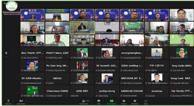
រូបភាព៖ កិច្ចប្រជុំកិច្ចប្រជុំ ដើម្បីពិភាក្សាលើសេចក្តីព្រាងរបាយការណ៍ស្តីពីលទ្ធផលនៃការអនុវត្តថវិកាធានាសេដ្ឋកិច្ច និងការប៉ាន់ស្មានលទ្ធផលនៃការអនុវត្តថវិកាឆ្នាំ២០២៣។

នៅព្រឹកថ្ងៃអង្គារ ១កើត ខែទុតិយសាណ ឆ្នាំថោះ បញ្ចស័ក ព.ស.២៥៦៧ ត្រូវនឹងថ្ងៃទី១៨ ខែកក្កដា ឆ្នាំ២០២៣ ដោយទទួលបានការអនុញ្ញាតដ៏ខ្ពង់ខ្ពស់ពី ឯកឧត្តមអគ្គបណ្ឌិតសភាចារ្យ អូន ព័ន្ធមុនីរ័ត្ន ឧបនាយករដ្ឋមន្ត្រី រដ្ឋមន្ត្រីក្រសួងសេដ្ឋកិច្ចនិងហិរញ្ញវត្ថុ និងជាប្រធានក្រុមប្រឹក្សាអាជ្ញាធរសេវាហិរញ្ញវត្ថុមិនមែនធនាគារ (អ.ស.ប.) និយ័តករបរធនបាលកិច្ច (ន.ប.ប.) និងសភាពារាណីជ្ជកម្មកម្ពុជា។