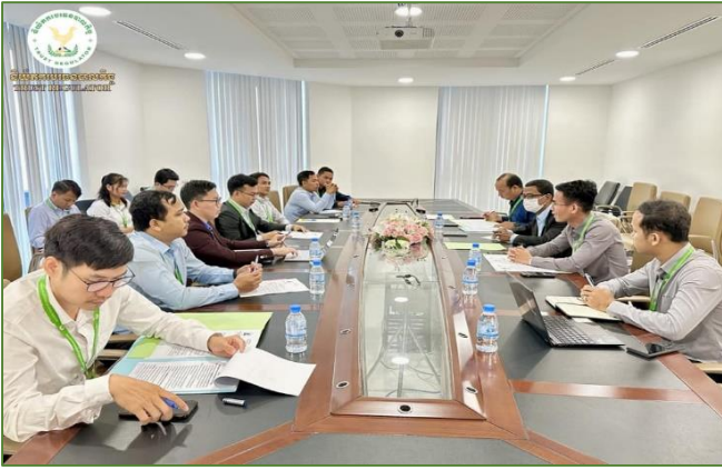
រូបភាព៖ កិច្ចប្រជុំកិច្ចប្រជុំពិភាក្សាជាមួយតំណាងអង្គការសវនកម្មផ្ទៃក្នុងនៃអាជ្ញាធរសេវាហិរញ្ញវត្ថុមិនមែនធនាគារ។