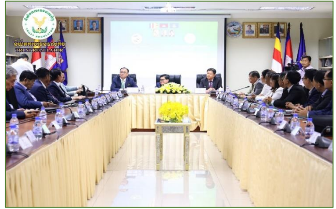
រូបភាព៖ ពិធីចុះហត្ថលេខាលើអនុស្សរណៈនៃការយោគយល់គ្នា រវាង ន.ប.ប. និង សភាពាណិជ្ជកម្មកម្ពុជា។