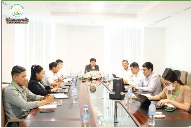
រូបភាព៖ កិច្ចប្រជុំពិភាក្សាការងារជាមួយក្រុមការងារបច្ចេកទេសថ្នាក់ជាតិសម្រាប់ ទិន្នន័យកម្ពុជា (CamDX) នៃមជ្ឈមណ្ឌលបណ្តុះបណ្តាលកិច្ចផ្តល់សេវា។