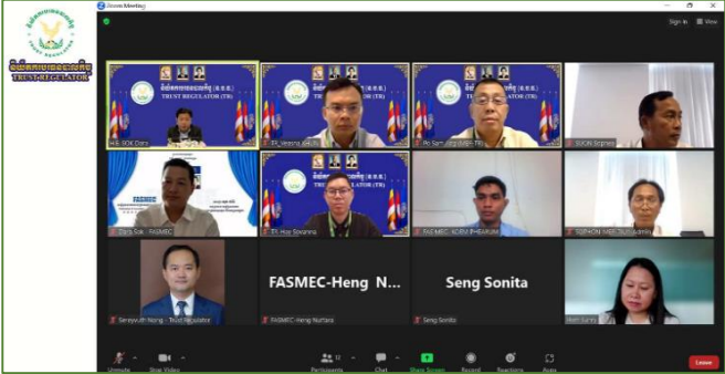
រូបភាព៖ កិច្ចប្រជុំពិភាក្សាការងារជាមួយសម្ព័ន្ធសមាគមសហគ្រាសធុនតូច និងមធ្យមកម្ពុជា (FASMEC)។

នៅព្រឹកថ្ងៃពុធ ១០រោច ខែបឋមសាណ ឆ្នាំថោះ បញ្ចស័ក ព.ស.២៥៦៧ ត្រូវនឹងថ្ងៃទី១២ ខែកក្កដា ឆ្នាំ២០២៣ ឯកឧត្តម សុខ ដារ៉ា អគ្គនាយកនៃនិយ័តករបរធនបាលកិច្ច (ន.ប.ប.) អមដោយឯកឧត្តមអគ្គនាយករង, ថ្នាក់ដឹកនាំនាយកដ្ឋាន និងមន្ត្រីជំនាញនៃ ន.ប.ប. បានចូលរួមកិច្ចប្រជុំ ដើម្បីពិភាក្សាលើសេចក្តីព្រាងរបាយការណ៍ស្តីពីលទ្ធផលនៃការអនុវត្តថវិកាធានាសេដ្ឋកិច្ច និងការប៉ាន់ស្មានលទ្ធផលនៃការអនុវត្តថវិកាឆ្នាំ២០២៣ ក្រោមអធិបតីភាពដ៏ខ្ពង់ខ្ពស់របស់ ឯកឧត្តមអគ្គបណ្ឌិតសភាចារ្យ អូន ព័ន្ធមុនីរ័ត្ន ឧបនាយករដ្ឋមន្ត្រី រដ្ឋមន្ត្រីក្រសួងសេដ្ឋកិច្ចនិងហិរញ្ញវត្ថុ និងមានការអញ្ជើញចូលរួមពី ឯកឧត្តម លោកជំទាវ លោក លោកស្រី ដែលជាថ្នាក់ដឹកនាំស្ថាប័ន អង្គភាព និងរដ្ឋបាលថ្នាក់ក្រោមជាតិ តាមប្រព័ន្ធអនឡាញ Zoom។