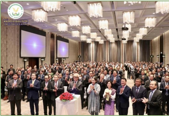
រូបភាព៖ ពិធី “ប្រកាសដាក់ឱ្យអនុវត្តនីតិវិធីតាម FMIS ទាំងស្រុង, ពង្រីកការប្រើប្រាស់ FMIS ទៅការដ្ឋានថ្មី និងពង្រីកការប្រើប្រាស់ FMIS Portal ជំនាន់ទី១ នៅរដ្ឋបាលក្រុង-ស្រុក-ឃុំ ដែលនៅសេសសល់ទាំងអស់”។

នារសៀលថ្ងៃព្រហស្បតិ៍ ៤រោច ខែបឋមសាណ ឆ្នាំថោះ បញ្ចស័ក ព.ស.២៥៦៧ ត្រូវនឹងថ្ងៃទី៦ ខែកក្កដា ឆ្នាំ២០២៣ ដោយទទួលបានការអនុញ្ញាតដ៏ខ្ពង់ខ្ពស់ពី ឯកឧត្តម សុខ ដារ៉ា អគ្គនាយកនៃនិយ័តករបរិច្ឆេទបាលកិច្ច ( ន.ប.ប. ), ឯកឧត្តម ឌី សាកល អគ្គនាយករងនៃ ន.ប.ប. និង លោក យុន វាសនា ប្រធាននាយកដ្ឋានកិច្ចការទូទៅ ព្រមទាំងសហការី បានអញ្ជើញចូលរួមក្នុងពិធី “ប្រកាសដាក់ឱ្យអនុវត្តនីតិវិធីតាម FMIS ទាំងស្រុង, ពង្រីកការប្រើប្រាស់ FMIS ទៅការដ្ឋានថ្មី និងពង្រីកការប្រើប្រាស់ FMIS Portal ជំនាន់ទី១ នៅរដ្ឋបាលក្រុង-ស្រុក-ឃុំ ដែលនៅសេសសល់ទាំងអស់” ក្រោមអធិបតីភាពដ៏ខ្ពង់ខ្ពស់របស់ ឯកឧត្តម អគ្គបណ្ឌិតសភាចារ្យ អុន ព័ន្ធមុនីរ័ត្ន ឧបនាយករដ្ឋមន្ត្រី រដ្ឋមន្ត្រីក្រសួងសេដ្ឋកិច្ច និងហិរញ្ញវត្ថុ នៅសណ្ឋាគារហៃយ៉ាត័រីជេនស៊ី ភ្នំពេញ។