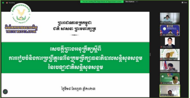
រូបភាព៖ កិច្ចប្រជុំកម្រិតបច្ចេកទេសនៃអាជ្ញាធរសេវាហិរញ្ញវត្ថុមិនមែនធនាគារ ( អ.ស.ប. )។

នារសៀលថ្ងៃអង្គារ ១កើត ខែទុតិយាសាណ ឆ្នាំថោះ បញ្ចស័ក ព.ស.២៥៦៧ ត្រូវនឹងថ្ងៃទី១៨ ខែកក្កដា ឆ្នាំ២០២៣ ឯកឧត្តម សុខ ដារ៉ា អគ្គនាយកនៃនិយ័តករបរទេសបាលកិច្ច ( ន.ប.ប. ) អមដោយសហការី បានអញ្ជើញចូលរួមកិច្ចប្រជុំ ដើម្បីពិភាក្សាលើលើរបៀបវារៈចំនួន ២ គឺ៖ (១).សេចក្តីព្រាងអនុក្រឹត្យស្តីពី "ការរៀបចំនិងការប្រព្រឹត្តទៅនៃក្រុមប្រឹក្សាធនាគារភិបាលសន្តិសុខសង្គម នៃបេឡាជាតិសន្តិសុខសង្គម" (២).សេចក្តីព្រាងប្រកាសស្តីពី "បរិស្ថានសាកល្បងបច្ចេកវិទ្យាហិរញ្ញវត្ថុក្នុងវិស័យហិរញ្ញវត្ថុមិនមែនធនាគារ"ក្រោមការដឹកនាំដ៏ខ្ពង់ខ្ពស់របស់ ឯកឧត្តម រស់ សីលវ៉ា រដ្ឋលេខាធិការក្រសួងសេដ្ឋកិច្ចនិងហិរញ្ញវត្ថុនិងជាអនុប្រធានអាជ្ញាធរសេវាហិរញ្ញវត្ថុមិនមែនធនាគារ ( អ.ស.ប. ) និងមានការចូលរួមពី ឯកឧត្តម លោកជំទាវ រដ្ឋលេខាធិការ និងឯកឧត្តមអគ្គនាយកនៃនិយ័តករ និងអង្គភាពក្រោមឱវាទ អ.ស.ប. តាមរយៈប្រព័ន្ធសន្តិសីទវីឌីអូពីចម្ងាយ (Zoom)។