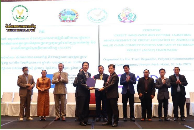
រូបភាព៖ កម្មវិធីប្រគល់-ទទួលឥណទាន និងប្រកាសដាក់ឱ្យដំណើរការប្រតិបត្តិការឥណទានជាផ្លូវការនៃគម្រោងប្រកួតប្រជែងវិឌ្ឍន៍កសិកម្ម និងលើកកម្ពស់សុវត្ថិភាព កសិកម្ម (ACSEP)។