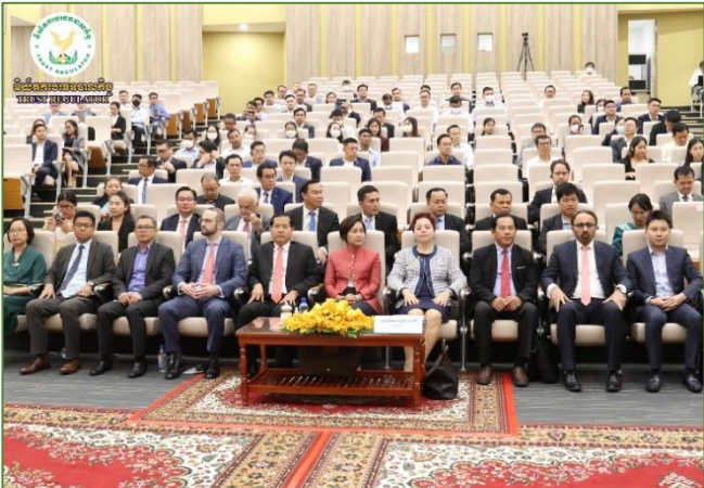
រូបភាព៖ សិក្ខាសាលា ស្តីពី “ការផ្សព្វផ្សាយរបាយការណ៍ស្ថានភាពស្ថិរភាពហិរញ្ញវត្ថុកម្ពុជា ប្រចាំឆ្នាំ២០២២”។

នាព្រឹកថ្ងៃព្រហស្បតិ៍ ៤រោច ខែបឋមសាណ ឆ្នាំថោះ បញ្ចស័ក ព.ស.២៥៦៧ ត្រូវនឹងថ្ងៃទី៦ ខែកក្កដា ឆ្នាំ២០២៣ ដោយទទួលបានការអនុញ្ញាតដ៏ខ្ពង់ខ្ពស់ពី ឯកឧត្តម សុខ ដារ៉ា អគ្គនាយកនៃនិយ័តករបរិច្ឆេទបាលកិច្ច ( ន.ប.ប. ), ឯកឧត្តម ឌី សាកល អគ្គនាយករងនៃ ន.ប.ប. អមដោយមន្ត្រីជំនាញបានអញ្ជើញចូលរួមសិក្ខាសាលាស្តីពី “ការផ្សព្វផ្សាយរបាយការណ៍ស្ថានភាពស្ថិរភាពហិរញ្ញវត្ថុកម្ពុជា ប្រចាំឆ្នាំ២០២២” ដើម្បីផ្សព្វផ្សាយពីស្ថានភាពស្ថិរភាពហិរញ្ញវត្ថុកម្ពុជា ប្រចាំឆ្នាំ២០២២ និងពិភាក្សាអំពីបញ្ហាប្រឈម និងវិធានការនានានៅក្នុងវិស័យហិរញ្ញវត្ថុ ក្រោមអធិបតីភាពដ៏ខ្ពង់ខ្ពស់របស់ លោកជំទាវបណ្ឌិត ជា សិរី ទេសាភិបាលរងនៃធនាគារជាតិនៃកម្ពុជា នៅមណ្ឌលសិក្សាបច្ចេកទេសធនាគារ។