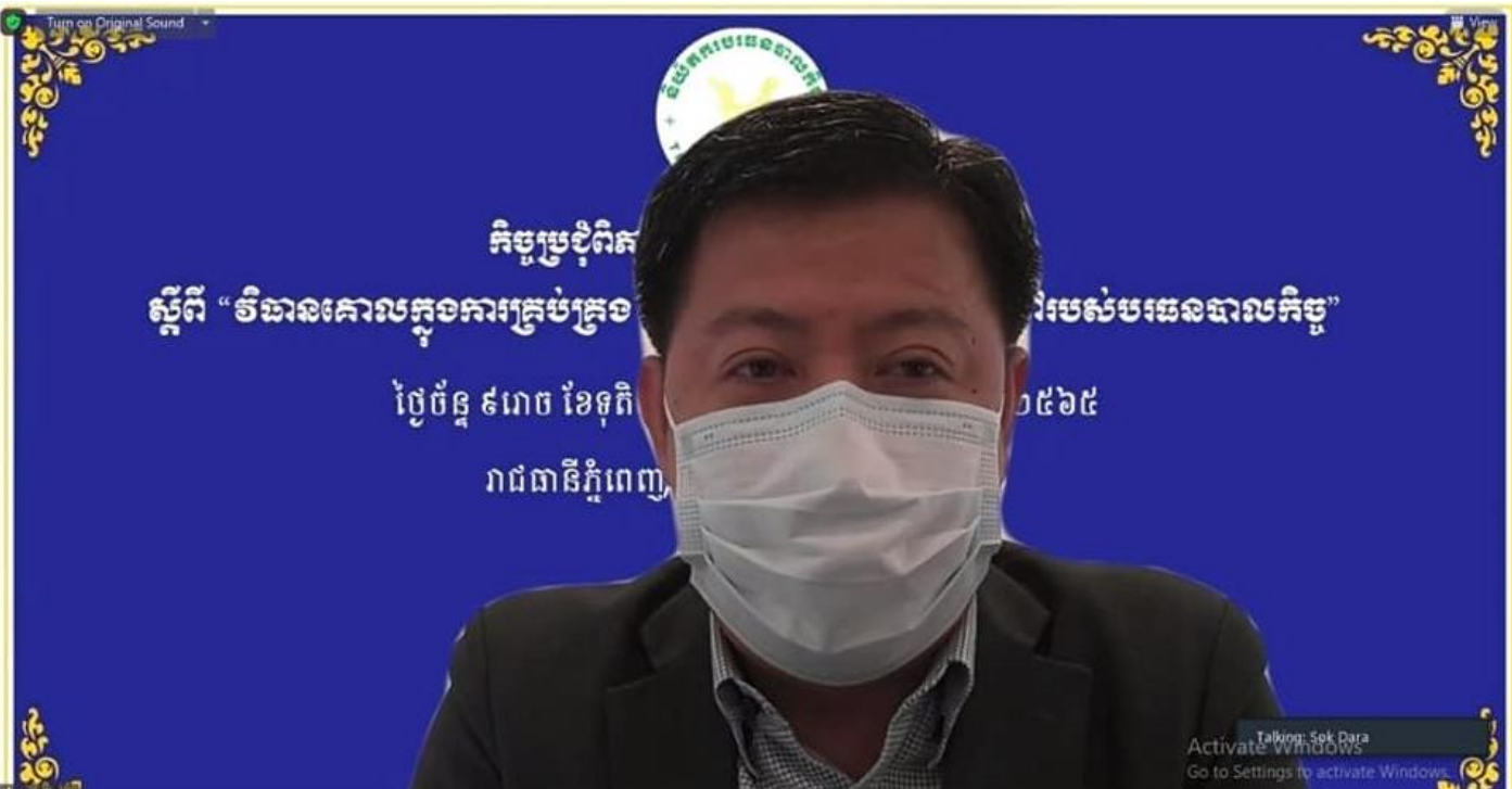
រូបភាពក្នុងកិច្ចប្រជុំពិភាក្សាលើសេចក្តីព្រាងប្រកាសស្តីពី “វិធានគោលក្នុងការគ្រប់គ្រង ការរៀបចំ និងការប្រព្រឹត្តទៅរបស់មរណប្រាក់កិច្ច” តាមប្រព័ន្ធអនឡាញ ក្រោម ការដឹកនាំដ៏ខ្ពង់ខ្ពស់របស់ឯកឧត្តម សុខ ដារ៉ា ។ ទំព័រ ១