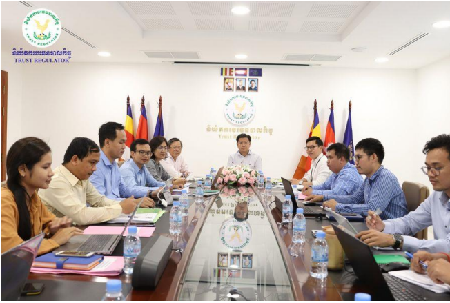
រូបភាពកិច្ចប្រជុំអន្តរនាយកដ្ឋាន ដើម្បីពិនិត្យ និងពិភាក្សាលើសេចក្តីព្រាងប្រកាសស្តីពី ការទទួលស្គាល់ក្រុមហ៊ុនវាយតម្លៃក្នុងវិស័យបរទេសកិច្ច។