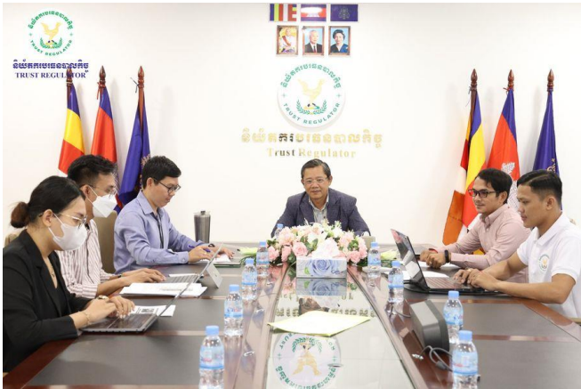
រូបភាពកិច្ចប្រជុំអន្តរនាយកដ្ឋាន ដើម្បីពិនិត្យ និងពិភាក្សាពីវឌ្ឍនភាពការងារពាក់ព័ន្ធនឹងគេហទំព័រ (Website) របស់ អ.ប.ប. ។

ហិរញ្ញវត្ថុមិនមែនធនាគារនៃប្រទេសឥណ្ឌូនេស៊ី (OJK) ដែលបានប្រព្រឹត្តទៅនៅសណ្ឋាគារ រ៉ូស៊ូដ ភ្នំពេញ ក្រោមអធិបតីភាពរបស់ ឯកឧត្តម ម៉ី វ៉ាន់ រដ្ឋលេខាធិការ នៃក្រសួងសេដ្ឋកិច្ចនិងហិរញ្ញវត្ថុ និងជាអគ្គលេខាធិការ នៃអគ្គលេខាធិការដ្ឋាននៃ អ.ប.ប. ។