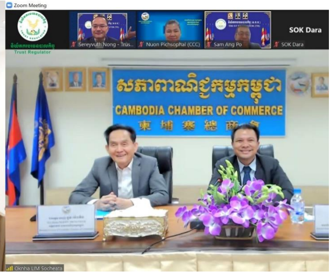
រូបភាពកិច្ចប្រជុំពិភាក្សាការងារជាមួយសភាពាណិជ្ជកម្មកម្ពុជា (CCC)