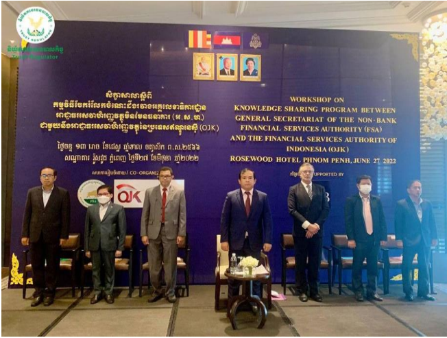
រូបភាពសិក្ខាសាលាស្តីពី "កម្មវិធីចែករំលែកចំណេះដឹងរវាង អ.ប.ប. និង OJK"។