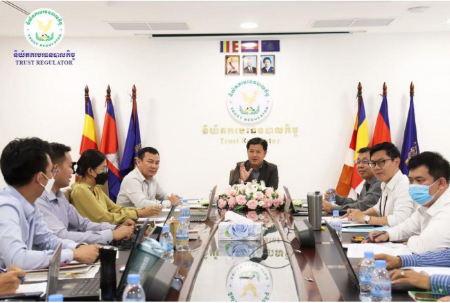
រូបភាពកិច្ចប្រជុំអន្តរជាតិដើម្បីពិនិត្យ និងពិភាក្សាលើសេចក្តីប្រាង្គ ប្រកាសស្តីពី បែបបទ និងនីតិវិធីនៃការធ្វើអធិការកិច្ចបរទេសបាលកិច្ច។