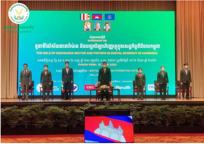
រូបភាពចូលរួមសិក្ខាសាលាស្តីពី “តួនាទីនៃវិស័យធានារ៉ាប់រង និងបច្ចេកវិទ្យាហិរញ្ញវត្ថុក្នុងសេដ្ឋកិច្ចឌីជីថលកម្ពុជា”