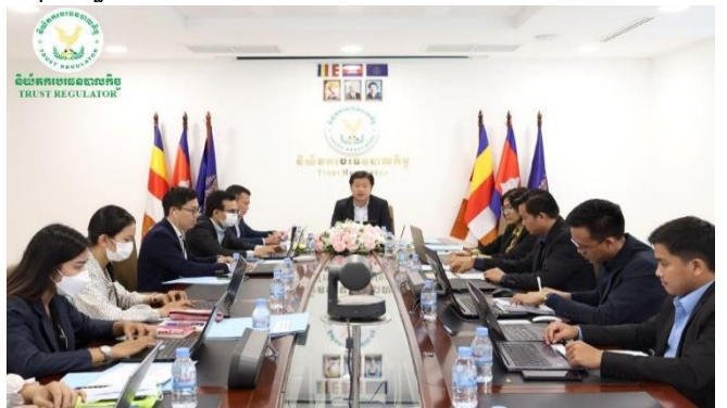
រូបភាពសិក្ខាសាលាផ្សព្វផ្សាយស្តីពី “កាតព្វកិច្ចរបស់បុគ្គលរាយការណ៍និងទម្រង់របាយការណ៍បង្កកទ្រព្យសម្បត្តិ ដើម្បីប្រឆាំងហិរញ្ញប្បទានដល់ការរីកសាយភាយអវុធមហាប្រល័យ”។