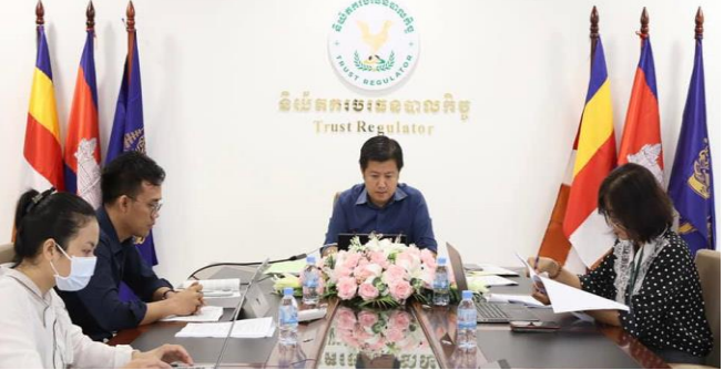
រូបភាពចូលរួមក្នុងកិច្ចប្រជុំពិនិត្យ និងពិភាក្សាលើសេចក្តីព្រាងអនុក្រឹត្យស្តី ពីការរៀបចំ និងការប្រព្រឹត្តទៅរបស់មូលនិធិអភិវឌ្ឍសហគមន៍កសិកម្ម។

នាព្រឹកថ្ងៃពុធ ៩កើត ខែជេស្ឋ ឆ្នាំខាល ចត្វាស័ក ព.ស. ២៥៦៦ ត្រូវនឹងថ្ងៃទី៨ ខែមិថុនា ឆ្នាំ២០២២ ឯកឧត្តម សុខ ដារ៉ា អគ្គនាយករងនៃនិយ័តករបរទេសបាលកិច្ច ( ន.ប.ប. ) អមដោយ សហការី បានអញ្ជើញចូលរួមក្នុងកិច្ចប្រជុំពិនិត្យ និងពិភាក្សាលើ សេចក្តីព្រាងអនុក្រឹត្យស្តីពីការរៀបចំ និងការប្រព្រឹត្តទៅរបស់ មូលនិធិអភិវឌ្ឍសហគមន៍កសិកម្ម ដឹកនាំដោយ ឯកឧត្តម រង សណ្តាប់ រដ្ឋលេខាធិការក្រសួងសេដ្ឋកិច្ចនិងហិរញ្ញវត្ថុ។