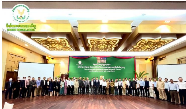
រូបភាពកិច្ចប្រជុំពិភាក្សាផ្ទៃក្នុងក្រសួងលើគម្រោងចំណូល-ចំណាយថវិកាឆ្នាំ២០២៣ របស់ក្រសួងសេដ្ឋកិច្ចនិងហិរញ្ញវត្ថុ។

នាព្រឹកថ្ងៃពុធ ១ កើត ខែអាសាធ ឆ្នាំខាល ចត្វាស័ក ព.ស.២៥៦៦ ត្រូវនឹងថ្ងៃទី២៩ ខែមិថុនា ឆ្នាំ២០២២ លោក យុន វ៉ាន់ណា ប្រធាននាយកដ្ឋានកិច្ចទូទៅ តំណាងដ៏ខ្ពង់ខ្ពស់របស់ ឯកឧត្តម សុខ ដារ៉ា អគ្គនាយកនៃនិយ័តករបរធនបាលកិច្ច ( អ.ប.ប. ) អមដោយសហការី បានចូលរួមកិច្ចប្រជុំពិភាក្សាផ្ទៃក្នុងក្រសួងលើគម្រោងចំណូល-ចំណាយថវិកាឆ្នាំ២០២៣ របស់ក្រសួងសេដ្ឋកិច្ចនិងហិរញ្ញវត្ថុ ដែលបានប្រព្រឹត្តទៅនៅសណ្ឋាគារឆ្នេរសុខា ខេត្តព្រះសីហនុ ក្រោមអធិបតីភាពដ៏ខ្ពង់ខ្ពស់របស់ ឯកឧត្តមបណ្ឌិត សភាពារ្យ ម៉ាន សាហ៊ុម រដ្ឋលេខាធិការ និងជាប្រធានក្រុមការងារថវិកាម៉ាក្រូថ្នាក់ដឹកនាំអង្គភាពថវិកា។