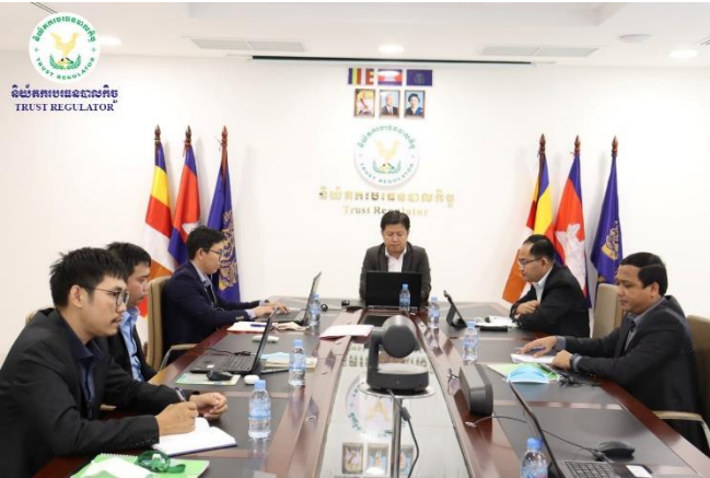
រូបភាព ឯកឧត្តម សុខ ដារ៉ា អមដោយសហការី ក្នុងកិច្ចប្រជុំតាមប្រព័ន្ធ អនឡាញជាមួយថ្នាក់ដឹកនាំនិងតំណាងក្រុមហ៊ុន Phnom Penh Fintech Investment

នាព្រឹកថ្ងៃចន្ទ ១៣រោច ខែជេស្ឋ ឆ្នាំខាល ចត្វាស័ក ព.ស.២៥៦៦ ត្រូវនឹងថ្ងៃទី២៧ ខែមិថុនា ឆ្នាំ២០២២ ឯកឧត្តម សុខ ដារ៉ា អគ្គនាយកនៃនិយ័តករបរទេសបាលកិច្ច (ន.ប.ប.) អមដោយសហការី បានអញ្ជើញចូលរួមសិក្ខាសាលាស្តីពី “កម្មវិធី ចែករំលែកចំណេះដឹងរវាងអគ្គលេខាធិការដ្ឋានអាជ្ញាធរសេវា ហិរញ្ញវត្ថុមិនមែនធនាគារ (អ.ស.ហ.) ជាមួយនឹងអាជ្ញាធរសេវា