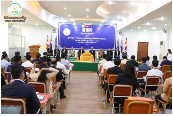
រូបភាពសិក្ខាសាលាផ្សព្វផ្សាយស្តីពី “ក្របខណ្ឌច្បាប់ និងបទប្បញ្ញត្តិពាក់ព័ន្ធ ក្នុងវិស័យបរធនបាលកិច្ច”។

សិក្ខាសាលាផ្សព្វផ្សាយនេះ ក៏មានការចូលរួមពីថ្នាក់ដឹកនាំ និងតំណាងអញ្ជើញមកពីស្ថាប័ន មន្ទីរ និងអង្គភាពនានានៃរដ្ឋបាល ខេត្តស្វាយរៀង, សមាជិក-សមាជិកនៃសភាពាណិជ្ជកម្ម, និងសមាគម ធុរកិច្ចពាក់ព័ន្ធ ព្រមទាំងតំណាងក្រុមហ៊ុនបរធនបាល, ធនាគារ ពាណិជ្ជដែលជាប្រតិបត្តិករបរធនបាលផ្តល់សេវាក្សានុវត្តិភាព ឬសេវាក្សានុវត្តិ, បរធនបាលក្រុមហ៊ុនវាយតម្លៃក្នុងវិស័យបរធនបាលកិច្ច និងរូបវន្តបុគ្គលឯករាជ្យ ដែលទទួលបានអាជ្ញាប័ណ្ណ ការអនុញ្ញាត និងការទទួលស្គាល់ពី ន.ប.ប. ។