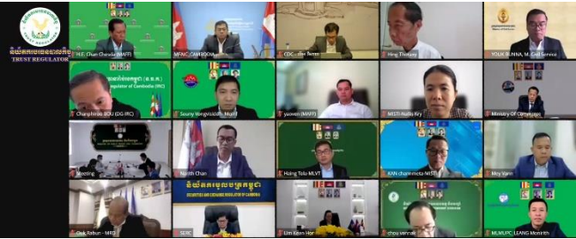
រូបភាពកិច្ចប្រជុំពិនិត្យ និងពិភាក្សាអំពីការរៀបចំសេចក្តីព្រាងគោល នយោបាយអភិវឌ្ឍវិស័យបច្ចេកវិទ្យាហិរញ្ញវត្ថុកម្ពុជា។

នាព្រឹកថ្ងៃចន្ទ ២កើត ខែបឋមសាធ ឆ្នាំថោះ បញ្ចស័ក ព.ស.២៥៦៧ ត្រូវនឹងថ្ងៃទី១៩ ខែមិថុនា ឆ្នាំ២០២៣ ឯកឧត្តម ឆន្ទ ណារតន អគ្គនាយករងនៃនិយ័តករបរធនបាលកិច្ច ( ន.ប.ប. ) តំណាងរបស់ ឯកឧត្តម សុខ ដារ៉ា អគ្គនាយកនៃ ន.ប.ប. និងជា អនុប្រធានក្រុមការងារបច្ចេកទេសស្តីពី “បច្ចេកវិទ្យាហិរញ្ញវត្ថុក្នុង វិស័យហិរញ្ញវត្ថុមិនមែនធនាគារ” អមដោយមន្ត្រីជំនាញ បានចូលរួម កិច្ចប្រជុំពិនិត្យ និងពិភាក្សាអំពីការរៀបចំសេចក្តីព្រាងគោលនយោ- បាយអភិវឌ្ឍវិស័យបច្ចេកវិទ្យាហិរញ្ញវត្ថុកម្ពុជា ក្រោមអធិបតីភាព ដ៏ខ្ពង់ខ្ពស់របស់ ឯកឧត្តមអគ្គបណ្ឌិតសភាចារ្យ អូន ព័ន្ធមុនីរ័ត្ន ឧបនាយករដ្ឋមន្ត្រី រដ្ឋមន្ត្រីក្រសួងសេដ្ឋកិច្ចនិងហិរញ្ញវត្ថុ និងជា ប្រធានគណៈកម្មាធិការសេដ្ឋកិច្ចនិងធុរកិច្ចដ៏ថ្លៃថ្លា តាមប្រព័ន្ធ អនឡាញ Zoom។