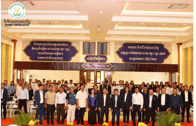
រូបភាពកម្មវិធីសិក្ខាសាលាផ្សព្វផ្សាយស្តីពី “ក្របខណ្ឌច្បាប់ និងបទប្បញ្ញត្តិពាក់ព័ន្ធក្នុងវិស័យបរធនបាលកិច្ច”។

សិក្ខាសាលាផ្សព្វផ្សាយនេះ ក៏មានការចូលរួមពីថ្នាក់ដឹកនាំ និងតំណាងអញ្ជើញមកពីស្ថាប័ន មន្ទីរ និងអង្គភាពនានានៃរដ្ឋបាលខេត្តកោះកុង, សមាជិក-សមាជិកនៃសភាពាណិជ្ជកម្ម, និងសមាគមធុរកិច្ចពាក់ព័ន្ធ ព្រមទាំងតំណាងក្រុមហ៊ុនបរធនបាល, ធនាគារពាណិជ្ជដែលជាប្រតិបត្តិករបរធនបាលផ្តល់សេវារក្សាសុវត្ថិភាពឬសេវារក្សាទុក, បរធនបាលក្រុមហ៊ុនវាយតម្លៃក្នុងវិស័យបរធនបាលកិច្ច និងរូបវន្តបុគ្គលឯករាជ្យ ដែលទទួលបានអាជ្ញាប័ណ្ណការអនុញ្ញាត និងការទទួលស្គាល់ពី ន.ប.ធន. ។