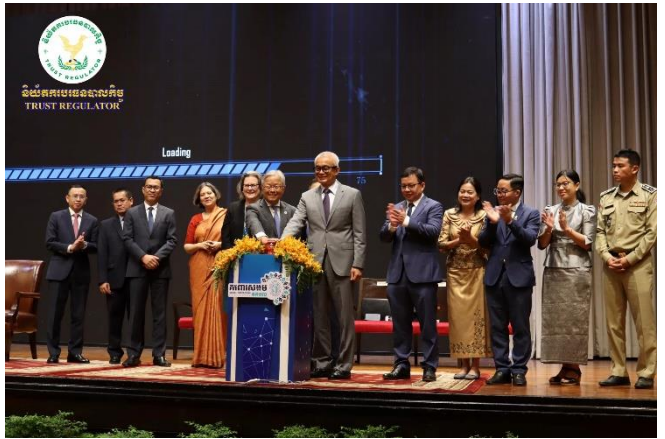
រូបភាពពិធីដាក់ឱ្យដំណើរការជាផ្លូវការនូវគម្រោងធ្វើសុខដុមនីយកម្ម ប្រព័ន្ធចុះបញ្ជី និងគ្រប់គ្រងទិន្នន័យគាំពារសង្គម។

នាព្រឹកថ្ងៃអង្គារ ១០រោច ខែជេស្ឋ ឆ្នាំថោះ បញ្ចស័ក ព.ស. ២៥៦៧ ត្រូវនឹងថ្ងៃទី១៣ ខែមិថុនា ឆ្នាំ២០២៣ ឯកឧត្តម សុខ ដារ៉ា អគ្គនាយកនៃនិយ័តករបរធនបាលកិច្ច ( ន.ប.ឆ. ) អមដោយសហការី បានអញ្ជើញចូលរួម "ពិធីដាក់ឱ្យដំណើរការជាផ្លូវការនូវគម្រោងធ្វើសុខដុមនីយកម្មប្រព័ន្ធចុះបញ្ជី និងគ្រប់គ្រងទិន្នន័យគាំពារសង្គម" របស់អគ្គលេខាធិការដ្ឋានក្រុមប្រឹក្សាជាតិគាំពារសង្គម ក្រោមអធិបតីភាពដ៏ខ្ពង់ខ្ពស់របស់ ឯកឧត្តមអគ្គបណ្ឌិតសភាចារ្យ អនុ ព័ន្ធមុនីរ័ត្ន ឧបនាយករដ្ឋមន្ត្រី រដ្ឋមន្ត្រីក្រសួងសេដ្ឋកិច្ចនិងហិរញ្ញវត្ថុ (កសហវ) និងជាប្រធានក្រុមប្រឹក្សាជាតិគាំពារសង្គម នៅសណ្ឋាគារ សូហ្វីតែល ភ្នំពេញ ភូគីត្រា។