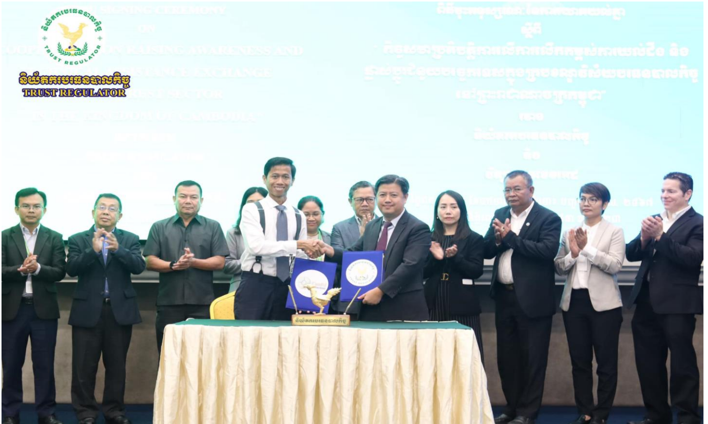
រូបភាពពិធីចុះអនុស្សរណៈនៃការយោគយល់គ្នា (MoU) ជាមួយវិទ្យាស្ថានខេមបូឌី ស្តីពី "កិច្ចសហប្រតិបត្តិការលើការលើកកម្ពស់ការយល់ដឹង និងផ្លាស់ប្តូរជំនួយបច្ចេកទេសក្នុងក្របខណ្ឌវិស័យបរទេសបាលកិច្ចនៅព្រះរាជាណាចក្រកម្ពុជា"។