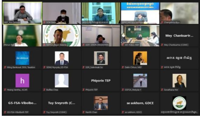
រូបភាព៖ កិច្ចប្រជុំដើម្បីត្រៀមលក្ខណៈសម្រាប់ការចុះត្រួតពិនិត្យដល់ទីកន្លែងរបស់ក្រុមការងារ ICRG-JG។