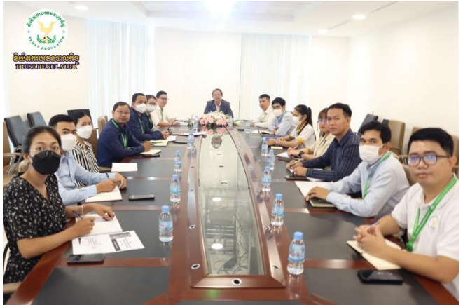
រូបភាព៖ កិច្ចប្រជុំបូកសរុបការងារប្រចាំឆ្នាំ២០២២ និងទិសដៅការងារប្រចាំឆ្នាំ២០២៣ របស់នាយកដ្ឋានចុះបញ្ជីបរទេសបាលកិច្ច។