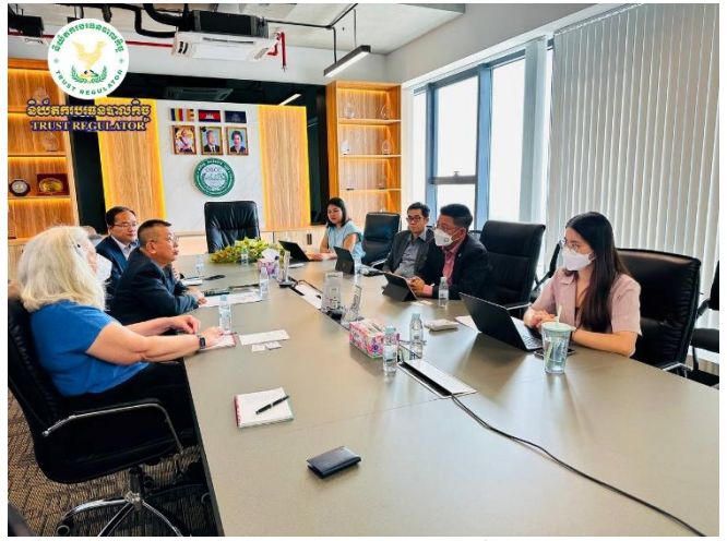
រូបភាព៖ កិច្ចប្រជុំពិភាក្សាការងារជាមួយថ្នាក់ដឹកនាំ និងមន្ត្រីទទួលបន្ទុក សម្របសម្រួលការអនុវត្តគម្រោង ACSEP នៃសាជីវកម្មធានាឥណទាន កម្ពុជា (CGCC)