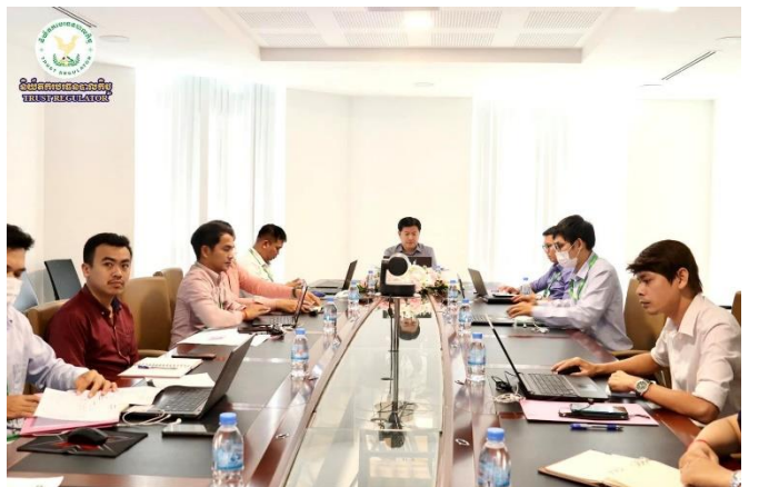
រូបភាព៖ កិច្ចប្រជុំរបស់ក្រុមការងារបច្ចេកទេសទទួលបន្ទុកបច្ចេកវិទ្យាហិរញ្ញវត្ថុក្នុងវិស័យហិរញ្ញវត្ថុមិនមែនធនាគារ។