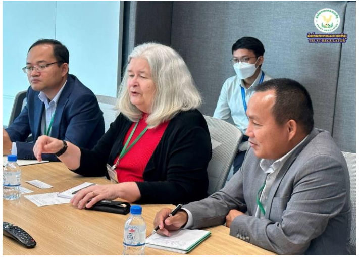
រូបភាព៖ ប្រជុំពិភាក្សាការងារជាមួយថ្នាក់ដឹកនាំ និងមន្ត្រីទទួលបន្ទុកសម្របសម្រួលការអនុវត្តគម្រោង ACSEP នៃធនាគារស្ថាបនា (SPNB)។