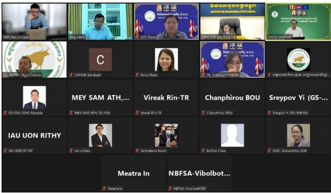
រូបភាព៖ កិច្ចប្រជុំបច្ចេកទេសអន្តរនិយ័តករ ក្រោមអធិបតីភាពដ៏ខ្ពង់ខ្ពស់របស់ ឯកឧត្តម រស់ សីលវ៉ា រដ្ឋលេខាធិការក្រសួងសេដ្ឋកិច្ចនិងហិរញ្ញវត្ថុ និងជា អនុប្រធានក្រុមប្រឹក្សាអាជ្ញាធរសេវាហិរញ្ញវត្ថុមិនមែនធនាគារ (អ.ស.ហ.)

នារសៀលថ្ងៃអង្គារ ១០កើត ខែមាយ ឆ្នាំខាល ចត្វាស័ក ព.ស.២៥៦៦ ត្រូវនឹងថ្ងៃទី៣១ ខែមករា ឆ្នាំ២០២៣ ឯកឧត្តម សុខ ដំរី អគ្គនាយកនៃនិយ័តករធនបាលកិច្ច ( ន.ប.ធន ) អមដោយ កញ្ញា ឈាន សុខាវី ប្រធាននាយកដ្ឋានកិច្ចការគតិយុត្ត និង អធិការកិច្ច និងមន្ត្រីជំនាញ បានចូលរួមកិច្ចប្រជុំបច្ចេកទេសអន្តរនិយ័តករ ក្រោមអធិបតីភាពដ៏ខ្ពង់ខ្ពស់របស់ ឯកឧត្តម រស់ សីលវ៉ា រដ្ឋលេខាធិការក្រសួងសេដ្ឋកិច្ចនិងហិរញ្ញវត្ថុ និងជាអនុប្រធាន ក្រុមប្រឹក្សាអាជ្ញាធរសេវាហិរញ្ញវត្ថុមិនមែនធនាគារ ( អ.ស.ហ. ) ដើម្បីពិនិត្យ និងពិភាក្សាលើរបៀបវារៈចំនួនពីរ ៖ ១.សេចក្តីប្រាង គោលការណ៍ណែនាំស្តីពី “ នីតិវិធី និងបែបបទនៃការរៀបចំលិខិត បទដ្ឋានគតិយុត្ត និងលិខិតរដ្ឋបាលនៃអាជ្ញាធរសេវាហិរញ្ញវត្ថុមិនមែនធនាគារ ” និង ២.សេចក្តីប្រាងច្បាប់ស្តីពី “ អាជីវកម្មនិងសេវា កម្មអចលនវត្ថុ ” តាមប្រព័ន្ធអនឡាញ Zoom។