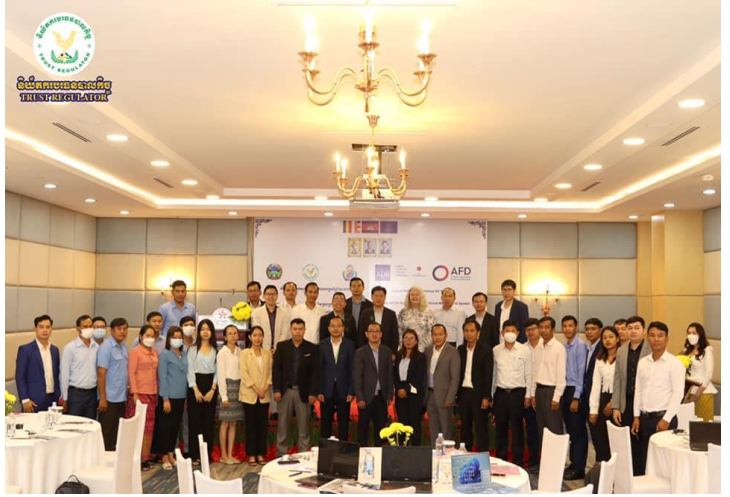
រូបភាព៖ សិក្ខាសាលាបូកសរុបលទ្ធផលការងារប្រចាំឆ្នាំ២០២២ និងលើកទិសដៅការងារសម្រាប់ឆ្នាំ២០២៣ នៃគម្រោង ACSEP សមាសភាគទី១ និងវគ្គបណ្តុះបណ្តាលស្តីពីការរៀបចំប្រព័ន្ធគ្រប់គ្រងហានិភ័យ និងសង្គម (ESMS)