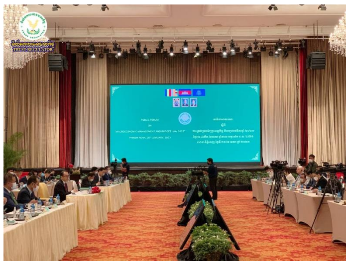
រូបភាព៖ វេទិកាសាធារណៈស្តីពី "ការគ្រប់គ្រងម៉ាក្រូសេដ្ឋកិច្ច និងច្បាប់ថវិកាឆ្នាំ២០២៣"។