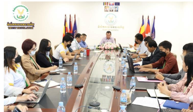
រូបភាព៖ កិច្ចប្រជុំបូកសរុបការងារប្រចាំខែធ្នូ ឆ្នាំ២០២២ និងទិសដៅការងារប្រចាំខែមករា ឆ្នាំ២០២៣ ក្នុងកម្រិតអន្តរនាយកដ្ឋាន