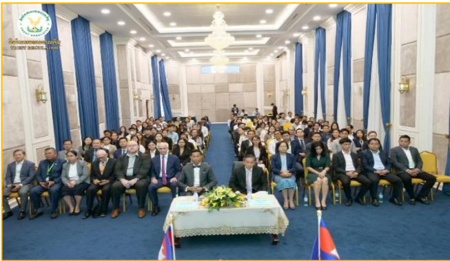
រូបភាព៖ ពិធីចុះអនុស្សរណៈនៃការយោគយល់គ្នារវាងនិយ័តករធានារ៉ាប់រងកម្ពុជា និងវិទ្យាស្ថាន ខេមអេដ។

នាព្រឹកថ្ងៃពុធ ១១រោច ខែមាយ ឆ្នាំថោះ បញ្ចស័ក ព.ស. ២៥៦៧ ត្រូវនឹងថ្ងៃទី៦ ខែមីនា ឆ្នាំ២០២៤ ឯកឧត្តម ឈី សាគល អគ្គនាយករងនៃនិយ័តករធនបាលកិច្ច ( ន.ប.ប. ) តំណាងដ៏ខ្ពង់ខ្ពស់របស់ ឯកឧត្តម សុខ ដារ៉ា អគ្គនាយកនៃ ន.ប.ប. បានអញ្ជើញចូលរួមក្នុងពិធីចុះអនុស្សរណៈនៃការយោគយល់គ្នារវាង និយ័តករធានារ៉ាប់រងកម្ពុជា និងវិទ្យាស្ថាន ខេមអេដ ស្តីពី "កិច្ចសហប្រតិបត្តិការលើការលើកកម្ពស់ការយល់ដឹង និងការអភិវឌ្ឍធនធានមនុស្ស នៅក្នុងវិស័យធានារ៉ាប់រងនៅព្រះរាជាណាចក្រកម្ពុជា" នៅទីស្តីការអាជ្ញាធរសេវាហិរញ្ញវត្ថុមិនមែនធនាគារ។