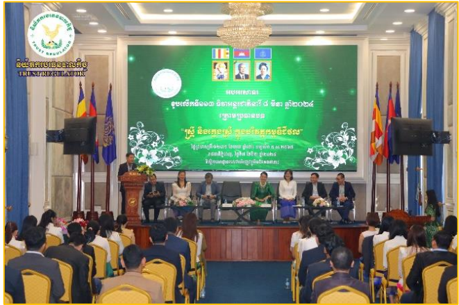
រូបភាព៖ កម្មវិធី “ស្ត្រី និងក្មេងស្រី ក្នុងបរិវេណកម្មវិធីជីវិត”។

នាសៀលថ្ងៃពុធ ១១ រោច ខែមាយ ឆ្នាំថោះ បញ្ចស័ក ព.ស. ២៥៦៧ ត្រូវនឹងថ្ងៃទី១២ ខែមីនា ឆ្នាំ២០២៤ ឯកឧត្តម សុខ ដារ៉ា អគ្គនាយកនៃនិយ័តករបរធនបាលកិច្ច (ន.ប.ធន.) អមដោយ លោកស្រី ឈាន សុខាវី ប្រធាននាយកដ្ឋានកិច្ចការគតិយុត្ត និងអធិការកិច្ច និងសហការី បានចូលរួមកិច្ចប្រជុំបច្ចេកទេសនៃអង្គភាពក្រោមឱវាទអាជ្ញាធរសេវាហិរញ្ញវត្ថុមិនមែនធនាគារ (អ.ស.ហ.) តាមប្រព័ន្ធអនឡាញ (Zoom) ក្រោមការដឹកនាំដ៏ខ្ពង់ខ្ពស់របស់ ឯកឧត្តម រស់ សីលធី រដ្ឋលេខាធិការក្រសួងសេដ្ឋកិច្ចនិងហិរញ្ញវត្ថុ និងជាអនុប្រធានក្រុមប្រឹក្សា អ.ស.ហ. ដើម្បីពិនិត្យ និងពិភាក្សាលើសេចក្តីព្រាងប្រកាសស្តីពីការធានារ៉ាប់រងបន្ត របស់និយ័តករធានារ៉ាប់រងកម្ពុជា។