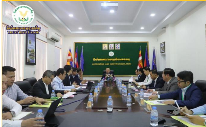
រូបភាព៖ កិច្ចប្រជុំលើកទី៣ នៃគណៈកម្មាធិការគ្រប់គ្រងកម្មវិធីសិក្សាគណនេយ្យករជំនាញកម្ពុជា។

នាព្រឹកថ្ងៃអង្គារ ៣កើត ខែផល្គុន ឆ្នាំថោះ បញ្ចស័ក ព.ស. ២៥៦៧ ត្រូវនឹងថ្ងៃទី១២ ខែមីនា ឆ្នាំ២០២៤ ឯកឧត្តម ឈី សាកល អគ្គនាយករងនៃនិយ័តករបរិច្ឆេទបាលកិច្ច ( ន.ប.ប. ) តំណាងដ៏ខ្ពង់ខ្ពស់របស់ ឯកឧត្តម សុខ ដារី អគ្គនាយកនៃ ន.ប.ប. បានអញ្ជើញចូលរួមកិច្ចប្រជុំលើកទី៣ នៃគណៈកម្មាធិការគ្រប់គ្រងកម្មវិធីសិក្សាគណនេយ្យករជំនាញកម្ពុជា ( គ.ក.គ.ក ) ក្រោមអធិបតីភាពរបស់ ឯកឧត្តម ច័ សាយី រដ្ឋលេខាធិការក្រសួងសេដ្ឋកិច្ចនិងហិរញ្ញវត្ថុ ( កសហច ) និងជាប្រធាន គ.ក.គ.ក ដោយមានការអញ្ជើញចូលរួមពី ឯកឧត្តមលោកជំទាវ លោក លោកស្រីដែលជាថ្នាក់ដឹកនាំក្រសួង ស្ថាប័ន និងអង្គការពាក់ព័ន្ធ នៅទីស្តីការ កសហច ។