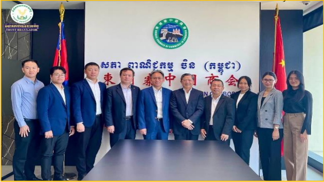
រូបភាព៖ កិច្ចប្រជុំពិភាក្សាការងាររវាង អ.ស.ប. និងសភាពាណិជ្ជកម្មចិន (កម្ពុជា)។

លើកទី១៧ ក្រោមអធិបតីភាពដ៏ខ្ពង់ខ្ពស់របស់ ឯកឧត្តមអគ្គបណ្ឌិត សភាសហប្រតិបត្តិការសហគ្រាសកម្ពុជា អនុលោមតាមការណែនាំរបស់កិច្ចសន្យាសហប្រតិបត្តិការ និងហិរញ្ញវត្ថុ និងជាប្រធានក្រុមប្រឹក្សា អ.ស.ប. នៅអគារអាជ្ញាធរសេវាហិរញ្ញវត្ថុមិនមែនធនាគារ។ ជាលទ្ធផល អង្គប្រជុំបានអនុម័តលើសេចក្តីព្រាង "ផែនការអភិវឌ្ឍន៍ស្ថាប័ន បច្ចុប្បន្នកម្មសម្រាប់រយៈពេល ១០ ឆ្នាំ (២០២១-២០៣០) របស់និយ័តករធនបាលកិច្ច" ដោយស្នើឱ្យជំនាញពិនិត្យបន្ថែមលើអក្ខរាវិរុទ្ធ និងលើចំណុចខ្លះៗ