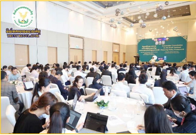
រូបភាព: កិច្ចប្រជុំពិគ្រោះយោបល់លើសេចក្តីព្រាងក្របខ័ណ្ឌគោលនយោបាយហិរញ្ញប្បទានជាតិ។