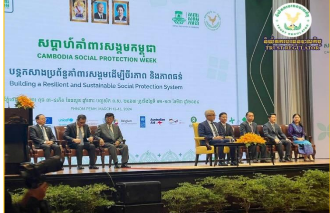
រូបភាព៖ កម្មវិធី “សប្តាហ៍គាំពារសង្គមកម្ពុជាឆ្នាំ២០២៤”។