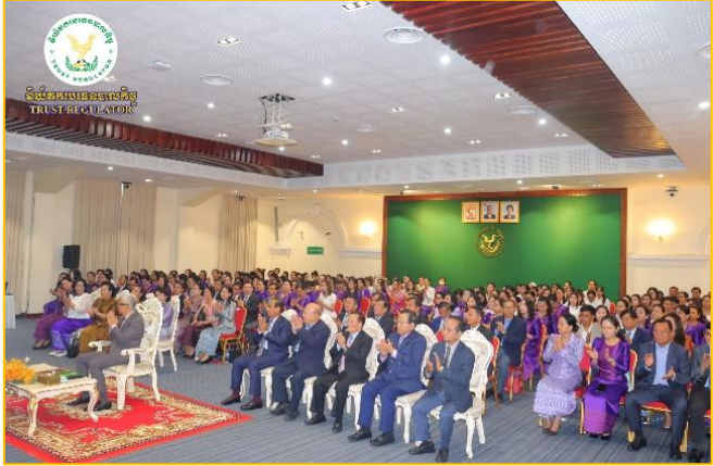
រូបភាព៖ ពិធីសំណេះសំណាលអបអរសាទរខួបលើកទី១១៣ ទិវាអន្តរជាតិនារី ៨មីនា ឆ្នាំ២០២៤ ក្រោមប្រធានបទ “ស្ត្រី និងក្មេងស្រីក្នុងបរិវេណកម្មវិធីជីវិត”។

របស់ ឯកឧត្តម ក្រុង បណ្ឌិត កែវ កែវ អគ្គនាយករងនៃនិយ័តករបរិច្ឆេទបាលកិច្ច ( ន.ប.ប. ) អមដោយការដឹកនាំរបស់ ឯកឧត្តម សេដ្ឋកិច្ច និងហិរញ្ញវត្ថុ នៅទីស្តីការក្រសួងសេដ្ឋកិច្ចនិងហិរញ្ញវត្ថុ។