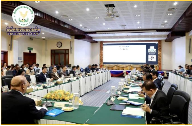
រូបភាព៖ កិច្ចប្រជុំផ្សព្វផ្សាយអនុក្រឹត្យស្តីពី "ការរៀបចំ និងការប្រព្រឹត្តទៅនៃអង្គភាពសវនកម្មផ្ទៃក្នុង"។