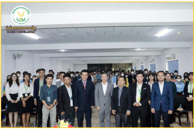
រូបភាព៖ សិក្ខាសាលាស្តីពី ការឈ្វេងយល់ពីកិច្ចដំណើរការអភិវឌ្ឍន៍វិស័យបរទេសបាលកិច្ចនៅព្រះរាជាណាចក្រកម្ពុជា។

សិក្ខាសាលានេះត្រូវបានរៀបចំឡើងក្នុងគោលដៅបញ្ជាក់ការយល់ដឹងជាសាធារណៈឱ្យបានកាន់តែទូលំទូលាយ និងស៊ីជម្រៅសម្រាប់និស្សិតនៅសាកលវិទ្យាល័យ អំពីយន្តការប្រតិបត្តិការបរទេសបាលកិច្ច បទដ្ឋានគតិយុត្តពាក់ព័ន្ធ គុណប្រយោជន៍នៃវិស័យបរទេសបាលកិច្ច។ សិក្ខាសាលានេះក៏បានផ្តល់ឱកាសដល់និស្សិតដើម្បីធ្វើការបង្កើនចំណេះដឹងបន្ថែមពាក់ព័ន្ធនឹងវិស័យហិរញ្ញវត្ថុមិនមែនធនាគារផងដែរ។ កម្មវិធីនេះ មានការអញ្ជើញចូលរួមពីថ្នាក់ដឹកនាំជាន់ខ្ពស់នៃ ឧ.ប.ធរ. និងមន្ត្រីជំនាញ, សាស្ត្រាចារ្យ, និងនិស្សិតនៃសាកលវិទ្យាល័យកម្ពុជា។