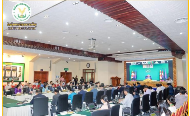
រូបភាព៖ ពិភាក្សាលើការរៀបចំយន្តការណ៍គន្លឹះ សម្រាប់ជាមូលដ្ឋាន រៀបចំសេចក្តីព្រាងឯកសារក្របខណ្ឌ និងវិធាននៃប្រព័ន្ធសវនកម្មផ្ទៃក្នុង។

នាព្រឹកថ្ងៃសុក្រ ១៣កើត ខែផល្គុន ឆ្នាំថោះ បញ្ចស័ក ព.ស. ២៥៦៧ ត្រូវនឹងថ្ងៃទី២១ ខែមីនា ឆ្នាំ២០២៤ ឯកឧត្តម សុខ ដារ៉ា អគ្គនាយកនៃនិយ័តករបរធនបាលកិច្ច ( ន.ប.ធន. ) អមដោយ លោក ជី គន់នី ប្រធានការិយាល័យគណនេយ្យ និងហិរញ្ញវត្ថុនៃ នាយកដ្ឋានកិច្ចការទូទៅ បានអញ្ជើញចូលរួមកិច្ចប្រជុំថ្នាក់ដឹកនាំ សេដ្ឋកិច្ចនិងហិរញ្ញវត្ថុ ( កសហន ) ដើម្បីពិនិត្យ ពិភាក្សាលើការរៀបចំ យន្តការណ៍គន្លឹះ សម្រាប់ជាមូលដ្ឋានរៀបចំសេចក្តីព្រាងឯកសារ ក្របខណ្ឌ និងវិធាននៃប្រព័ន្ធសវនកម្មផ្ទៃក្នុង និងអធិការកិច្ច ក្រោមអធិបតីភាពដ៏ខ្ពង់ខ្ពស់របស់ ឯកឧត្តមអគ្គបណ្ឌិតសភាចារ្យ អូន ព័ន្ធមុនីរ័ត្ន ឧបនាយករដ្ឋមន្ត្រី រដ្ឋមន្ត្រី កសហន និងមានការ អញ្ជើញចូលរួមពី ឯកឧត្តម លោកជំទាវ លោក លោកស្រី ដែល ជាថ្នាក់ដឹកនាំក្រសួង ស្ថាប័ន និងអង្គភាពពាក់ព័ន្ធក្នុងក្របខណ្ឌ កសហន នៅទីស្តីការ កសហន ។