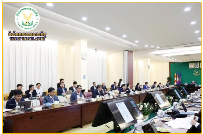
រូបភាព៖ កិច្ចប្រជុំលើកទី ៥ នៃគណៈកម្មាធិការសេដ្ឋកិច្ច និងធុរកិច្ច ឌីជីថល។

លើរបៀបវារៈចំនួន ៥ រួមមាន៖ ១.របាយការណ៍វឌ្ឍនភាពការងារ របស់អគ្គលេខាធិការដ្ឋាន គ.ស.ធន.ខ. , ២.ការស្នើសុំការអនុម័តលើ សេចក្តីព្រាងផែនការសកម្មភាព ៣ ឆ្នាំរំកិល ២០២៤-២០២៦ នៃ គោលនយោបាយអភិវឌ្ឍន៍វិទ្យាហិរញ្ញវត្ថុកម្ពុជា, ៣.របាយការណ៍ វឌ្ឍនភាពប្រចាំឆ្នាំ ២០២៣ នៃការអនុវត្តផែនការសកម្មភាព ៣ ឆ្នាំ រំកិល ២០២៣-២០២៥ របស់គណៈកម្មាធិការសេដ្ឋកិច្ច និងធុរកិច្ច ឌីជីថល, ៤.ការវាយតម្លៃតម្រូវការនៃការធ្វើឌីជីថលបន្ថែមរបស់ សហគ្រាសក្នុងប្រទេសកម្ពុជា, ៥.ការស្នើសុំពិនិត្យកម្រងបទប្បញ្ញត្តិ គតិយុត្តពាក់ព័ន្ធសេដ្ឋកិច្ចនិងធុរកិច្ចឌីជីថល។