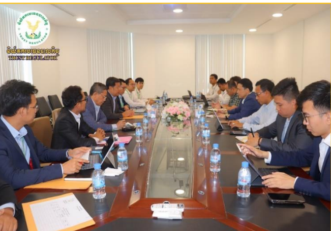
រូបភាព៖ កិច្ចពិភាក្សាការងាររវាង ឧ.ប.ធរ. ជាមួយក្រុមហ៊ុនអចលនទ្រព្យ និងក្រុមហ៊ុនបច្ចេកវិទ្យាព័ត៌មានវិទ្យា។